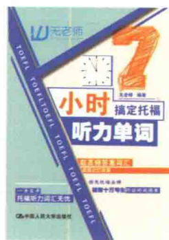
《7小时搞定托福听力单词》

在这里郑重感谢各位考生和同仁对无老师的关注，是你们的支持让无老师走到了今天。致力于打造中国托福培训行业标准的我们，打破常规，采取完全不同于前人的教学体系，专门针对新托福考试的特点全新定做教学计划，强调考生对于知识的理解和运用，真正做到提高考生分数的目的。