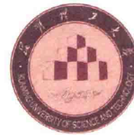
昆明理工大学 建筑与城市规划学院