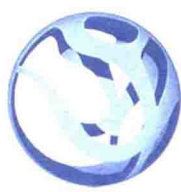
高等学校城乡规划 学科专业指导委员会