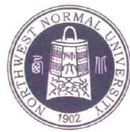
西北师范大学 地理与环境科学学院