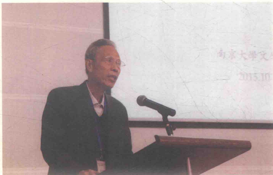
2015年在南京大学主办的第四届骈文国际学术研讨会上致辞