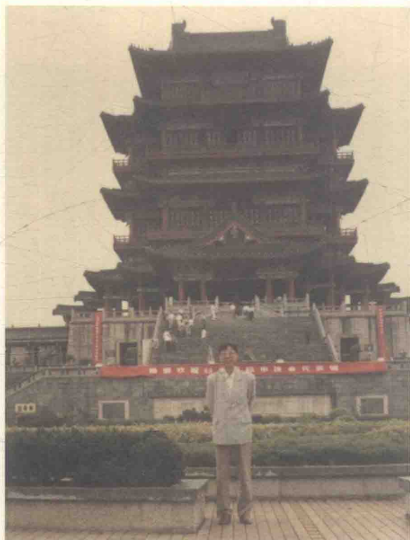
1990年摄于江西南昌滕王阁