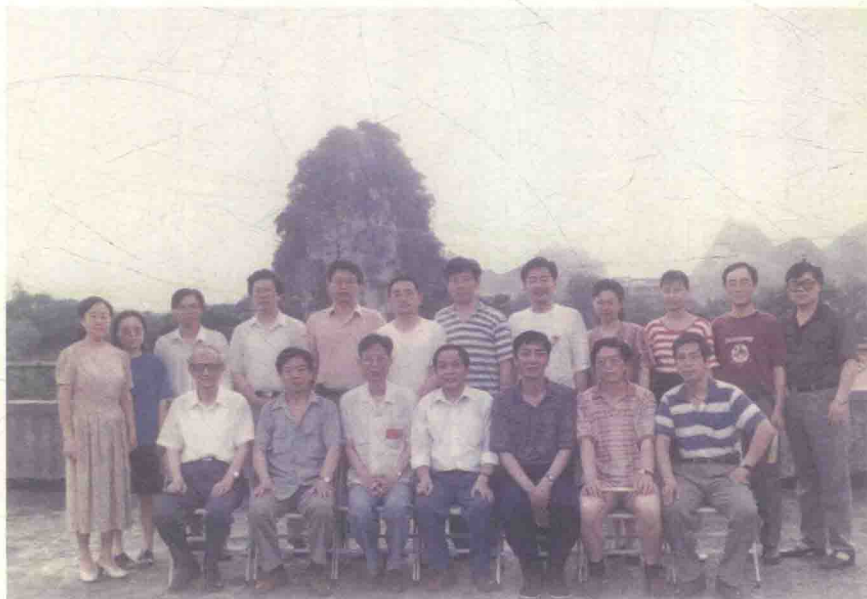
1996年广西师范大学主办的第一届中国骈文学学术研讨会上， 部分代表摄于桂林王城内