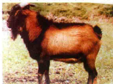
彩图 3 成都麻羊