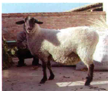
彩图 1 萨福克和滩羊杂交一代