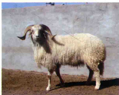
彩图 18 滩羊