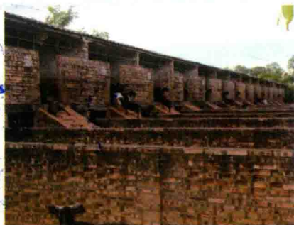
彩图 46 楼式羊舍一