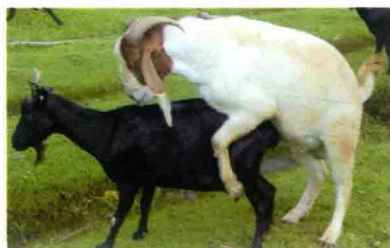
彩图 23 羊本交