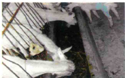
彩图 41 食槽