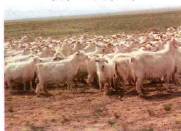
彩图 6 内蒙古绒山羊