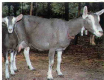
彩图15 吐根堡奶山羊