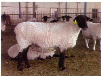
彩图 29 萨福克羊