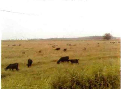
彩图 32 放牧羊