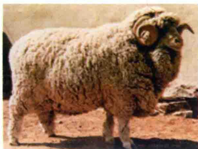
彩图 20 中国美利奴羊