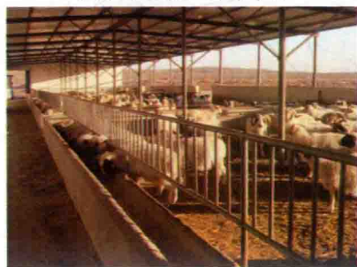
彩图 35 羊舍