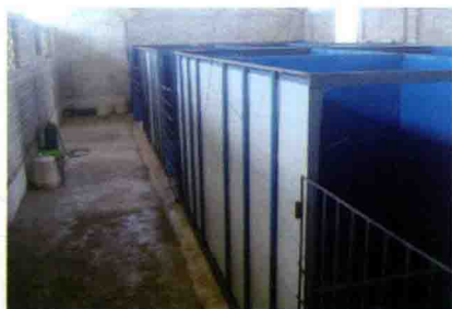
彩图 44 分娩羊舍