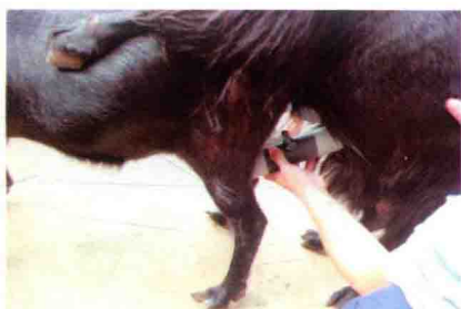
彩图 26 人工采精二