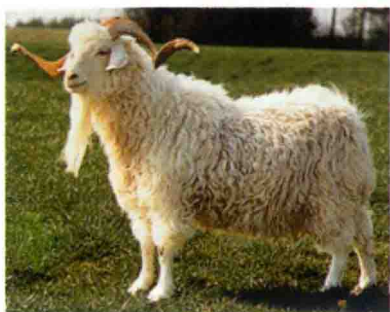
彩图 17 安哥拉山羊