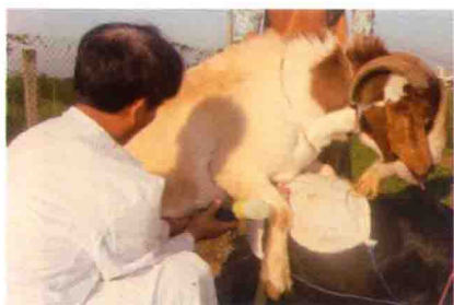
彩图 25 人工采精一