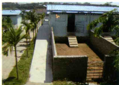
彩图 48 塑料大棚羊舍