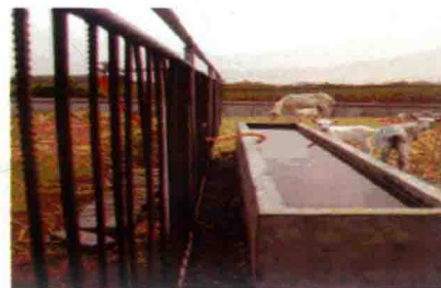
彩图 40 水槽