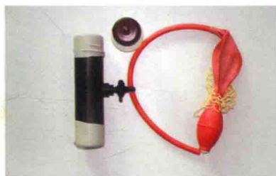
彩图 24 羊假阴道