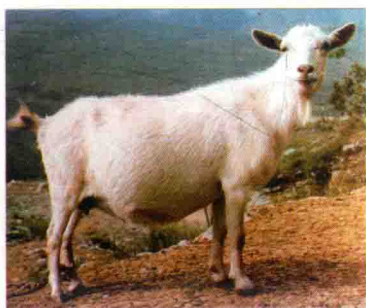
彩图 2 马头山羊(公)