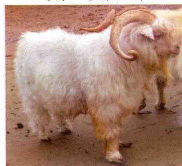
彩图 7 中卫山羊