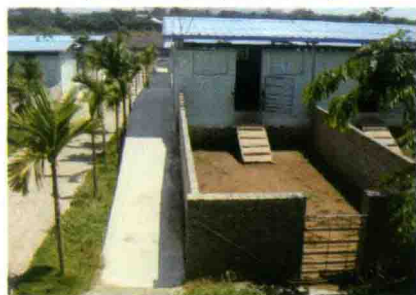
彩图 47 楼式羊舍二