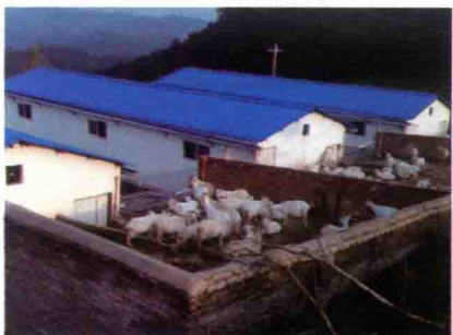
彩图 31 羊场全貌