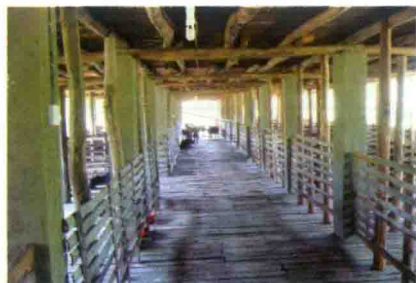
彩图 43 放牧饲养羊舍