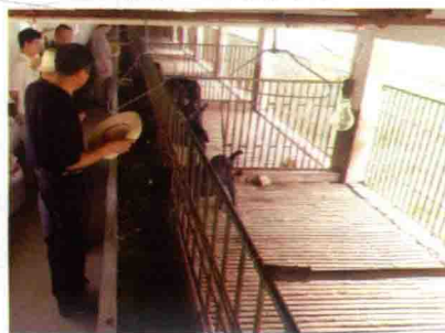
彩图 36 漏缝地板羊圈一