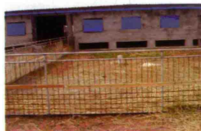
彩图 39 运动场和围栏