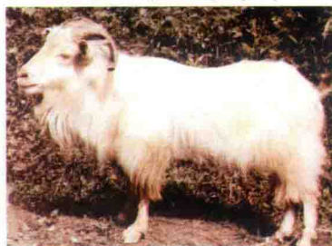
彩图 4 板角山羊