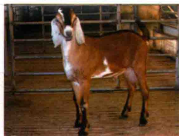
彩图16 努比亚奶山羊