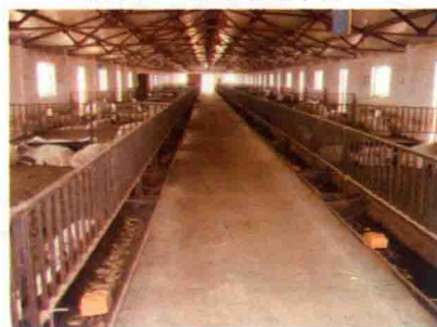
彩图 38 双列式羊舍