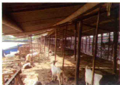
彩图 33 农户简易羊舍