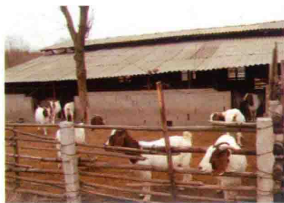
彩图 34 简易羊舍