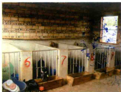
彩图 45 舍饲山羊分娩舍