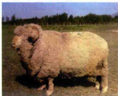
彩图 21 新疆细毛羊