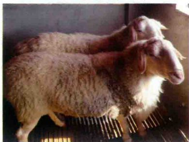
彩图 19 湖羊