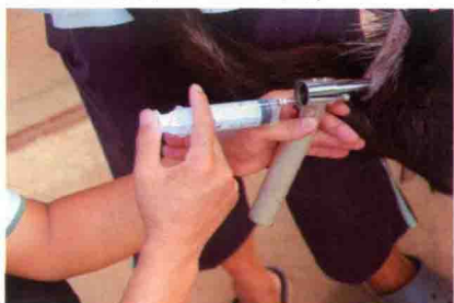
彩图 28 人工输精