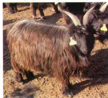
彩图 8 济宁青山羊