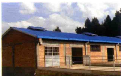
彩图 42 长方形羊舍