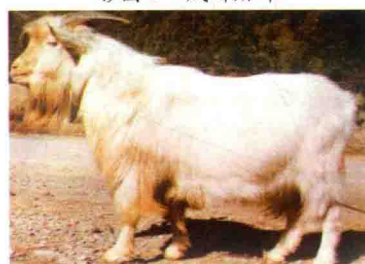
彩图 5 宜昌白山羊