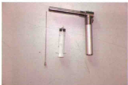
彩图 27 羊输精器具