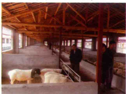
彩图 30 圈养湖羊