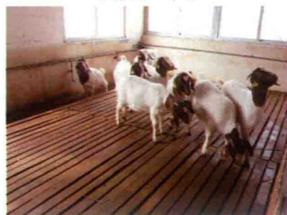
彩图 37 漏缝地板羊圈二