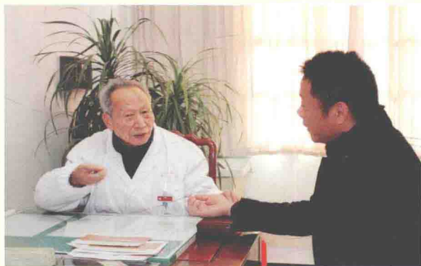
2013年3月3日,金华市中医医院启动省级名老中医传承工作室