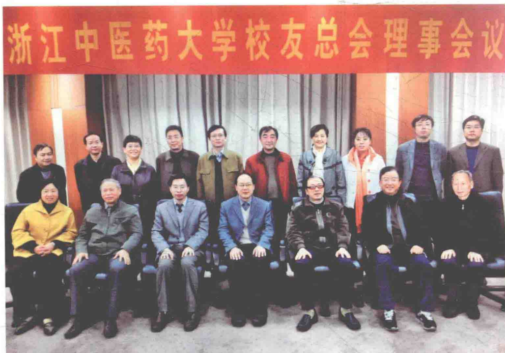
浙江中医药大学校友总会理事会议