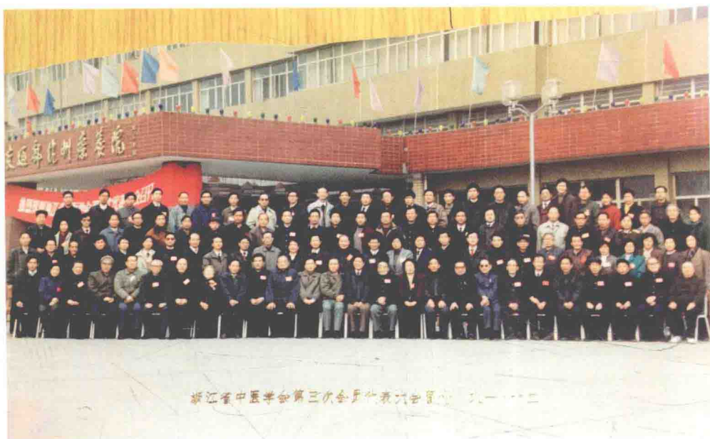
浙江省中医学会儿科学分会第三次会员代表大会留念