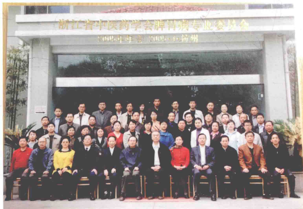
浙江省中医药学会脾胃病专业委员会委员合影