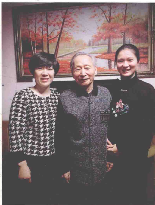
2015年10月30日祖孙三代合影