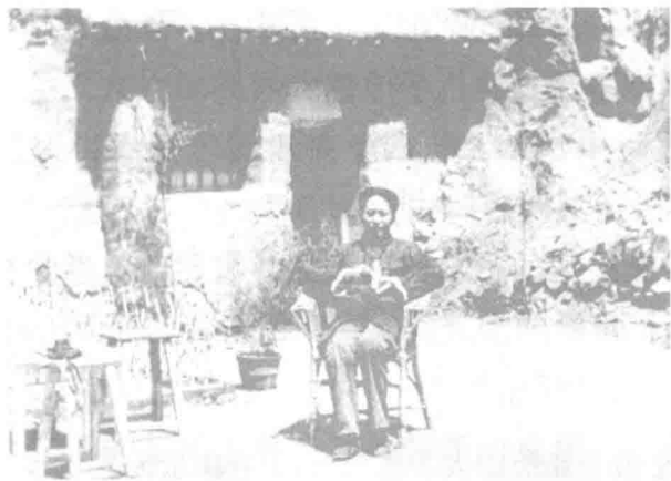
毛泽东在李家窑院

1937年4月至8月，毛泽东在抗大给学员讲授哲学，开始宣传将马克思主义哲学与中国革命实际相结合的哲学——中国化的马克思主义哲学。给抗大学员讲哲学既体现了毛泽东对哲学的偏爱，也体现了他宣传中国化的马克思主义哲学思想的