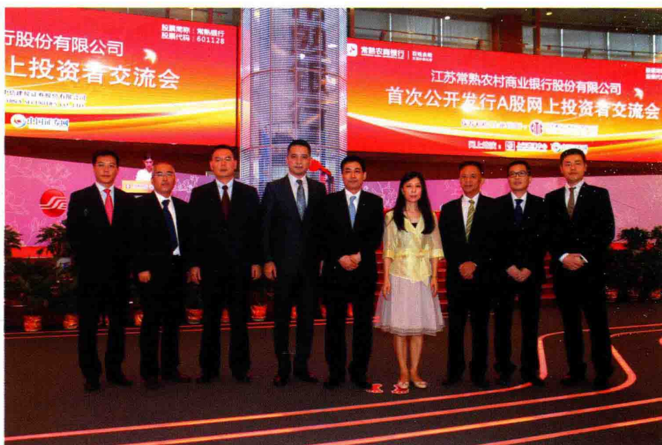
2016年9月19日，接待常熟银行新股发行网上路演嘉宾