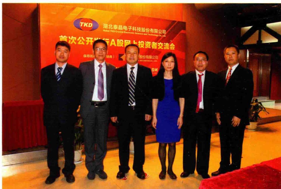
2016年9月14日，接待泰晶电子新股发行网上路演嘉宾