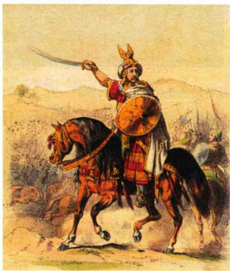
◆ 欧洲人笔下的阿拉伯侵略者

亚王朝所派出的一支由400名步兵、100名骑兵组成的远征军得以顺利登陆并如入无人之境般烧杀掠夺。有了这样成功的先例，公元711年，阿拉伯倭马亚王朝在北非纠集了7000余人再次在直布罗陀地区登陆，仅仅几个月的时间便横扫了西哥特王国的大半国土，攻陷其首都托莱多。