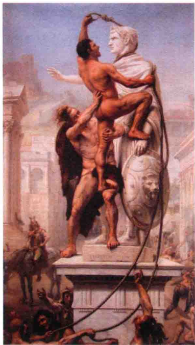
◆ 西哥特人攻陷罗马

法兰克人是日耳曼民族大迁徙中形成的一个多部落联盟的统称。由于混杂着多种语言和文化，法兰克人最初在西罗马帝国崩溃后群雄逐鹿时并不占据优势。由继承权所引发的分裂和内战极大地消耗了法兰克人本不雄厚的力量。直到公元