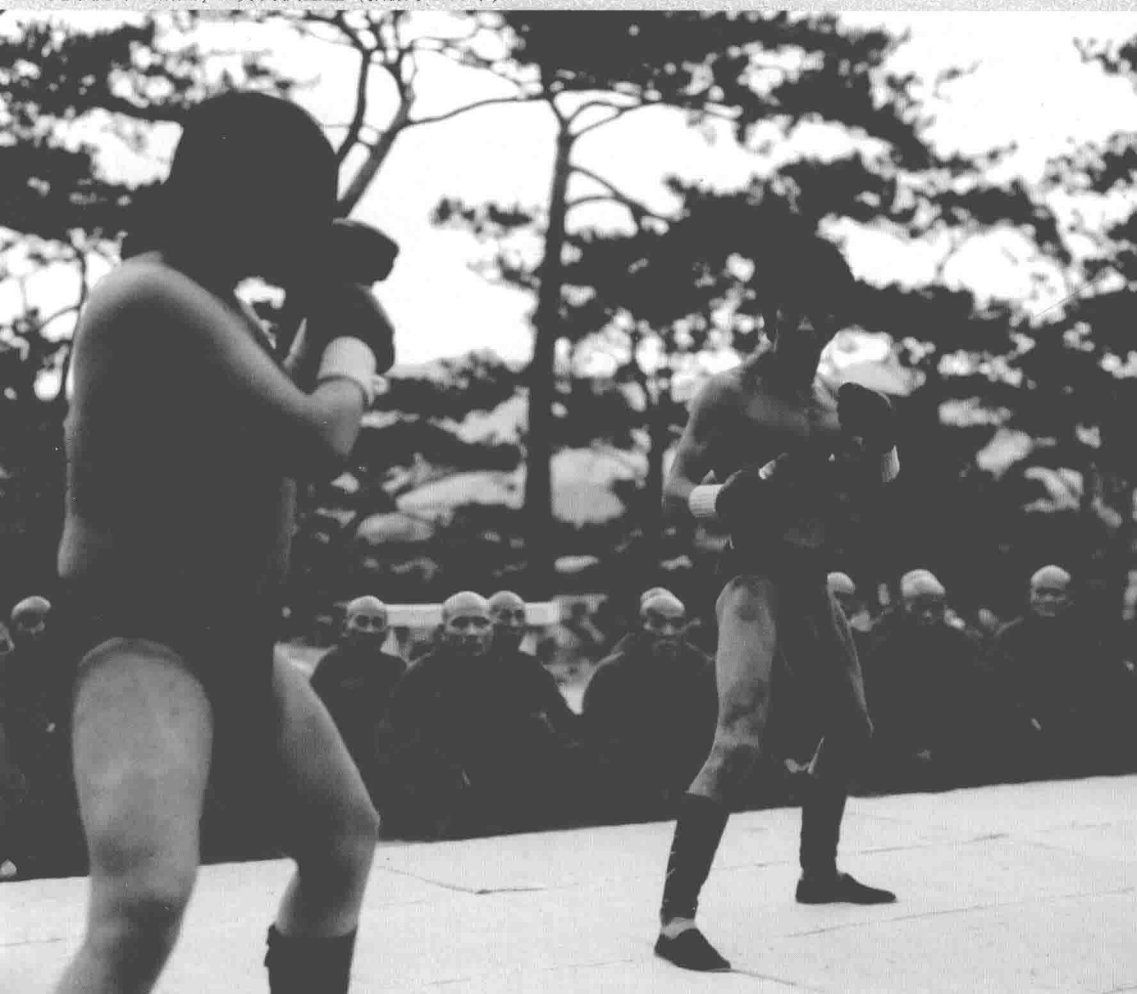
■ 《龙争虎斗》剧照，左方为洪金宝（拍摄于1973年）