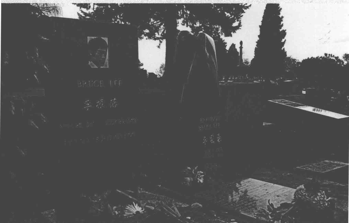
■ 李小龙与其子李国豪的双墓