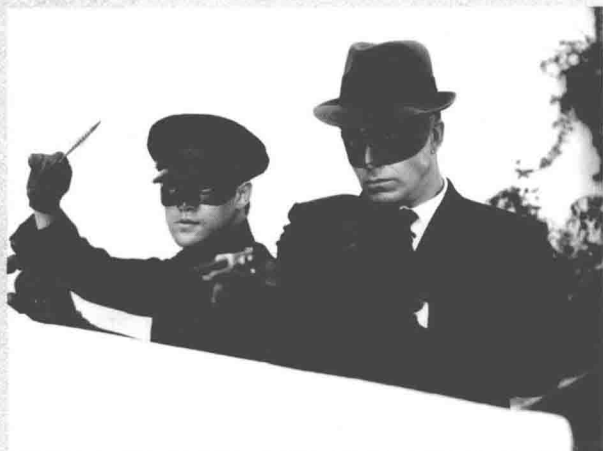
■ 《青蜂侠》系列宣传照（拍摄于1966年左右）