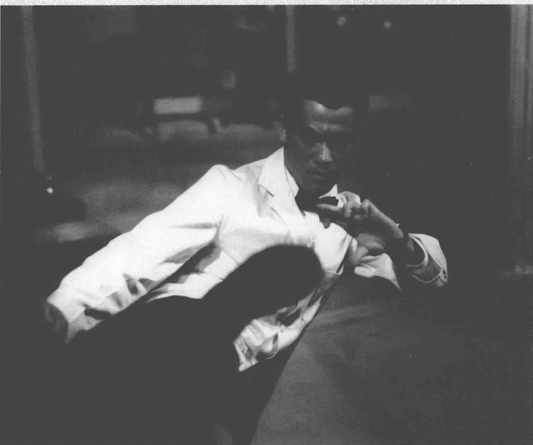
■ 《青蜂侠》花絮照（拍摄于1966年左右）