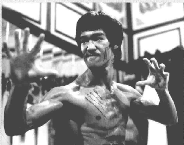
■ 《龙争虎斗》剧照（拍摄于1973年）