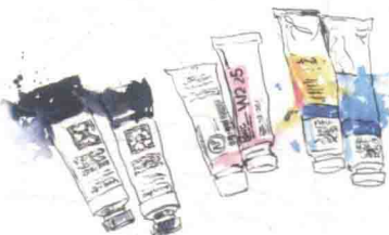
● Daniel Smith 大师级管装水彩、荷尔拜因大师级管装水彩、歌文管装水彩