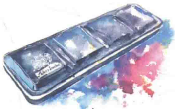
● 史明克学院级固体水彩