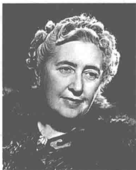
阿加莎·克里斯蒂 Agatha Christie (1890—1976)