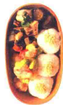
炸虾与炸蚕豆便当