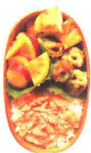
紫菜炸圆筒鱼糕便当 51