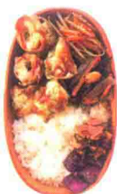
紫菜炸圆筒鱼糕便当 190