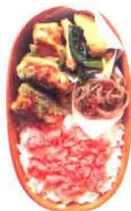
紫菜炸圆筒鱼糕便当 136