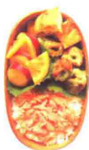
紫菜炸圆筒鱼糕便当 51