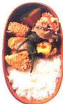
芝麻炸鸡胸肉便当 146