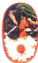
油炸黑芝麻沾鸡胸肉便当 196