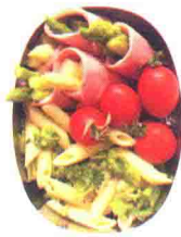
西蓝花通心粉便当 58