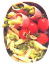
西兰花通心粉便当 58