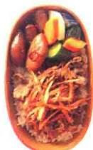
甜辣味煮牛肉便当 141