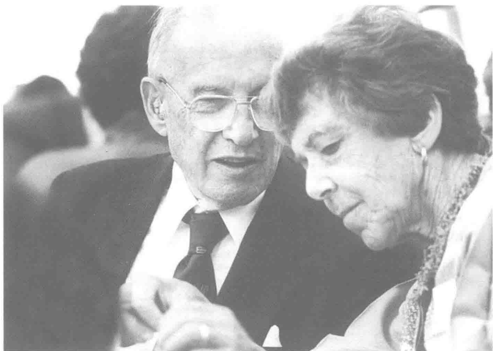
彼得·德鲁克和妻子多丽丝·德鲁克