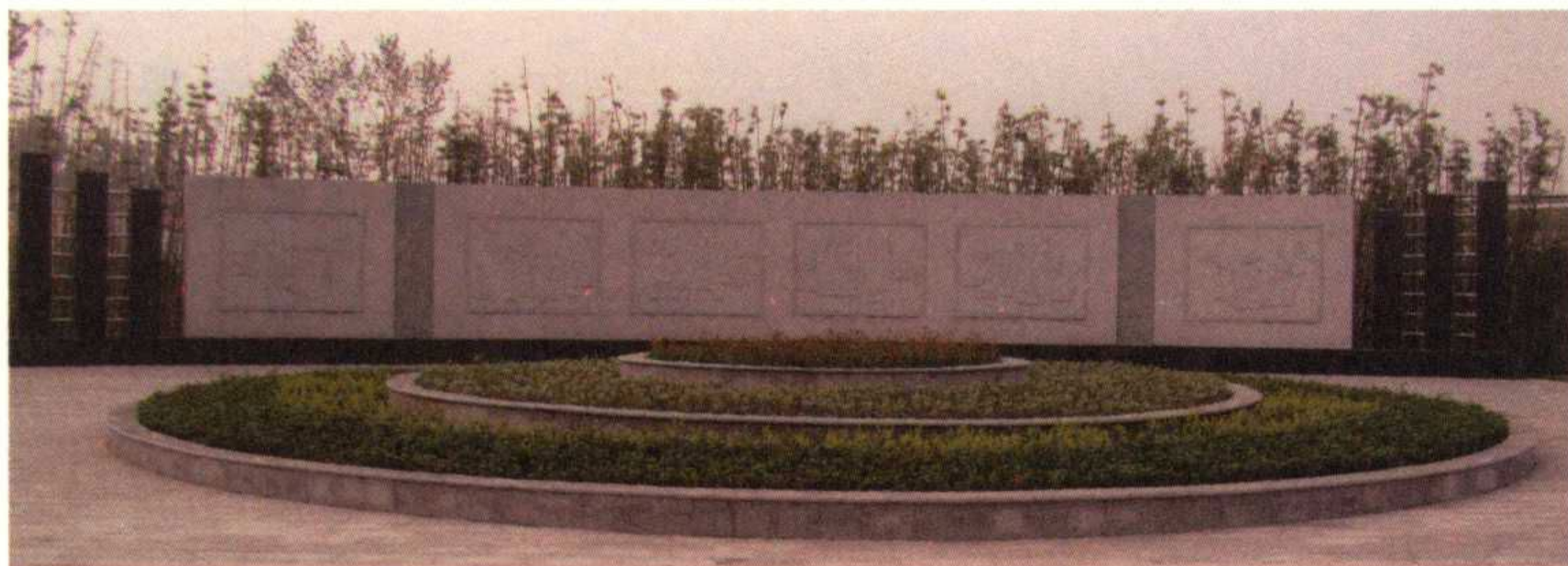
滕州市墨子文化广场墨子圣迹图