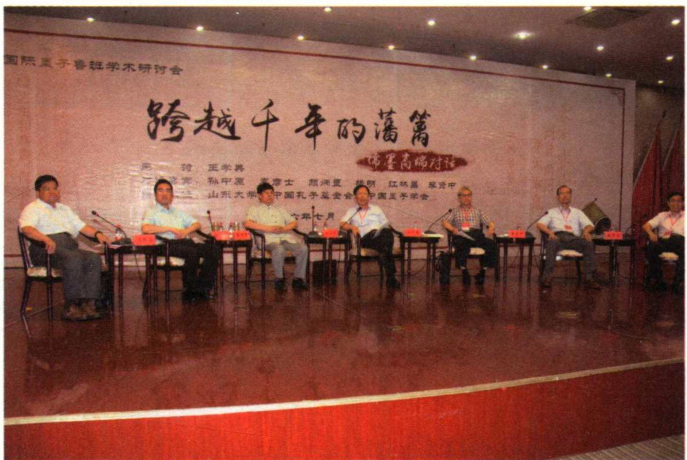
第十一届国际墨子鲁班学术研讨会“儒墨高端对话”