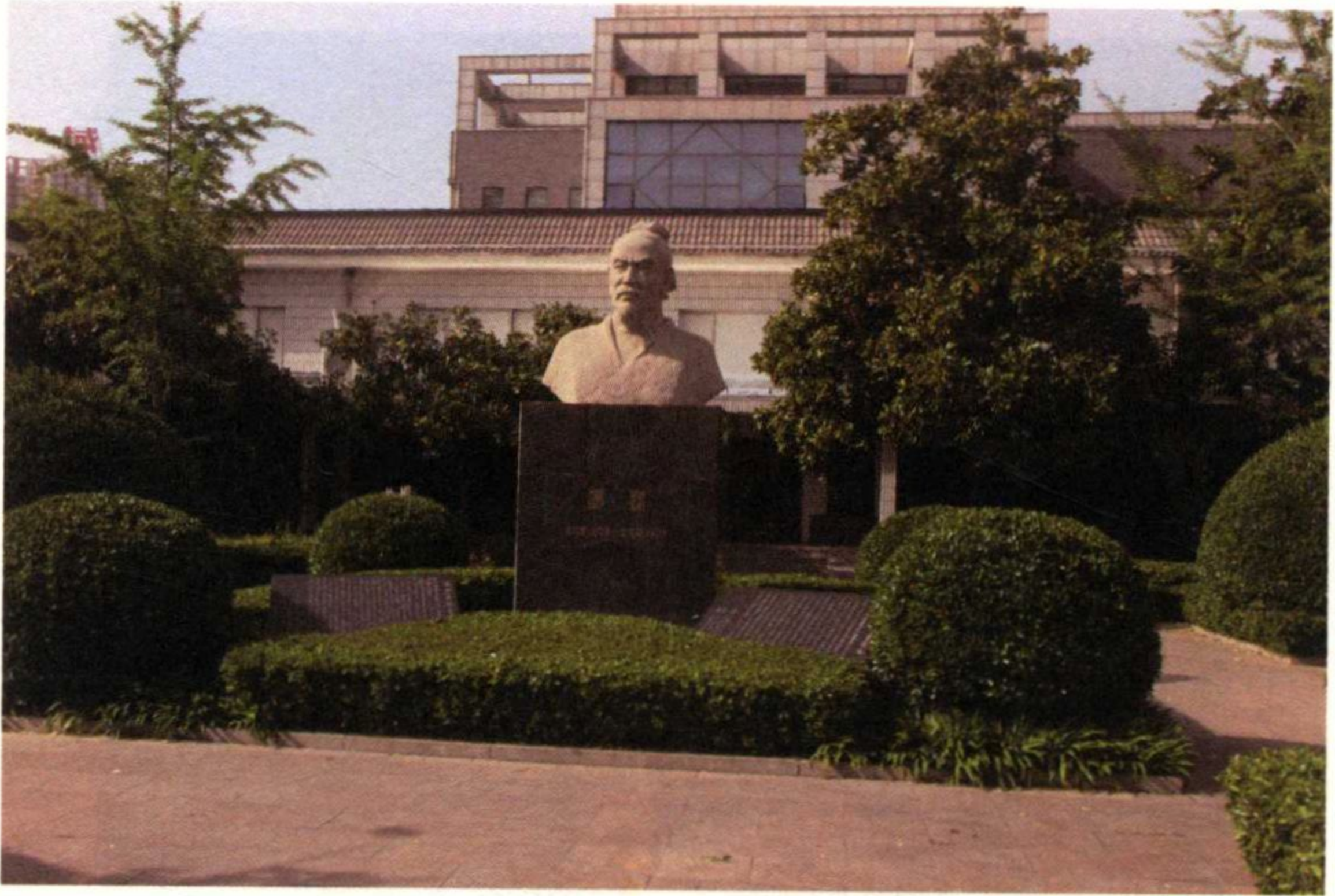
墨子纪念馆墨子半身像