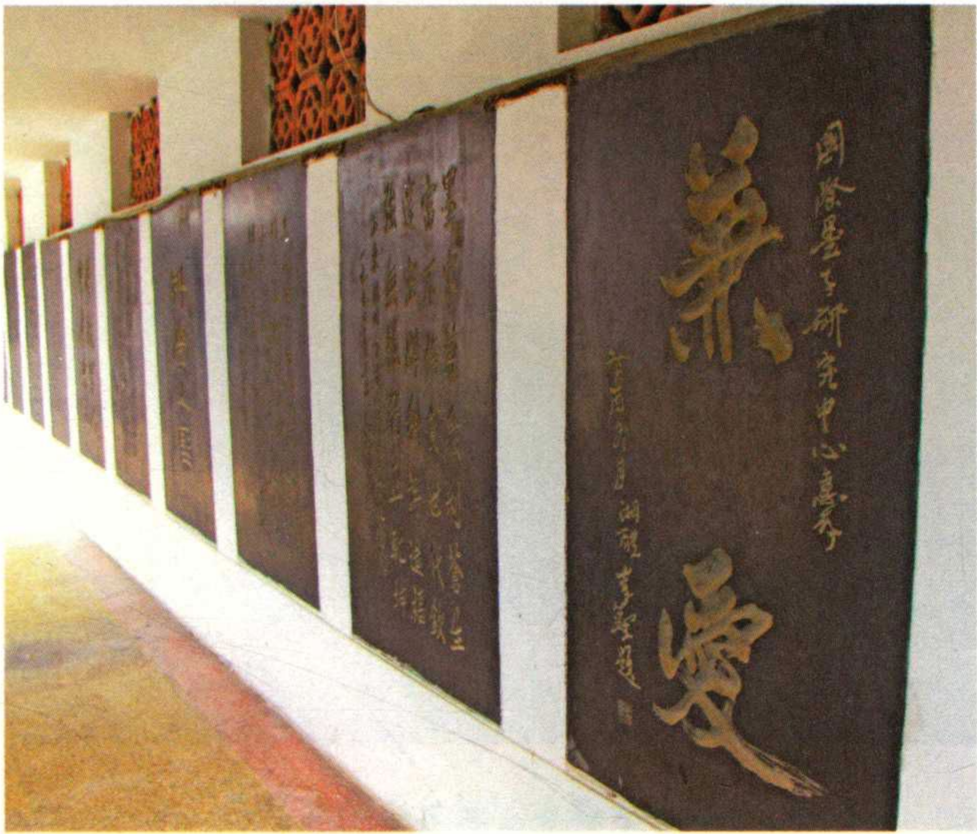
墨子纪念馆名人石刻碑廊