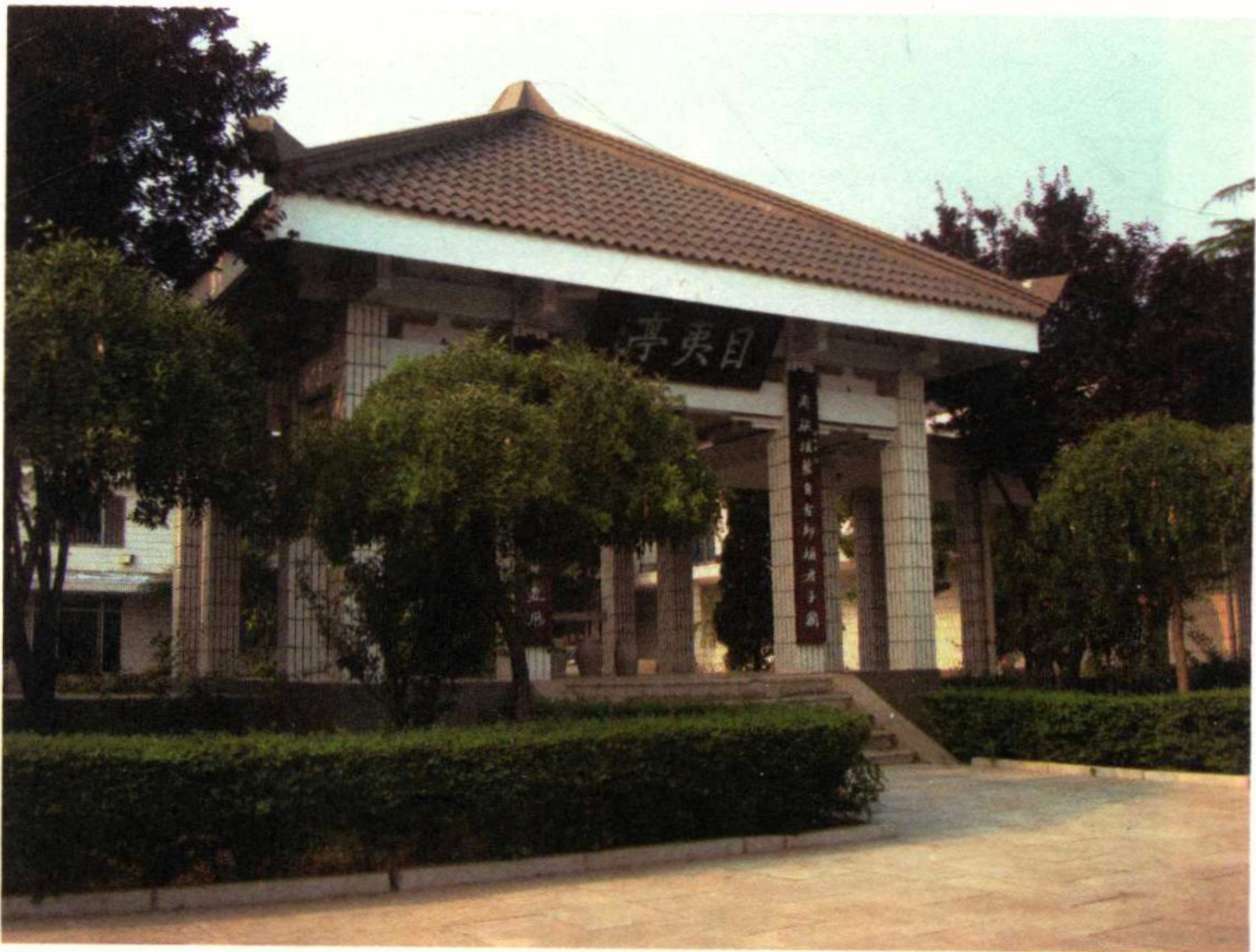
墨子纪念馆目夷亭