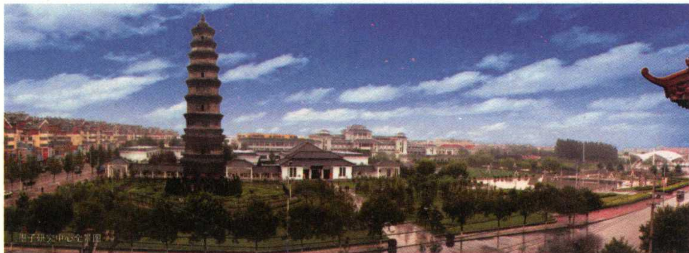
滕州市墨子研究中心全景图