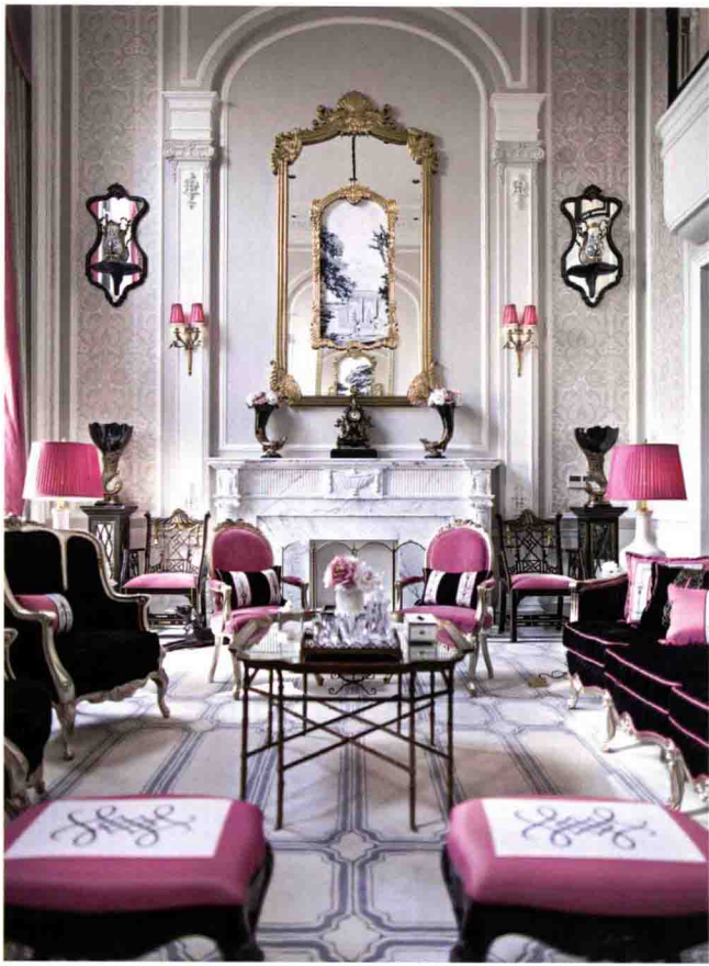
◇ 洛可可风格的空间经常出现如粉色等娇艳明快的色彩