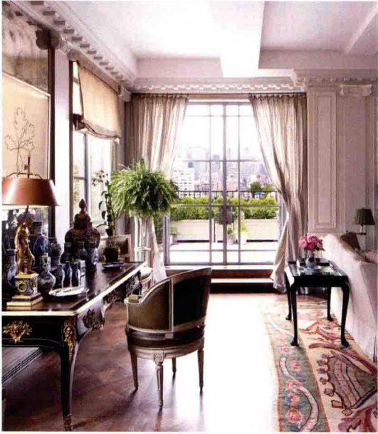
◇ 欧式古典家具上通常会搭配精致的雕刻细节