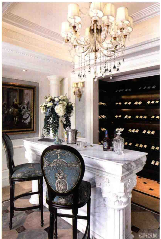
◇ 洛可可风格休闲区