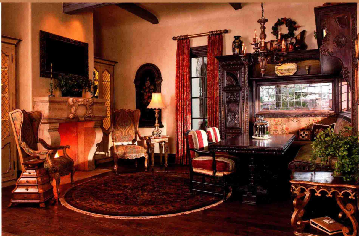
◇ 哥特式风格家居多采用流畅的线条、精致的雕刻表现出神秘的美感

哥特式风格的家居空间多采用流畅的线条、精致的雕刻等为主要的設計手法，呈现出一种无可比拟的神秘的美感。在花纹和色调上，哥特式风格崇尚浓郁阴暗的色彩、复杂华丽的软装装饰，如在布艺装饰上，喜欢运用彩色玻璃镶嵌，有着绚丽奇幻的观感。此外直升的线形、体量急速升腾的动势、奇突的空间推移，都带给人一种神秘感，显得璀璨而夺目，同时也增添了家居环境的艺术气质。