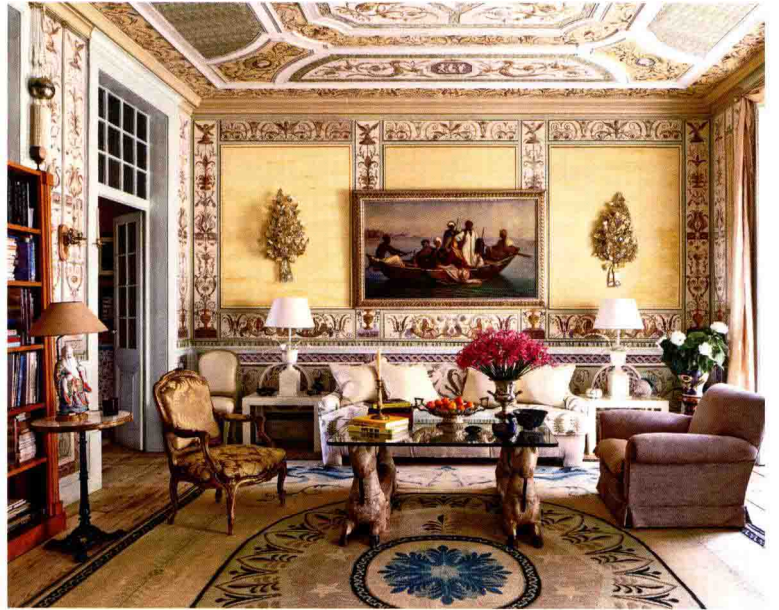
◇ 欧式风格空间通常以繁复的装饰细节表现出奢华典雅的氛围