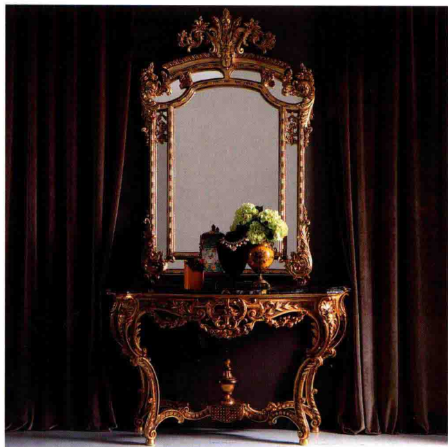
◇ 金色是巴洛克风格的常见色彩，通常给人以金碧辉煌的视觉感受