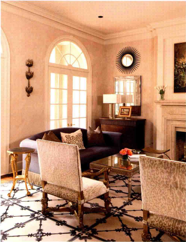
◇ 石膏雕花线、圆弧形门窗以及壁炉等都是欧式风格的主要特征