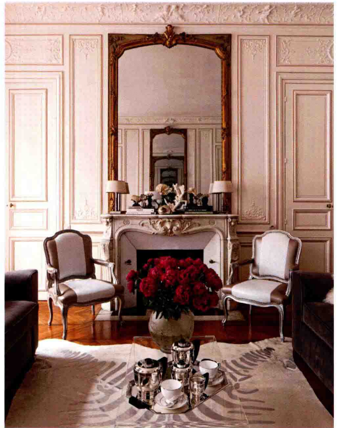
◇ 古典欧式风格的家居设计通常注重对称的空间美感