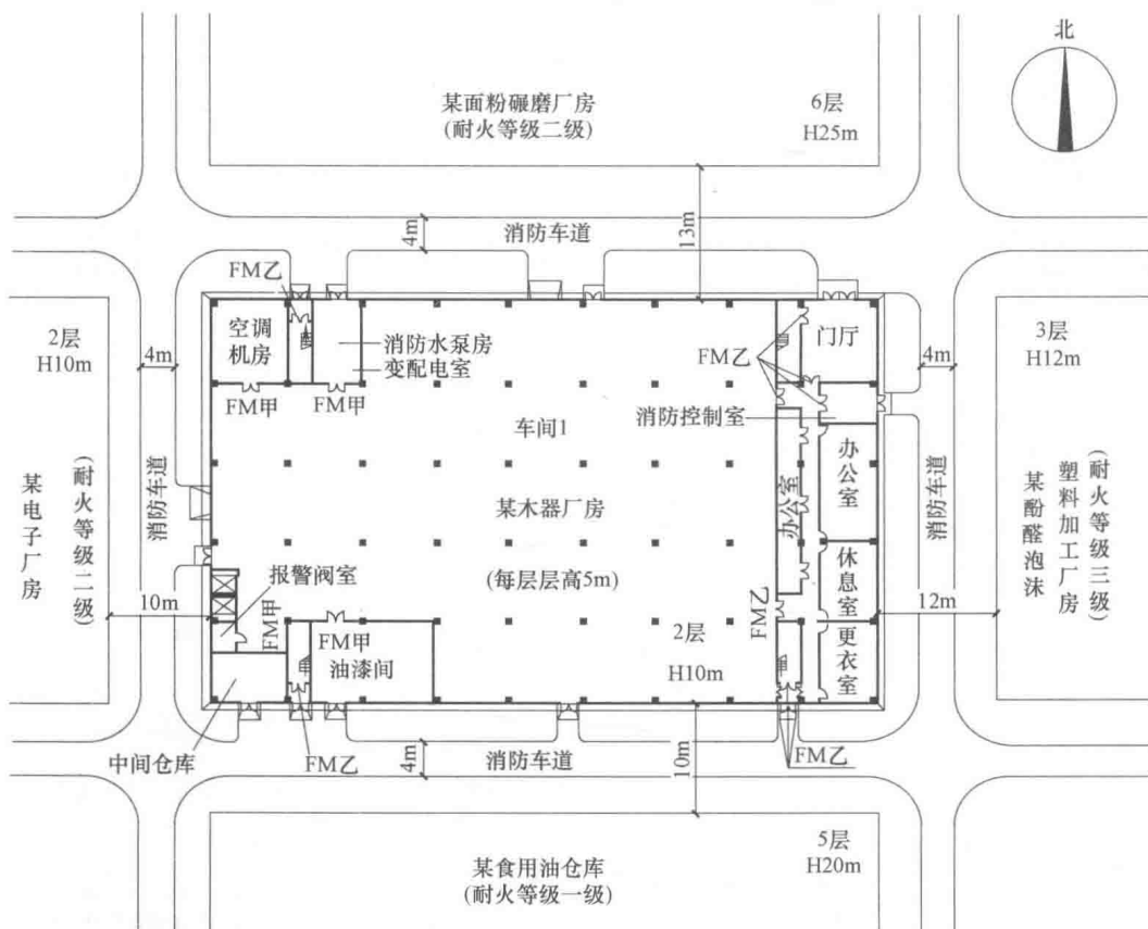
图 1.1-2 木器厂房总平面图

级，每层划分为一个防火分区，每层建筑面积均为 8000\text{m}^2 ，共设置四部不靠外墙且疏散楼梯净宽度均为 1.10\text{m} 的防烟楼梯间。该厂房总平面布局及周边厂房、仓库等的的相关信息如图 1.1-2 所示。该厂房内首层东侧设有建筑面积为 500\text{m}^2 的独立办公、休息区，采用耐火极限 2.50\text{h} 的防火隔墙、耐火极限 1.00\text{h} 的楼板和乙级防火门与其他部位分隔，且设有 1 个独立的安全出口；地上二层南侧设有一间靠外墙布置、建筑面积为 60\text{m}^2 的中间仓库，采用防火墙和耐火极限 1.50\text{h} 的不燃性楼板与其他部位分隔，储存主要成分均为甲苯和二甲苯的油漆和稀释剂；地上二层南侧设有一间靠外墙布置、建筑面积为 300\text{m}^2 的喷漆间，采用耐火极限 2.00\text{h} 的防火隔墙与其他部位分隔；中间仓库、喷漆间与其他部位之间均分别设置门斗，门斗的隔墙为耐火极限 2.00\text{h} 的防火隔墙，门斗两侧的门均采用甲级防火门；地上二层设有四个车间，车间之间通过净宽度均为 1.40\text{m} 的疏散走道分隔，疏散走道两侧均采用耐火极限 1.00\text{h} 的不燃烧体隔墙；除首层外门净宽度均为 1.20\text{m} 外，其他门的净宽度均为 0.90\text{m} ；厂房内任一点至最近安全出口的直线距离均不大于 60\text{m} 。该厂房按现行有关国家工程建设消防技术标准配置了室内外消火栓给水系统、自动喷水灭火系统等消防设施及器材。