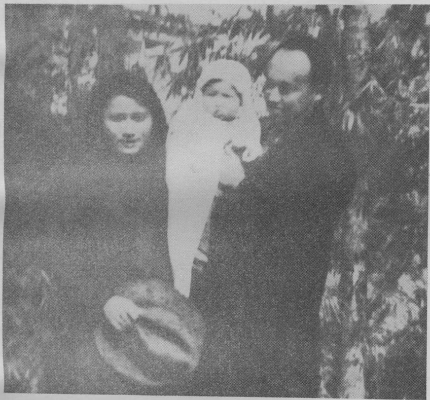
1935年10月与夫人摄于上海 (孩子周岁时)