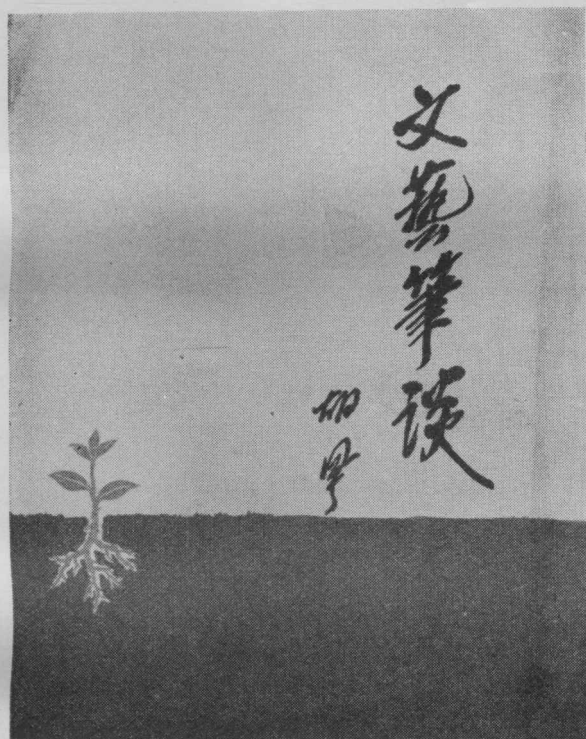
《文艺笔谈》一九五一年版封面