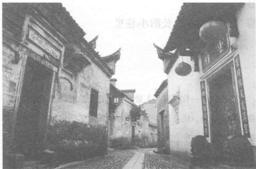
江西省赣州市灶儿巷

青石板铺成的巷道，两旁是白墙黛瓦的古典民居，一个宛如水墨画中的江南女子撑着油纸伞盈步轻挪，在细如发丝的绵绵雨中演绎着一个让人如痴如醉的梦。