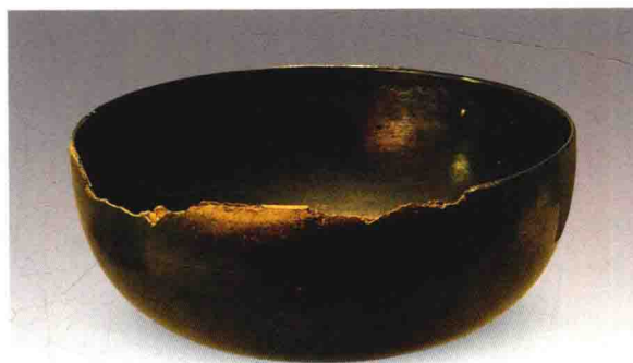
插图二 临安府符家黑漆盂 杭州老和山宋墓出土