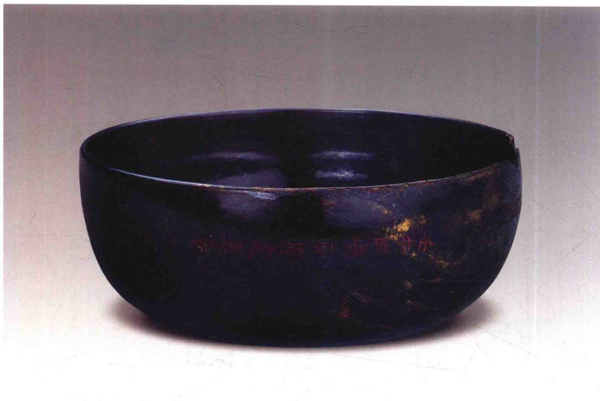
宋临安府符家黑漆盂