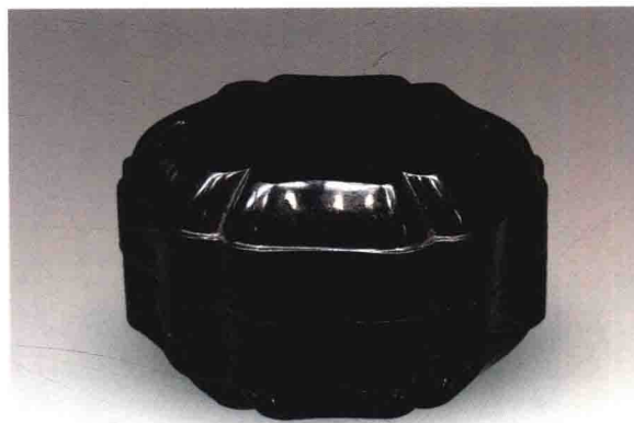
插图三 宋蜀葵式黑漆盒 江阴文林公社出土