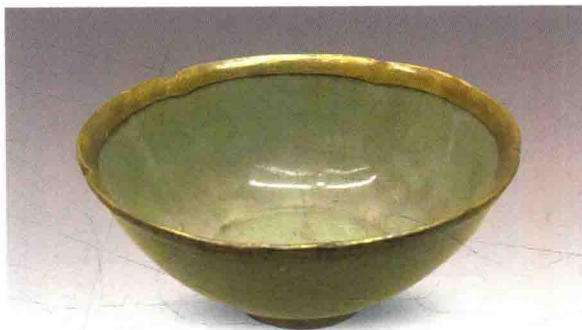
插图一 金釳青釉碗 陕西蓝田吕氏家族墓地出土

碟也是加铜釳的 [2] 。馆藏这一件高2.1厘米、口径7.2厘米，外底心有朱漆阳文篆书“碧天”二字方印。今或称它为盘，但以尺寸来说，称之为碟，当更为近实，当日通常是用作餐桌筵席上的果碟。馆藏“临安府符家”黑漆盂出土于杭州老和山宋墓，高7.2厘米、口径18.6厘米、底径12厘米，薄木胎，表里一色黑漆，外壁近口沿处朱书“壬午临安府符家真实上牢”十一字。此壬午，是南宋绍兴三十二年。同墓出土款识相同、造型相同之器大小三件 [3] （插图二），馆藏为尺寸最大者。平底无足，似以称作盂为宜。慧琳《一切经音义》卷一百“铜盂”条：“《方言》：无足碗谓之盂。”又卷八十九“盂盛酪”条：“《方言》：盂谓之盂。碗之大而无足者是。”南宋刻本《碎金·家生篇》中的“漆器”一项中列有“钵盂”，应即此类。蜀葵式黑漆盒高7.7厘米、直径14.1厘米，也是常见的造型，如江苏江阴文林公社出土的一件 [4] （插图三）。它多用为妆盒。这几件素色漆器都可以算作日常用器，匀称平正，漆色光亮，牢固耐久，应是消费者对产品的基本要求，器铭所谓“真实上牢”，是广告语言，也是行业标准。（扬之水）