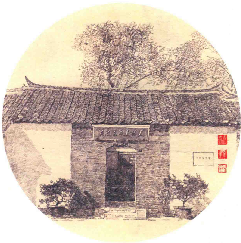
江苏淮安周恩来故居