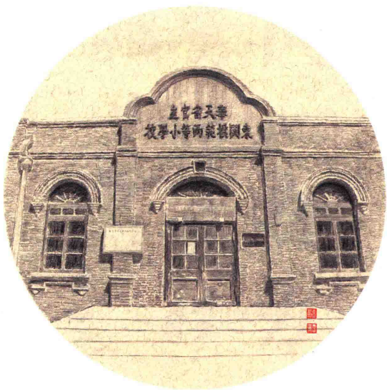
沈阳东关模范学校旧址