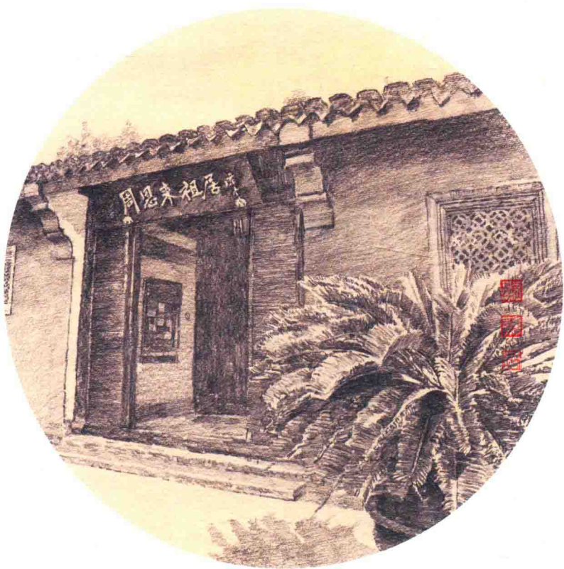
浙江绍兴周恩来祖居