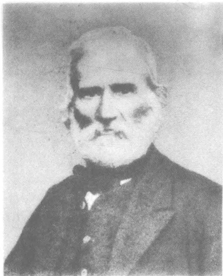
布 朗 基