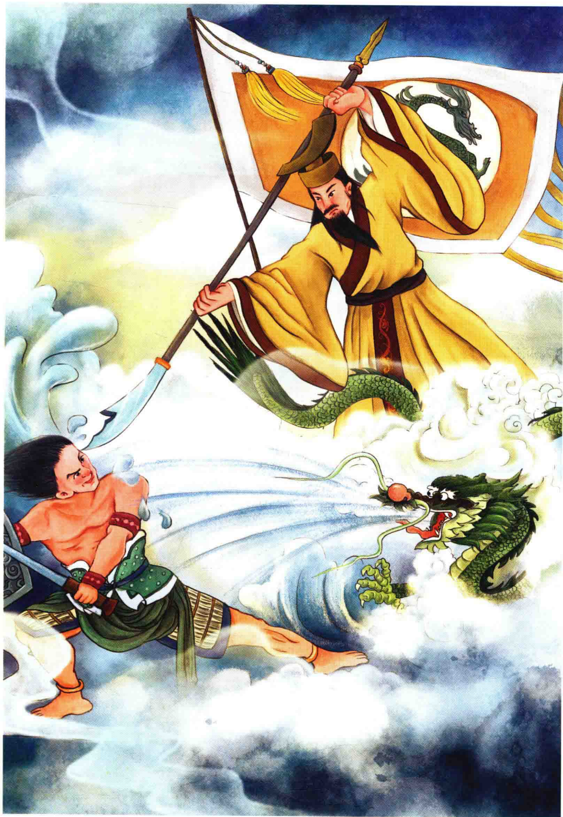
为天下苍生而战的黄帝，在九天玄女、应龙等神仙的帮助下，运用智慧战胜了蚩尤