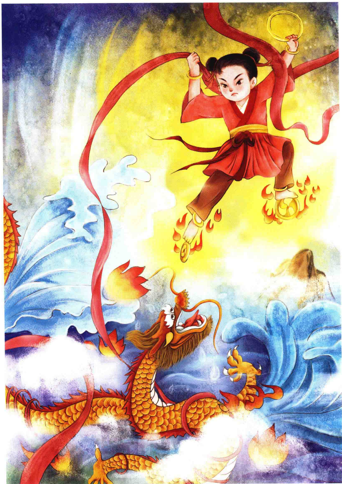
东海龙王的三太子蛮不讲理，不分青红皂白就对哪吒使用武力，反而受到了哪吒的惩罚