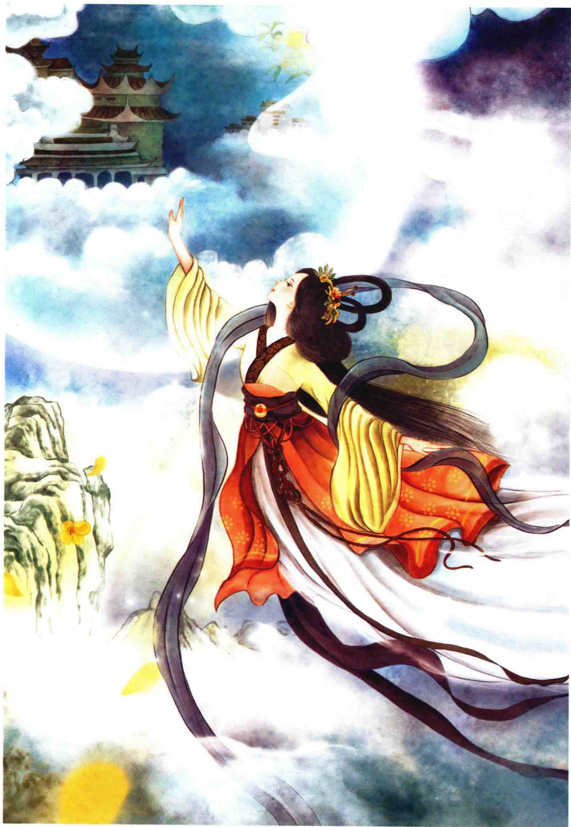
嫦娥为了不让长生药落入坏蛋逢蒙之手，只好自己吞下，飞升成仙，直奔月亮而去