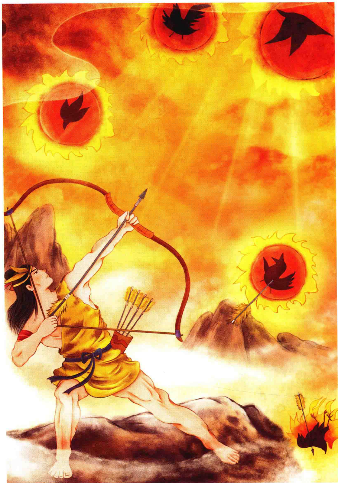
十个太阳不听劝告，不顾苍生，后羿射下九个太阳，只留下一个普照世间万物