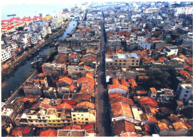
北海市区老城街区局部

“北海”这个地名始于何时待考，但可以肯定的是，北海市现在的老城区尚未形成之前已有“北海”一名。最初“北海”是一个村名，沿用至今。“北海村”在海城区海角中路，与被称为北海第一街的市区最古老街道“沙脊街”西端相邻，是一个疍家渔民集中居住的村落，因村子北面濒临大海而得名。清康熙元年（公元1662年），清政府在北海设“北海镇标”，用“北海”这个地名。这是官方文书正式有“北海”之名。清乾隆年间（公元1736—1795年），福建、广东等地渔民纷纷到北海半岛谋生，他们经常集中在现在的沙脊街这个地方交易，并逐步形成商业街。到了