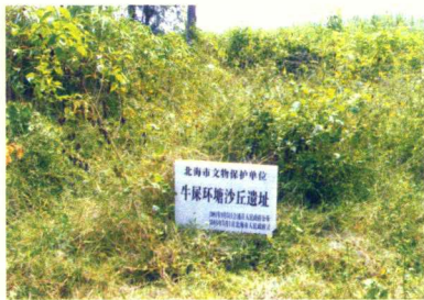
牛屎环塘沙丘遗址