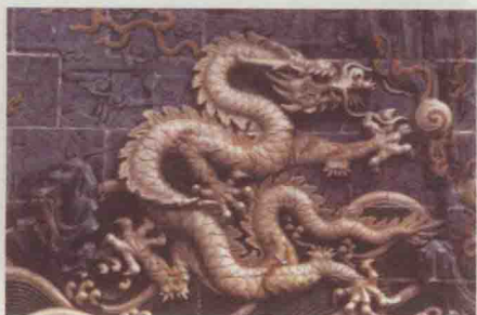
图4 九龙壁九龙之一（清）