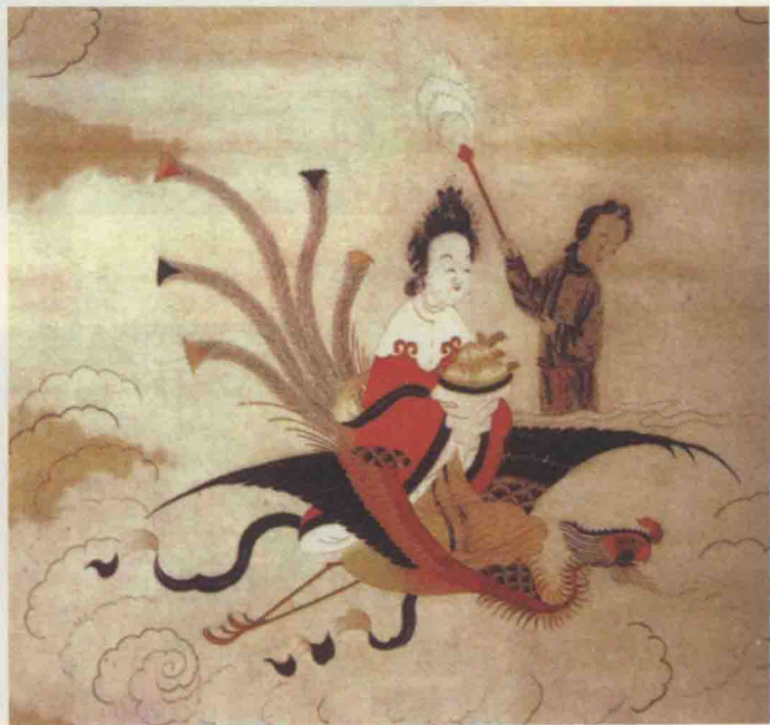
图11 上八仙庆寿图(局部·明)