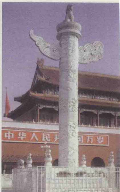
图2 天安门前华表之龙雕