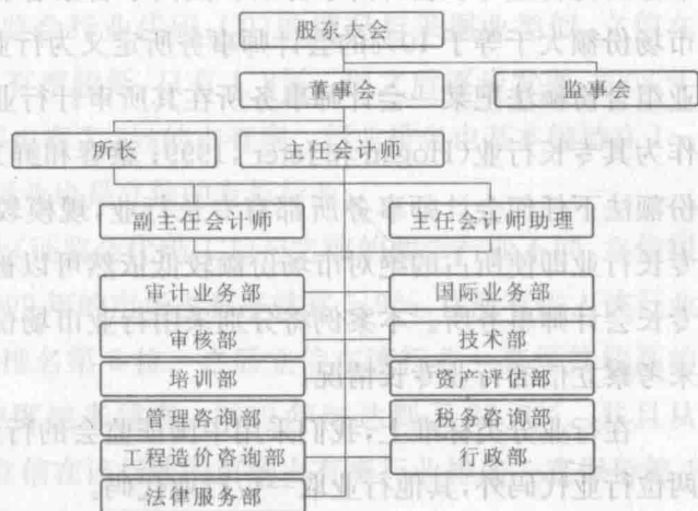
图 1-3 立信会计师事务所机构设置