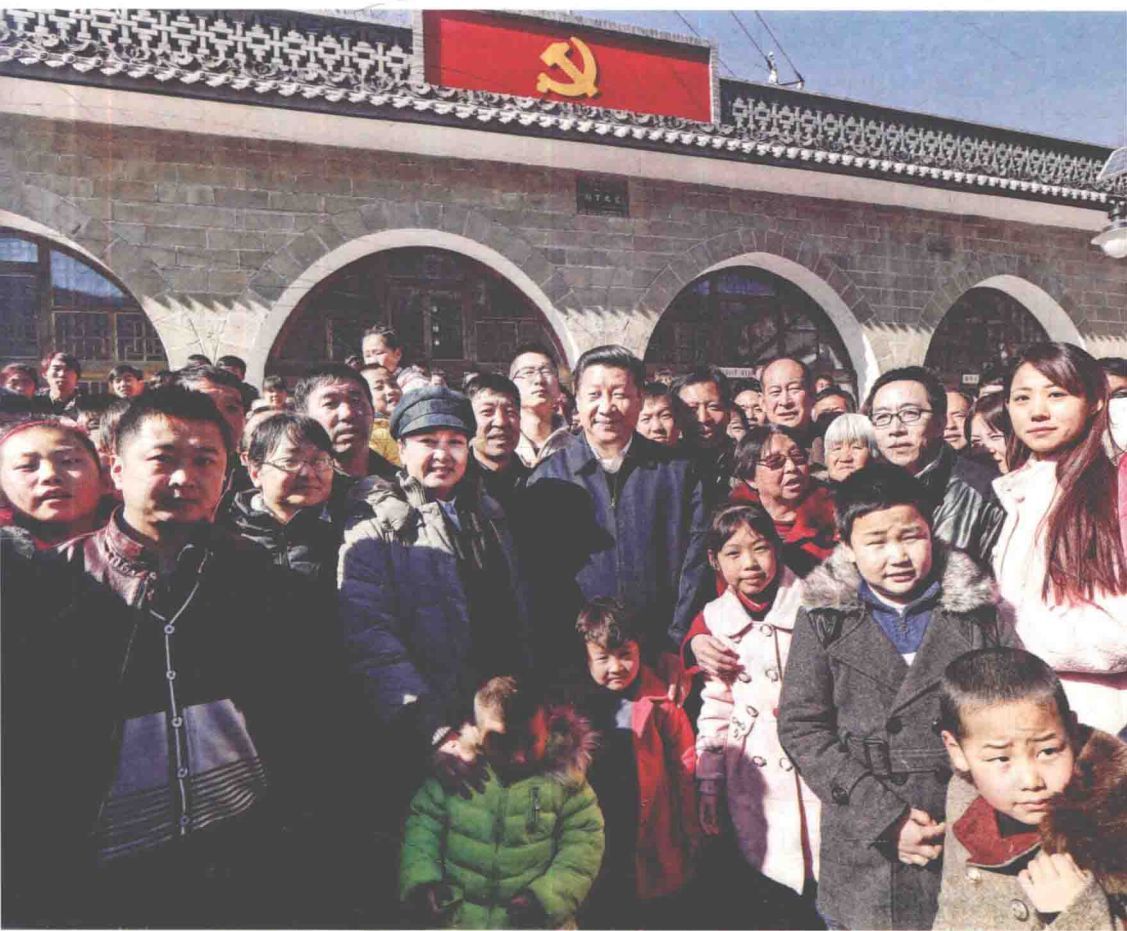
2015年2月13日，习近平总书记与梁家河的乡亲们在一起