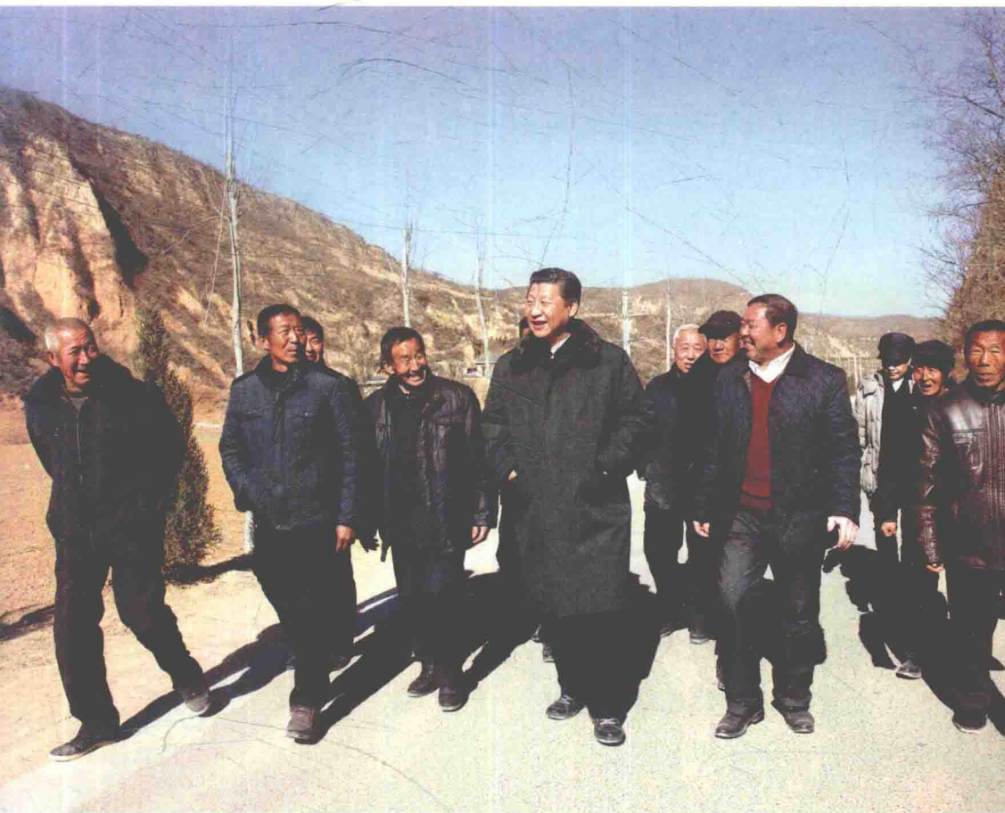
2015年2月13日，习近平总书记回到梁家河