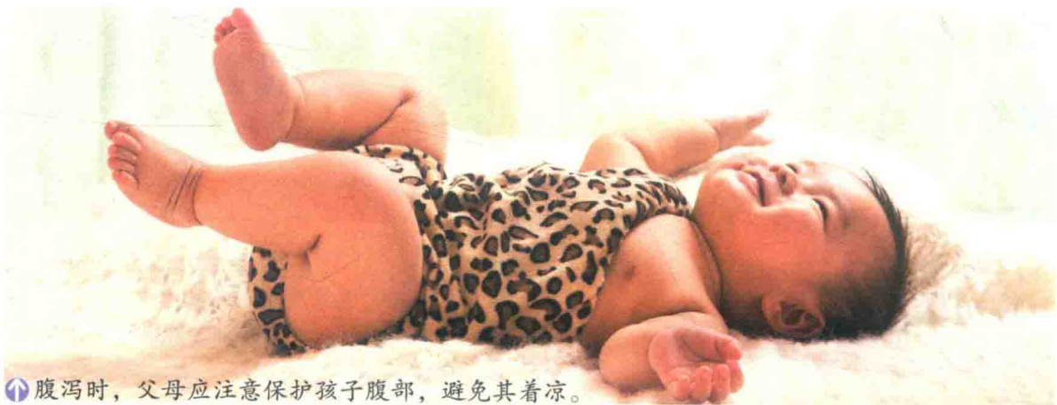
⬆️ 腹泻时，父母应注意保护孩子腹部，避免其着凉。

如果孩子的大便有脓血，并伴有食量减少、呕吐、尿少等症状；或大便呈稀水样，每天达10~20次，伴有高烧、嗜睡，甚至出现手足凉、皮肤发花、呼吸深长、口唇呈樱红色、口鼻周围发绀、唇干、眼窝凹陷等情况，父母应立即带孩子到医院诊治抢救。