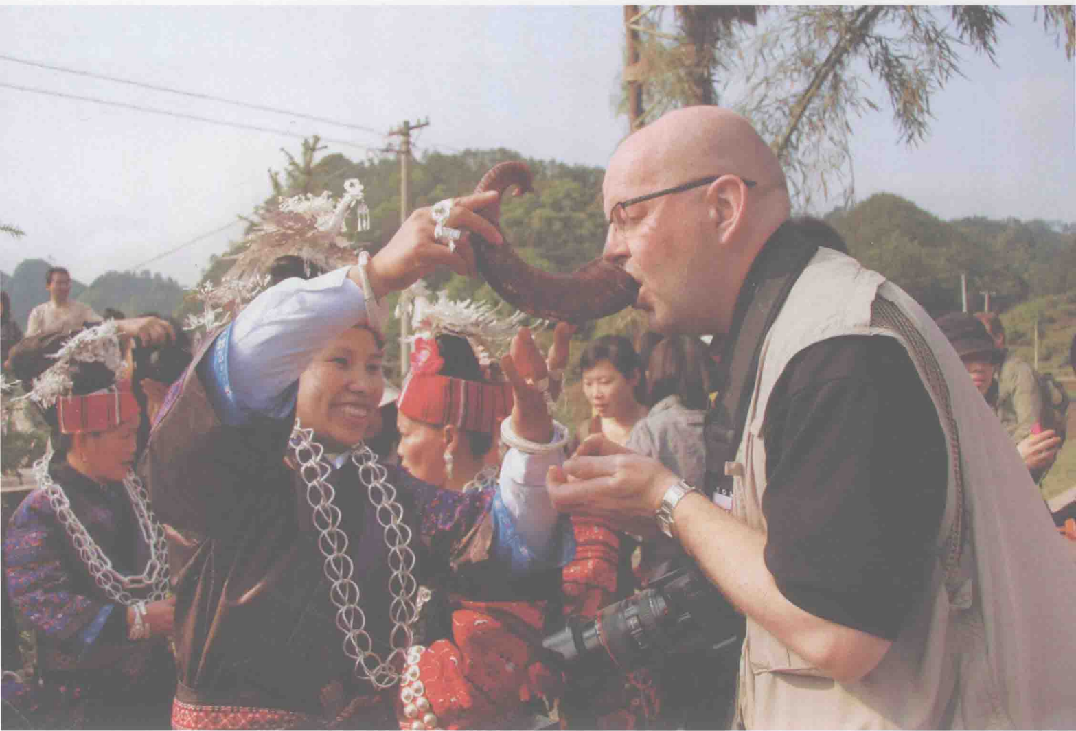
苗寨迎远客