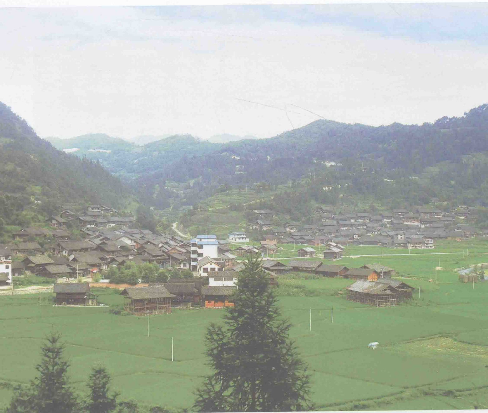
台拱镇南省村全图