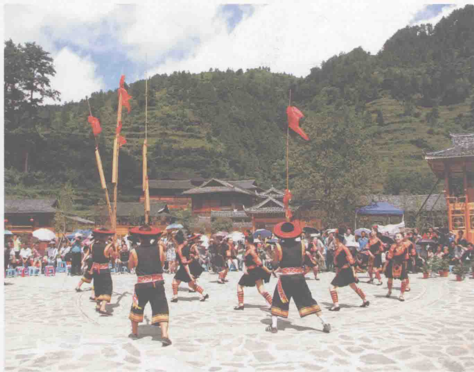
世界著名文化旅游县

2008年10月,中国工艺美术行业特色区域荣誉称号评估小组对台江申报“中国刺绣之乡”民族刺绣工艺进行考察。认为台江至今还传承着良好的刺绣工艺,绣法多种多样,是一笔丰富的世界文化遗产,也是世界刺绣艺术中的一朵奇葩。中国工艺美术协会刺绣专业委员会主任虞美华总结说:“台江苗族刺绣,绣法多种多样,工艺炉火纯青,图案精致美观,内容丰富多彩,集人类学、民族学、民俗学、人种学、历史学、社会学、文学、美学、工艺美术等学科领域于一身,与中国‘四大名绣’媲美毫不逊色。”经评估组考核评估,决定授予台江县“中国刺绣之乡”称号。