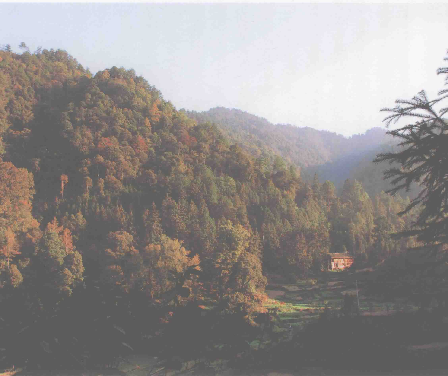
中国绿色名县