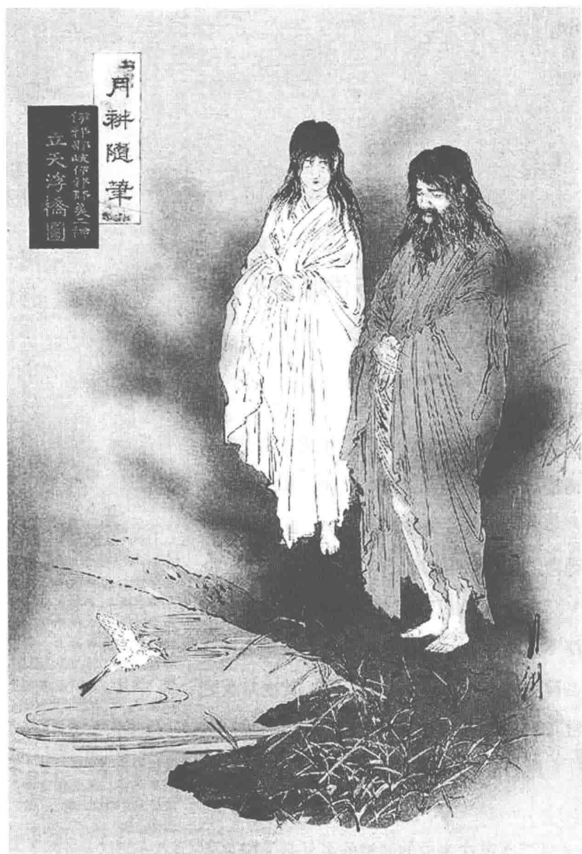
尾形月耕：月耕隨筆 / 伊邪那岐伊邪那美