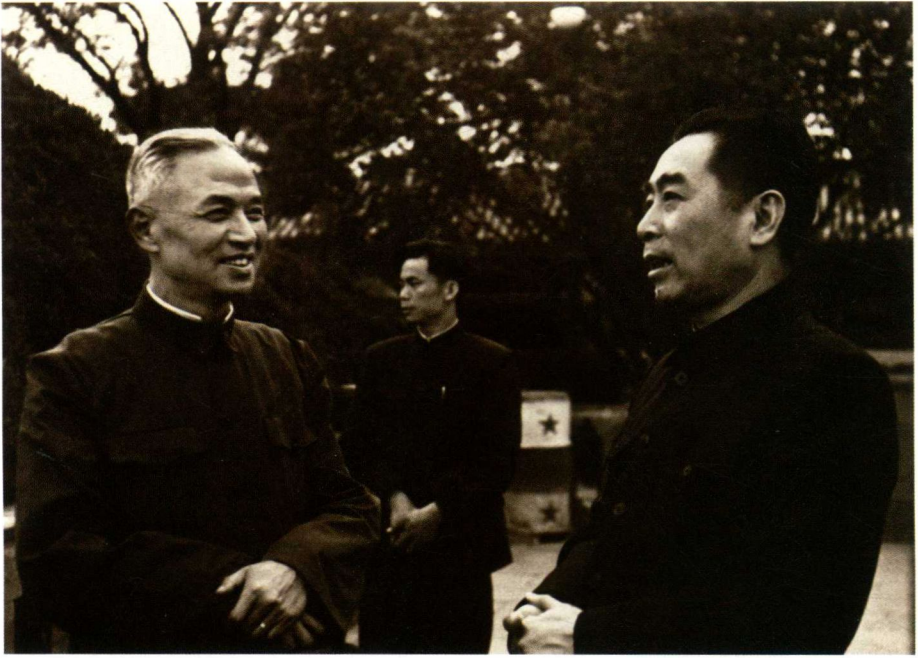
1952年，周恩来和著名科学家李四光在一起。