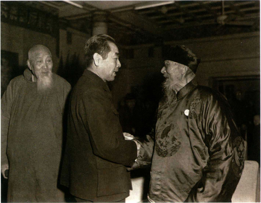
1953年1月7日，中华全国美术工作者协会和中央美术学院联合举行宴会，为齐白石93岁生日祝寿。周恩来出席祝贺。