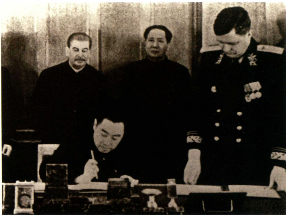
1950年2月14日，周恩来作为中华人民共和国中央人民政府全权代表在莫斯科签订了《中苏友好同盟互助条约》。