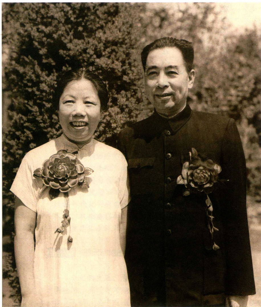
周恩来、邓颖超结婚 25 周年纪念照。