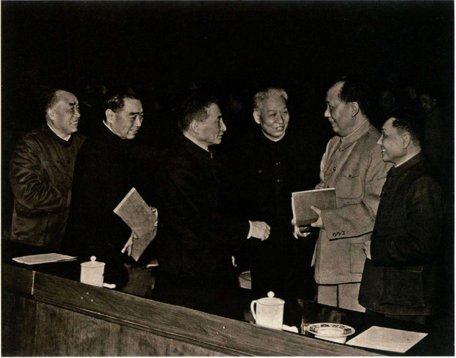
1962年2月，毛泽东、刘少奇、周恩来、朱德、陈云、邓小平在中共中央工作会议（七千人大会）上。