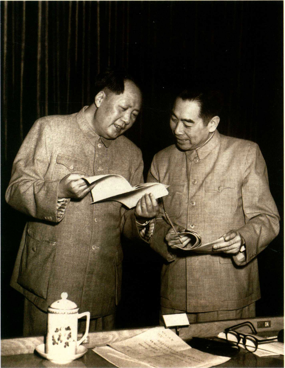
1953年，周恩来与毛泽东在中央人民政府委员会会议上。