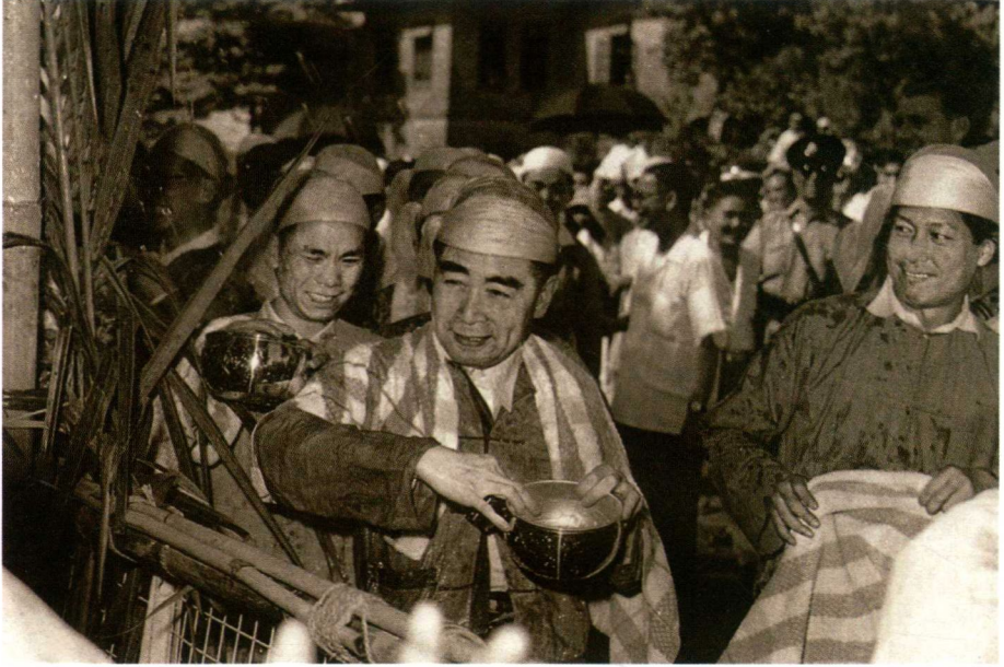
1960年4月，周恩来访问缅甸时，身着缅甸民族服装，手持银碗，同缅甸人民欢庆泼水节。