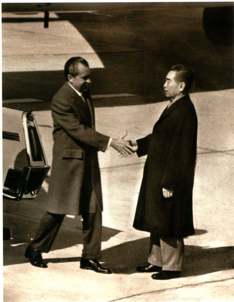
1972年2月21日，美国总统理查德·尼克松到达北京。这是美国总统第一次访问中国。图为周恩来和尼克松在机场握手。