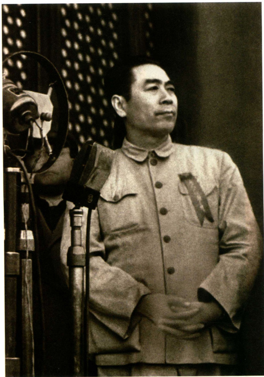
1949年10月1日，周恩来在天安门城楼上参加中华人民共和国成立盛典。