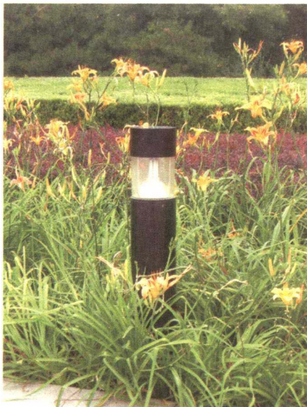
图 1-4-9 景观照明灯具