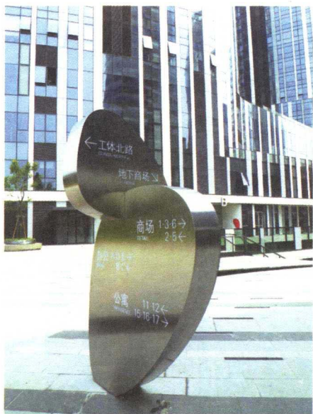
图 1-4-8 SOHO 现代城导向牌