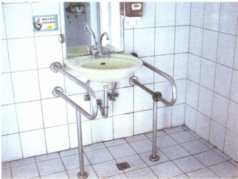
图 1-4-6 无障碍洗脸盆的人性化设计

城市公共设施对于城市景观的构筑是必不可少的。它以一定的造型、色彩、质感与比例关系,运用象征、秩序、夸张等