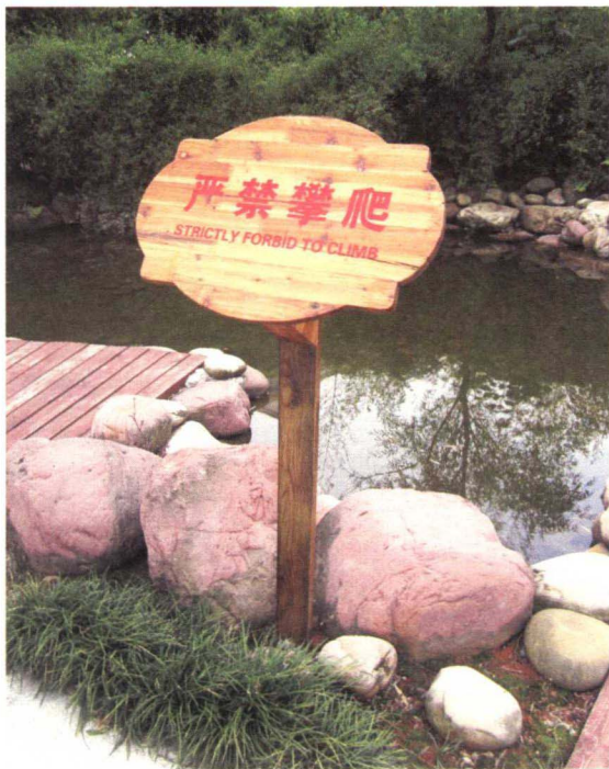
图 1-4-3 公园警示标语牌

公共空间是一个敏感空间,它的设计与管理应服务于使用者的需求:设计时既考虑人衣食住行的自然属性,也考虑人交往沟通、自我实现的社会属性,以全方位满足人的需求作为公共空间设计的原则。公共设施是城市景观中不可缺少的重要元素,它具有公共空间的属性,不仅提供人们社会生活的场所,而且能够以其特有的方式促进社会行为的发生,公共设施为城市带来了无限魅力。公共设施虽属于家具范畴,但由于其公共属性,呈现出不同于室内家具的特点。设计师进行设计时,不仅要反映城市文化、历史、艺术与生活品位,关注人在公共空间社会交往、交流信息、沟通情感、自我实现的社会属性,还要考虑家具如何与环境协调统一以及室外材料与使用维护的因素(如图1-4-3、图1-4-4)。