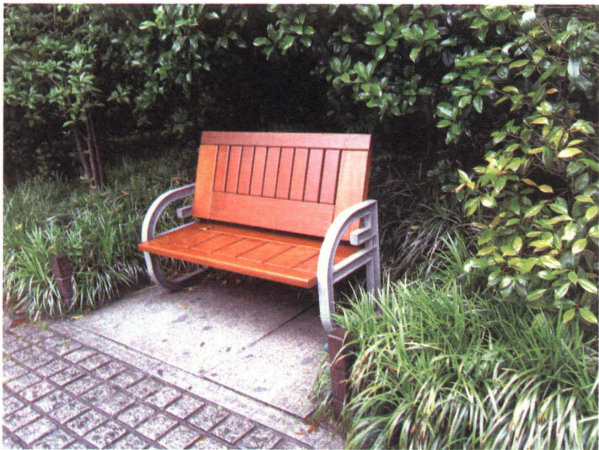
图 1-4-2 半封闭的休息空间