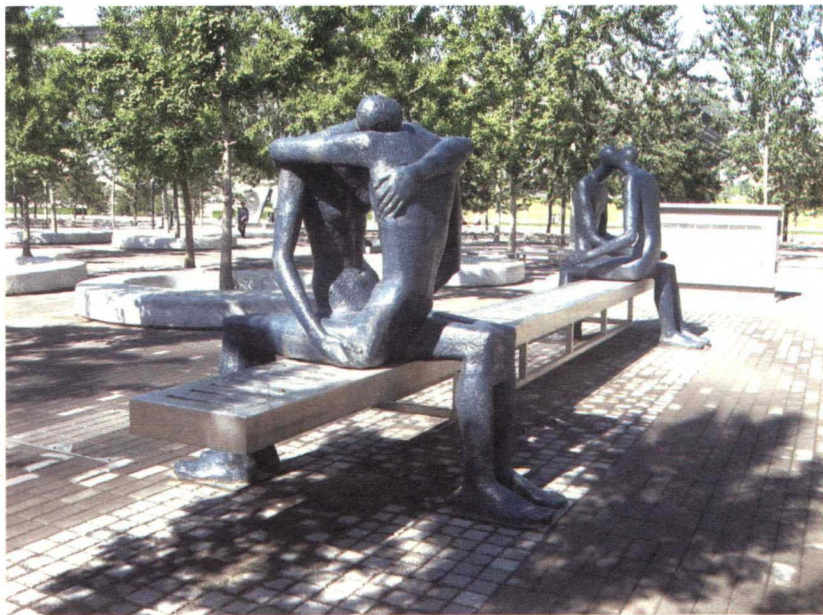
图 1-2-2 与雕塑相结合的长椅