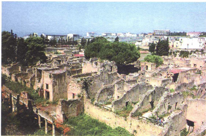
图 1-1-2 庞贝城遗址