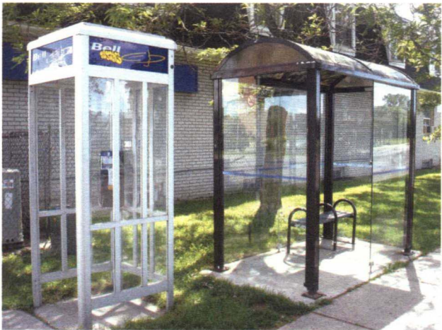
图 1-3-6 电话亭和候车亭

灯、霓虹灯饰等。公共照明设施除了需要一定的照度要求外，还要能够渲染环境气氛。公共照明设施以泛光照明和投光照明为主，泛光照明为整体照明形式，投光照明为局部照明形式。城市空间环境的照明灯具是用来固定和保护光源，并调整光线的投射方向。设计中要考虑灯具造型的同时还应考虑防触电性能、防水防尘性能、光学性能等。城市空间环境的照明灯具主要有两种类型：装饰性和功能性。装饰性的灯具在造型上要与景观风格相协调，以利于白天的观赏；功能性的灯具注重照明的视觉效果，通常隐藏在人们视线以外，这里主要指照射各种景观元素的投光灯和埋地灯（如图 1-3-5）。