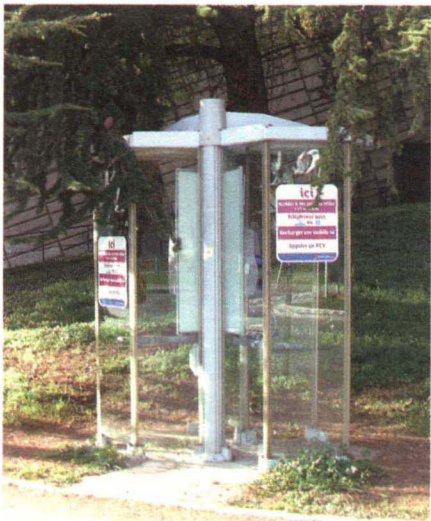
图 1-4-1 半封闭电话亭

公共设施处于开放性的、与环境交流密切的城市公共场所之中,因而它首先具有与公众产生亲和而积极对话的品性。也正是由于公共设施所具有的公共性,决定了公共设施的内容、形式是为大众服务的,与人们的生活关系密切并具有一定的互动关系。公共设施的本质是亲民的,为大众而作,谋求的是公众之利,从物质上和精神上都是以人(公众)为本,以人(公众)为核心,以人(公众)为归宿。总之,公共设施属于大众文化,它应该体现公共精神,适应大众审美需求,为大众体验而创作。基于此,便不难看出亲和互动、公众参与正是公共设施系统设计成败的关键之一。