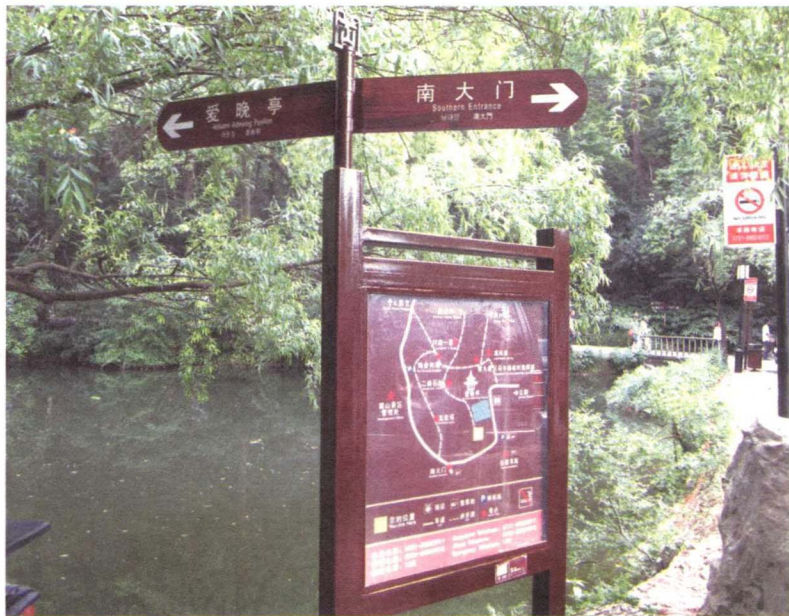
图 1-3-1 旅游区的导示牌