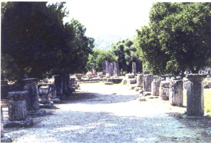
图 1-1-1 古奥林匹克竞技场

从 18 世纪开始，随着法国革命进程的加快，城市越来越成为人们的领地，在街道上人们不停地走动时，个人和公众的生活开始融合成一体。街道就开始成为人们日常生活的一个剧场。随着街道形态的变化，人们日益需要更宽敞的街道和其他空间，于是林荫大道逐渐取缔那些模糊、不明显的小巷。与此同时政府开始在街道两旁种植