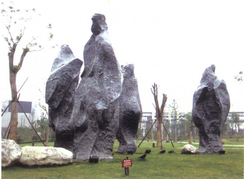
图 1-4-7 城市广场群雕的艺术魅力