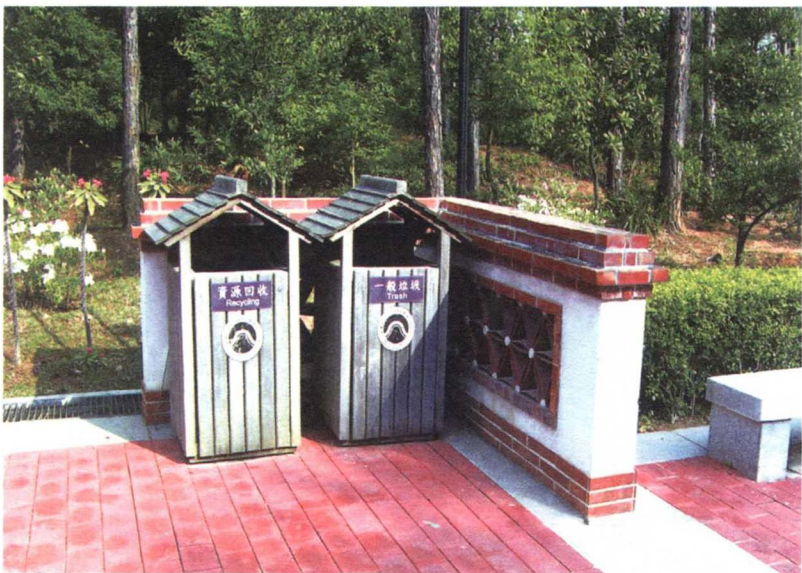
图 1-3-3 公共卫生设施的垃圾箱设计

公共照明设施是保证人们夜间活动安全、防止事故与犯罪发生并美化城市夜景的重要设施。主要包括路灯、景观灯、地