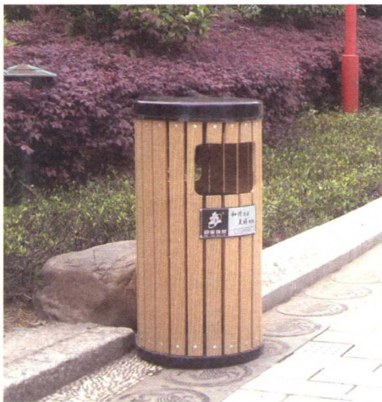
图 1-4-4 公共垃圾桶