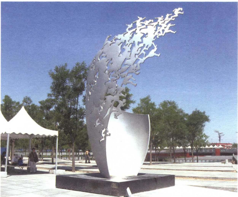
图 1-3-4 公共景观雕塑