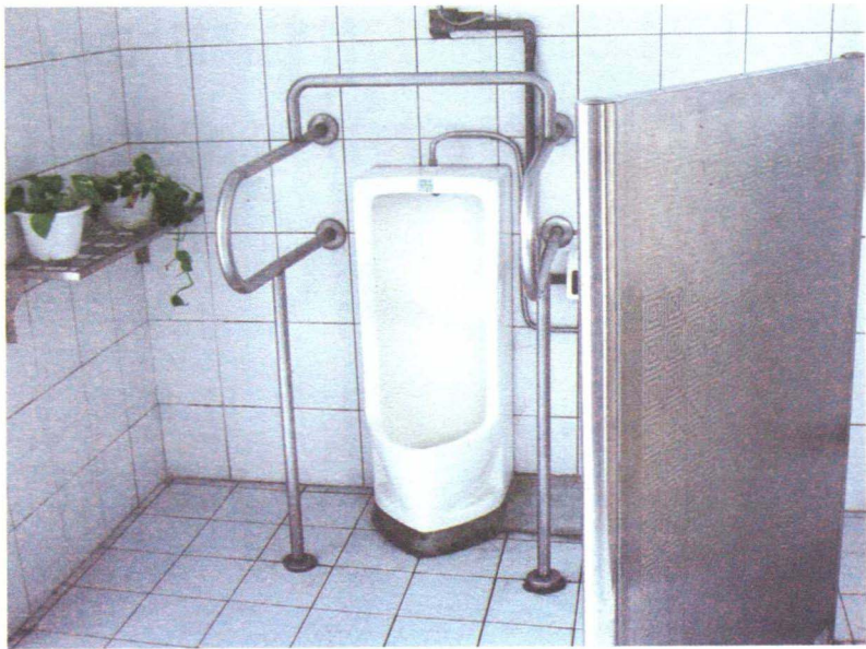
图1-4-5 无障碍小便池的人性化设计

因此公共设施系统设计应该从研究人的需求开始。城市中的公共设施以其服务人们的工作、生活和供人们欣赏的双重功能,方便着人们和美化着城市。人是城市环境的主体,因而设计应以人为本。有人性化的公共设施的设计应该充分考虑使用人群的需要。在使用人群中老人、儿童、青年、残疾人有着不同的行为方式与心理