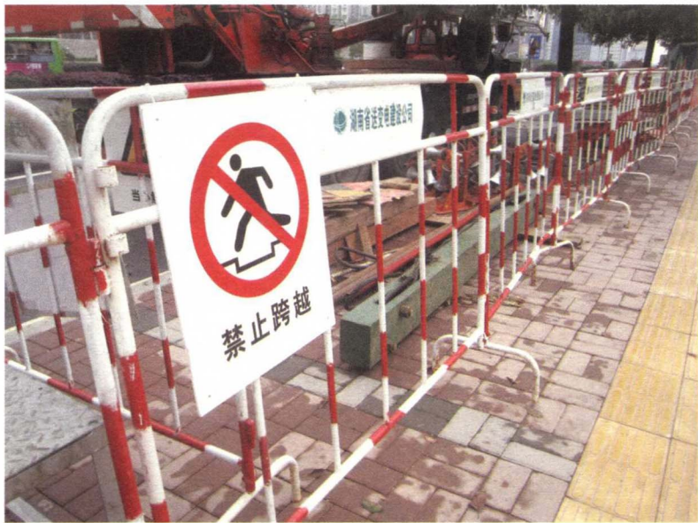
图 1-3-2 公共交通设施的拦阻设施