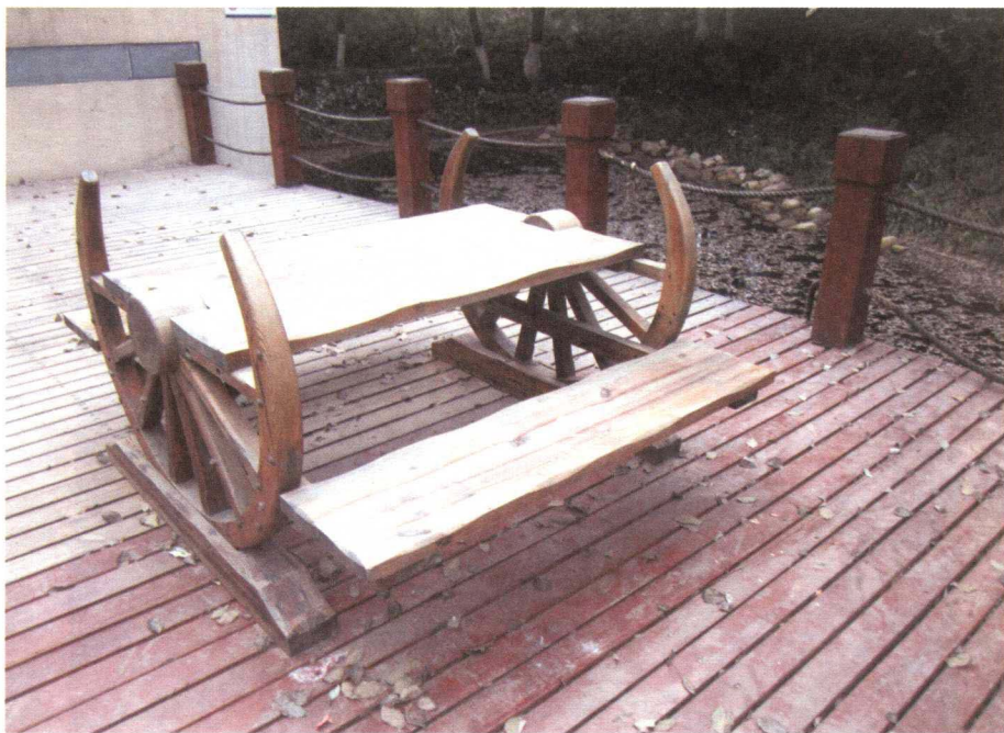
图 1-4-10 仿古造型的公共座椅

特有的手法作用于人们的心理，给予人们视觉上的快感。在对城市公共设施的设计中，应隐喻时代的精神与观念，传达当地的历史文化与民俗风情，与其他实体一起组成城市的形象，反映城市特有的风貌与色彩，表现城市的气质与风格，同时体现出城市居民的精神文化素养。由于城市公共设施的公众性，强调大家的共同分享，使人有欣赏艺术、亲近艺术，甚至接触艺术的机会（如图 1-4-8、图 1-4-9）。