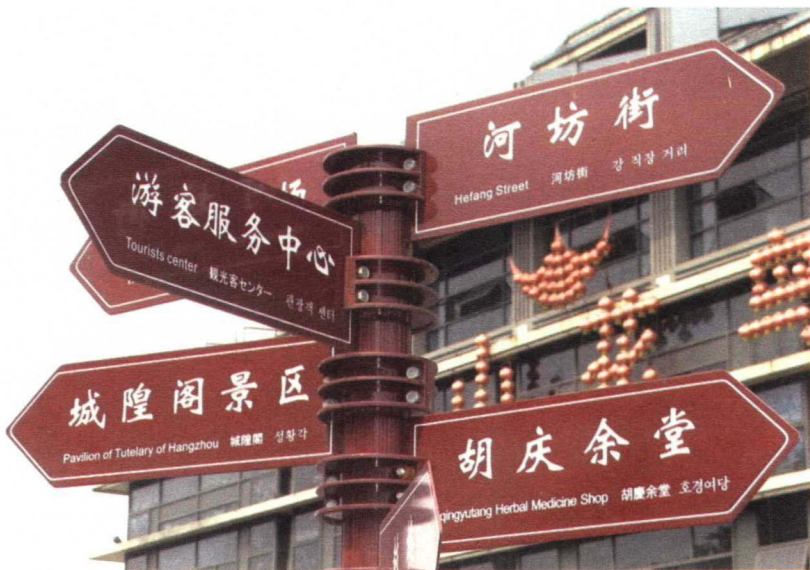
图 1-2-1 多种语言景区指示牌

城市公共设施是随着人类文明的诞生和城市的发展而出现的,它是连接人与自然的媒介,对人与城市环境的关系起着不可忽视的协调作用。目前,各个国家的学者对公共设施所界定的含义差别很大。克莱尔认为:“公共设施就是指城市内开放的用于室外活动的、人们可以感知的设施,它具有几何特征和美学质量,包括公共的、半公共的供内部使用的设施”。我国的一些学者认为:“公共设施包括公共绿地、广场、道路和休憩空间的设施等等”。综合分析以上概念我们可以认为公共设施主要是指面向社会大众开放的交通、文化、娱乐、商业、广场、体育、文化古迹、行政办公等公共场所的设施和设备等(如图1-2-1、图1-2-2)。