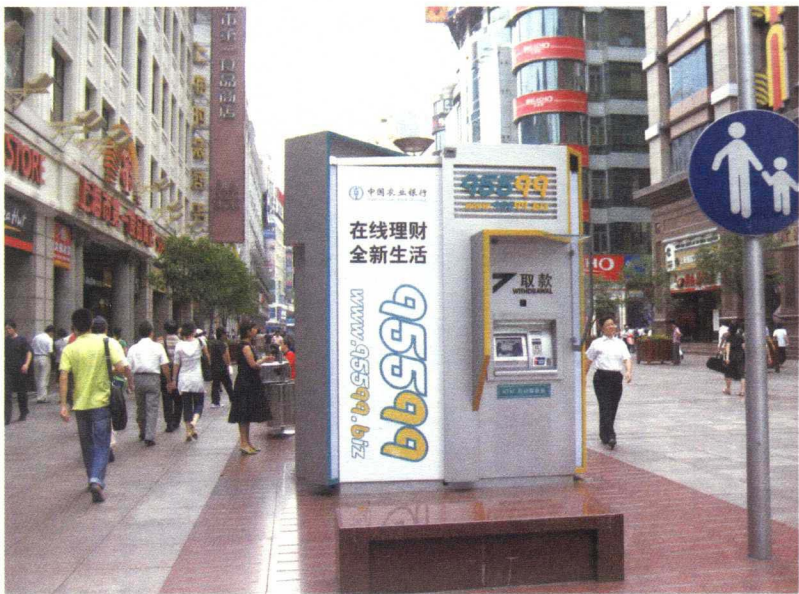
图 1-3-7 自动取款机

此外,还有消火栓、水源、公共设施检修点及节日庆典装置预留物。有些公共环境产品还兼作广告媒体,故其与广告设计亦有相融之处。