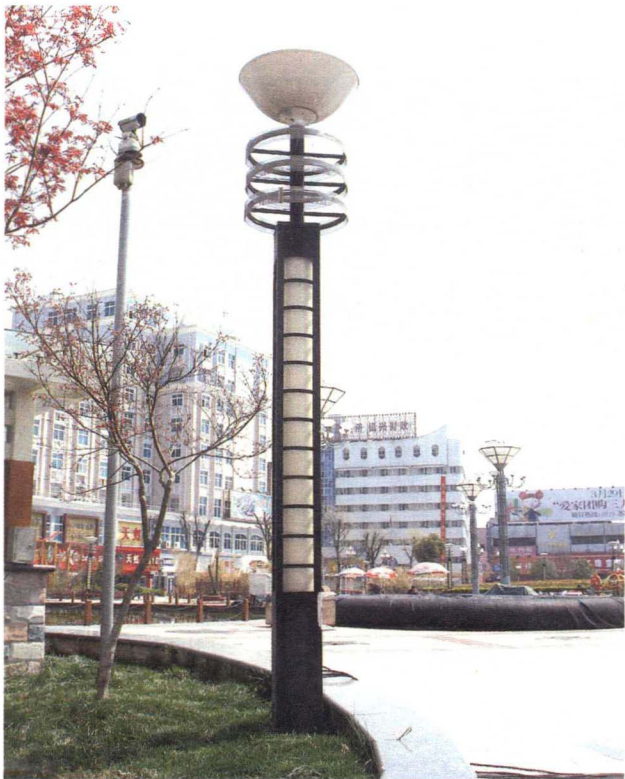
图 1-3-5 城市照明灯具