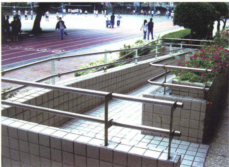
图 1-3-8 无障碍坡道