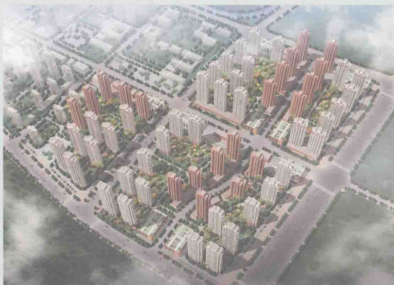
◀ 天津市和苑西区一期安置房项目整体鸟瞰 (天津市国土资源和房屋管理局提供)