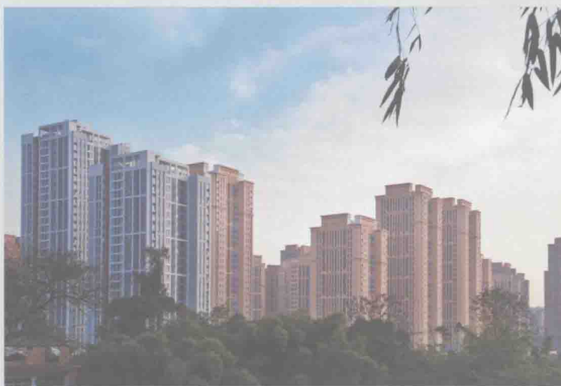
◀ 重庆市城南家园公租房建成