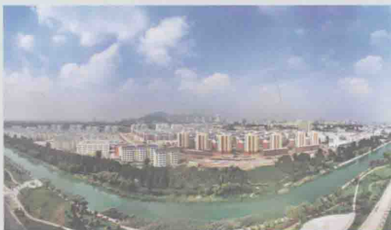
安徽省淮北市濉河花园棚改安置房