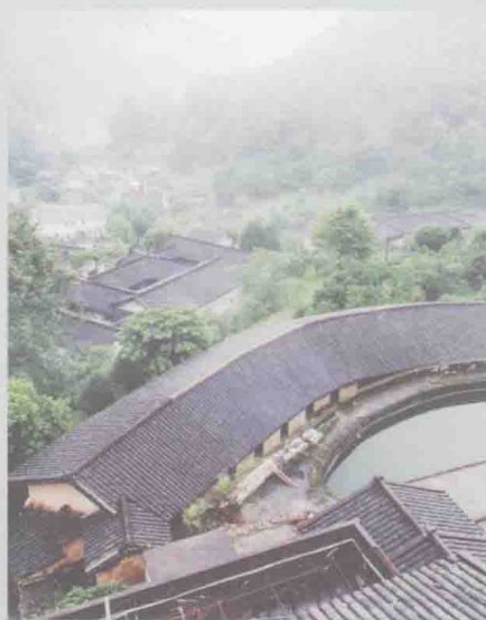
广东省梅州市梅县桥溪村古建筑仕德堂航拍图