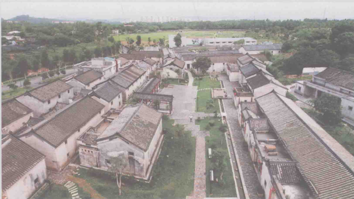
深圳市“中国·观澜”版画原创产业基地建设项目