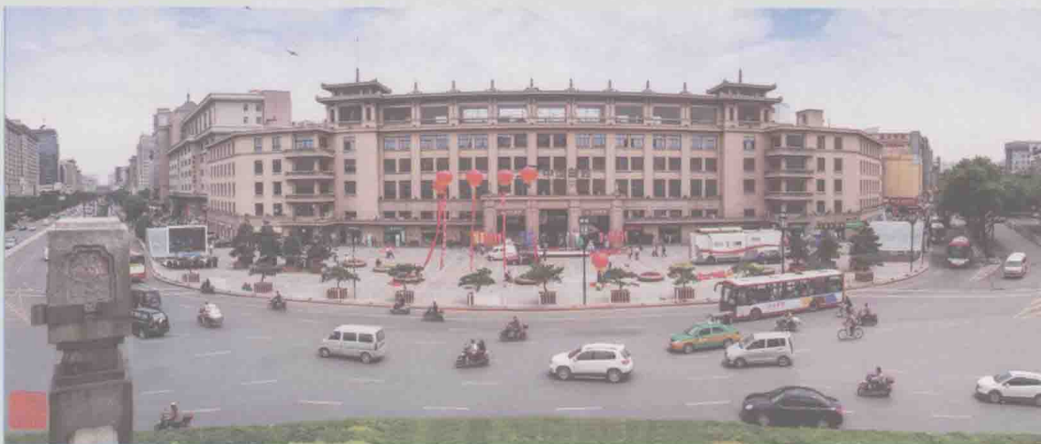
陕西省西安市钟楼邮政大楼，二十世纪五十年代苏式建筑。1958年动工，1960年建成，坐落于西安市钟楼东北角，是西安市地标性建筑之一