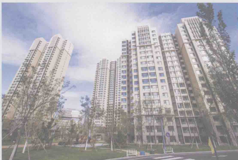
◀ 北京市西城区旧城保护定向安置房二期项目