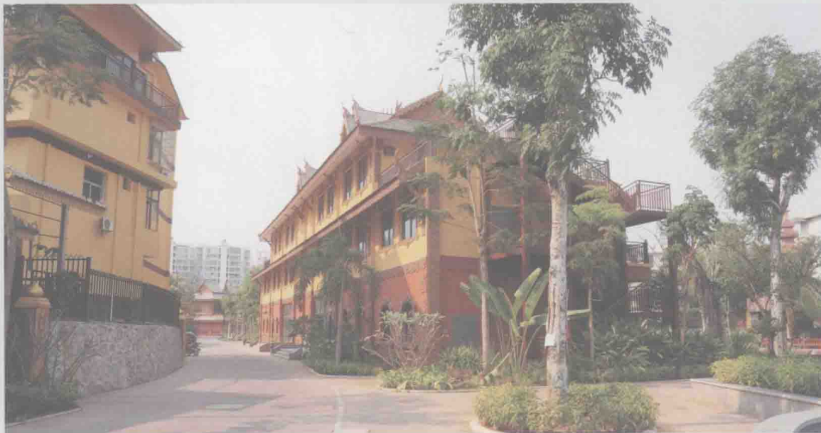
云南省景洪市饮水入城棚户区改造项目