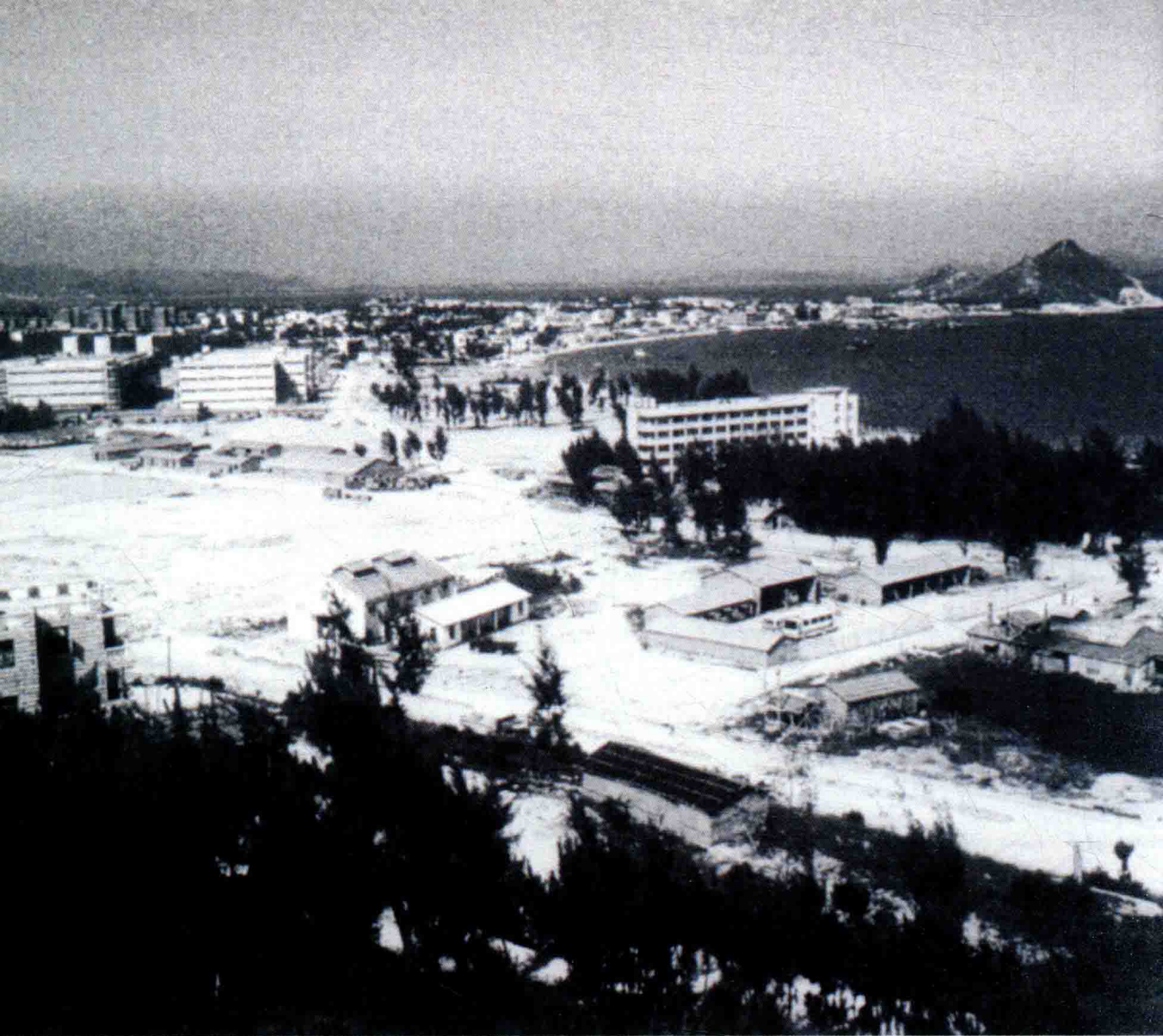
▲ 20世纪80年代的深圳蛇口工业区。

进入改革开放时代，特区精神穿越时空、一脉相承，改革之火燃遍神州，大地处处万物复苏。