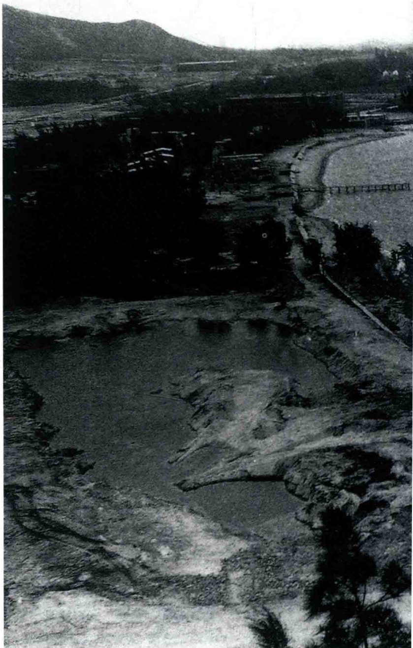
► 改革开放初期的蛇口。

回望革命战争年代，陕甘宁特区犹如精神灯塔，为夺取革命胜利、建设新中国立下了不可磨灭的功勋。