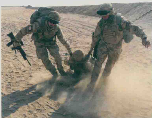
进行战地救援训练的美军士兵

俗民情，熟练操作和维修本国及各国的现行武器装备，驾驶各型军用车辆及坦克和直升机，水下战斗，在丛林、雪地、沙漠和核、生、化条件下的生存与作战的技能，以及战地救护等。