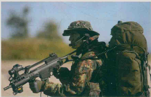
全副武装的德国海军特种兵

以色列特种部队的应征者首先要接受严格的体检、心理测试和背景调查。在入伍后1周内，部队还要对其入伍动机、个人爱好、特长等进行考察。新兵能够通过这一考核的比例仅为10%~20%。此后，这些通过初步考核的人员将接受20~24个月的基础训练和特种训练，考试合格后方可在特种部队服役。印度特种部队要求应征者必须信守“职责、荣誉、国家”的格言，具有主动性和创造性，必须拥有强健的体魄，同时要求具有高中文凭。