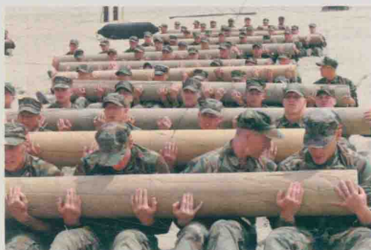
美国海军“海豹”突击队进行体能训练

模拟训练主要分为两种类型。一是采用先进的训练模拟器材，包括用于进行复杂技术装备操作训练的技术模拟器材（如直升机模拟驾驶仪），以及场地或室内使用的对抗模拟器材（如美军的多用途激光交战模拟器）。二是设置逼真的实战环境，即在实地使用假想敌和实物进行训练。如以色列和印度的特种部队在机场的民用客机上进行反劫机实战演练，机内有扮装的乘客和劫机恐怖分子。美军特种部队则按照任务的需要组织参训人员到深山、沙漠、港口等特殊场地与扮装的“游击队”或“恐怖分子”进行非正规战和反恐怖行动训练。此外，美国和以色列还尽可能让其特种部队参加实战锻炼，以提高实战能力。