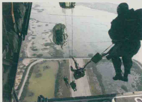
特战队员进行高空跳伞