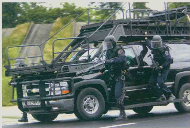
法国国家宪兵干预队装备的装甲车辆

目前，各国特种部队在更多地采用陆、海、空三军通用的轻便、灵活、性能更好的装备的同时，还在积极研制专用和新概念武器，即那些可能改变传统特种作战方式的专用和非致命性武器。如美国国防部已授权成立一个专门机构，研究非致命性武器所需的相关技术，包括激光、微波、声波、电磁脉冲、化学复合物和电脑病毒等。美军成立不久的特种作战研究与发展中心也投入大量资金用于反恐专用武器装备的研制。