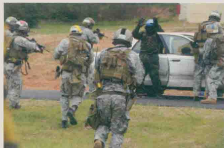
“三角洲”特种部队进行反恐怖训练