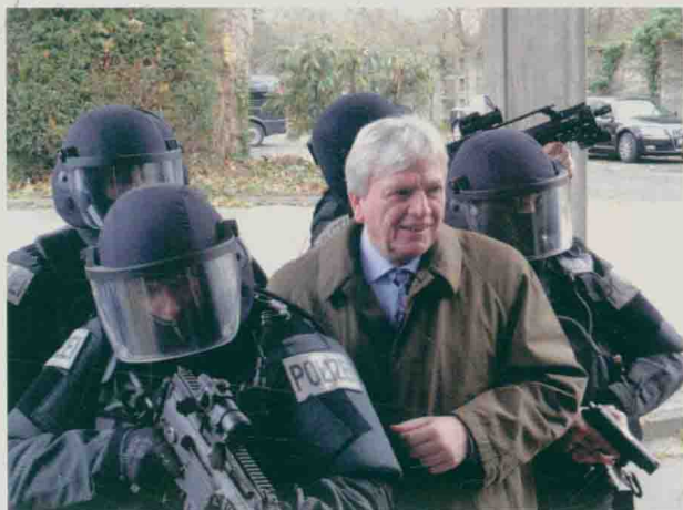
执行要员保护任务的德国 GSG-9 行动小队

各国特种部队的编制一般为大队（群）或团（营），下辖中队、小队或连、排（组）。大队（群）或团（营）编制一般有1200~1500人，中队、小队或连、排（组）编制只有数十人。而组为最小的作战编制，一般为2~15人。如美国陆军特种作战群为1400人，辖54个中队，每个中队仅12人。