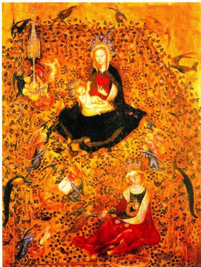
8. 维罗纳的斯泰法诺作《玫瑰园圣母》，约1420年，木板蛋彩画，63.55×46.2厘米，维罗纳市博物馆藏。

这是一片贵族的天地，西方绘画史上第一次出现一群特权人物，他们在追求和享受一种舒适而饶有趣味的的生活。自然被顾及到了，但它必须与宫廷生活合拍，自然若要包括在图内，就必须是整饬过的、镀了金的、经过处理的，一切使人难堪的角落都应弥平，换句话说，这是个经过驯服的自然。