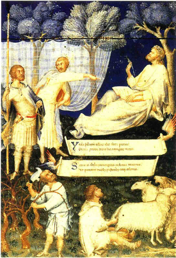
4. 西蒙·马蒂尼为 一本维吉尔作品手 抄本作的封面画， 该书为彼特拉克所 有。作于1340年， 29.5×20厘米，米 兰安布罗西亚那图 书馆。

欧洲，几乎已没有人懂得这种语言了。彼特拉克说：只有用这种方法才能使“多少年来埋没无名的作家们得到新生”。他这里显然是指荷马和柏拉图。