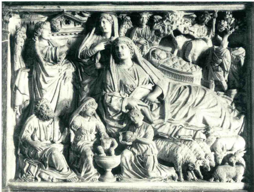
5. 尼古拉·皮萨诺作《耶稣诞生图》，约1260年，大理石浮雕，85×113厘米，比萨洗礼堂。