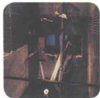
须田悦弘《非饮用水源》2001年

图为须田悦弘的作品《非饮用水源》。须田在美术馆的原暗室区墙上发现了一张战后时期的标语“ This water unfit for drinking ”，由此得到启发并将作品取名为“非饮用水源”。即使在如此偏僻之所，历史依然留下了痕迹。