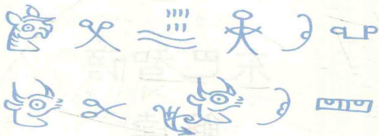
和丽宝翻译和书写的纳西民谚