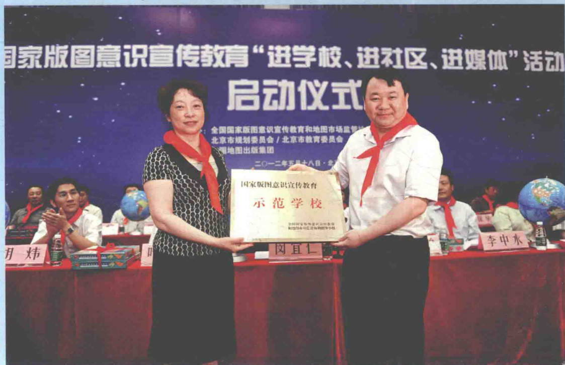
▲ 2012年5月18日，国家测绘地理信息局副局长闵宜仁（前右）在北京出席国家版图意识宣传教育“进学校、进社区、进媒体”活动启动仪式，并代表全国国家版图意识宣传和地图市场监管协调指导小组授予北京市中古友谊小学“国家版图意识宣传教育示范学校”称号。