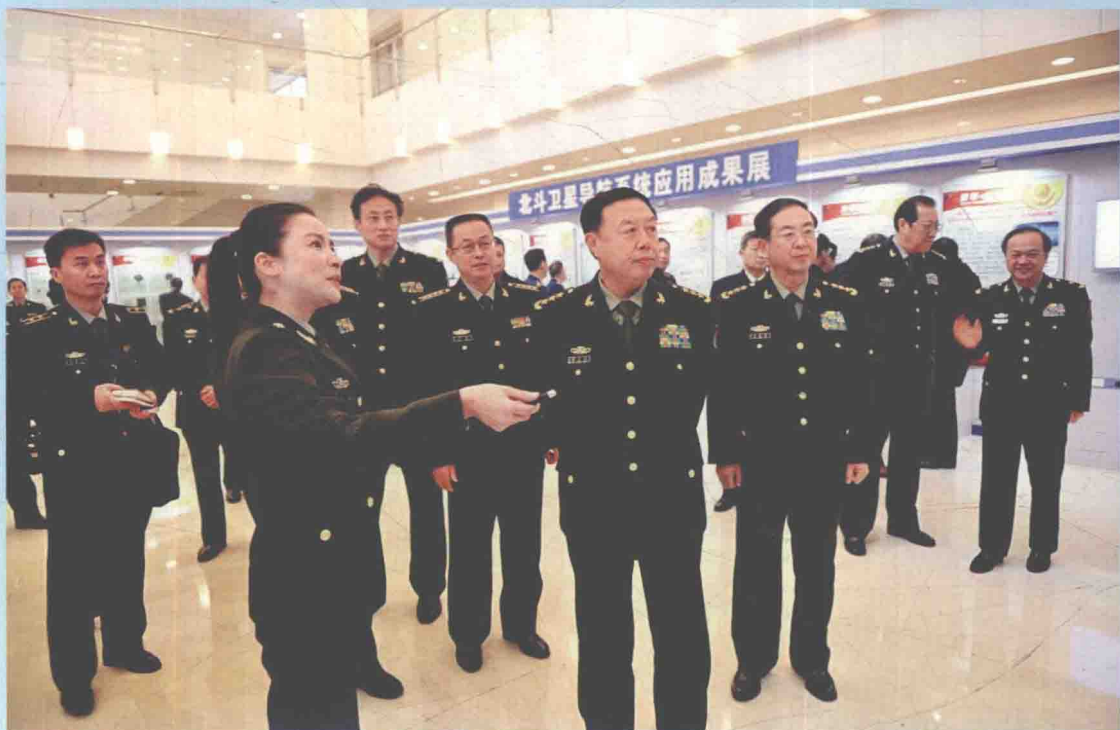
▲ 2012年12月28日,北斗二号卫星导航系统开通活动在解放军某卫星导航定位总站举行。中央政治局委员、中央军委副主席范长龙上将(前排右二),中央军委委员、总参谋长房峰辉上将(前排右一)出席活动。