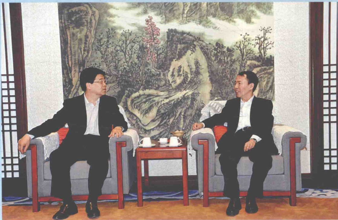
▲ 2012年5月10日，国家测绘地理信息局副局长李维森（左一）在长春参加数字通化、数字九台地理空间框架建设成果发布暨吉林省数字城市推广会并会见吉林省副省长王化文。