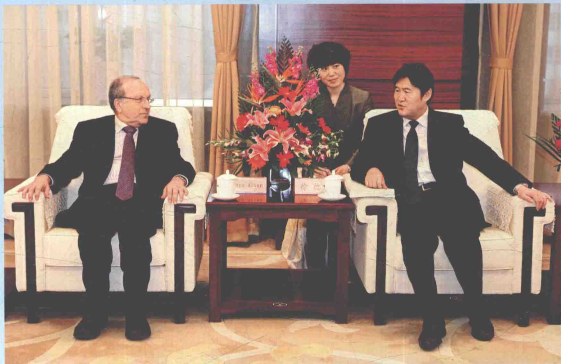
▲ 2012年2月17日，国家测绘地理信息局局长徐德明（右）在北京会见国际摄影测量与遥感学会（ISPRS）主席奥汉·阿尔坦教授（左）。