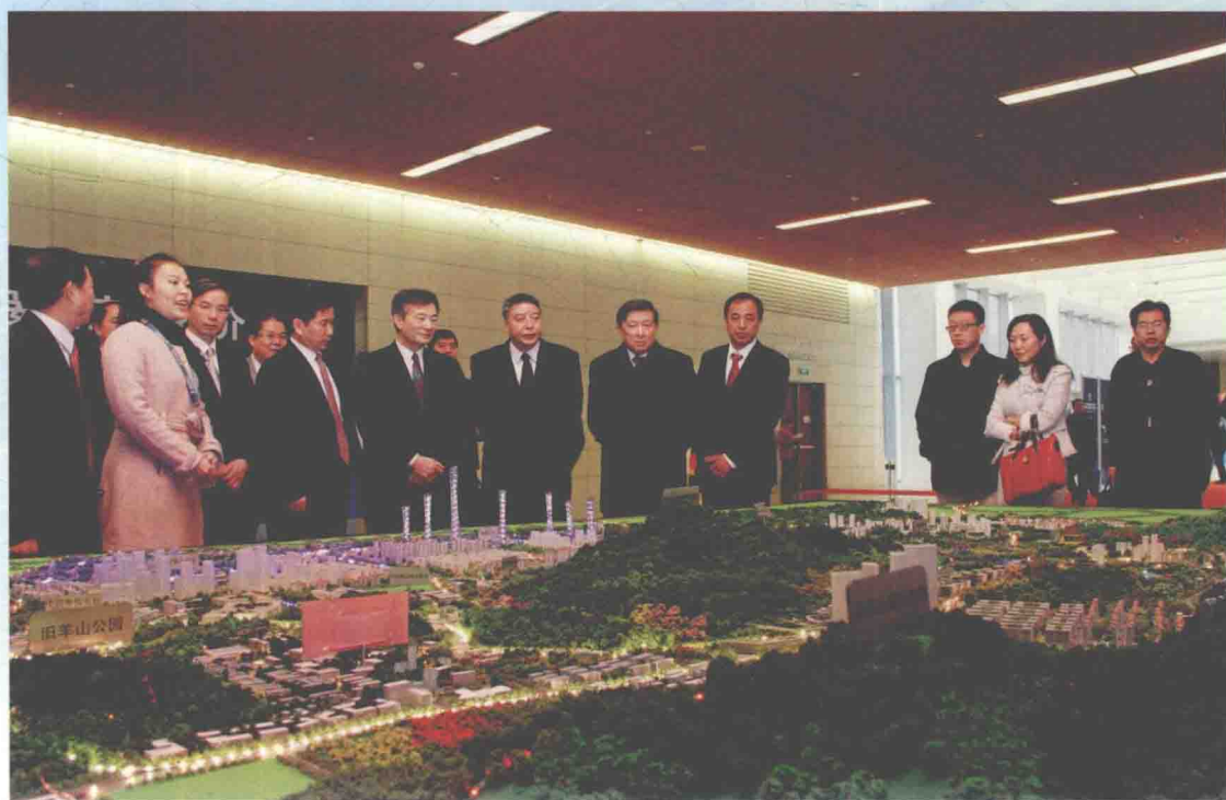
▲ 2012年11月29日,全国政协副主席罗富和(右七),全国政协教科文卫体委员会主任、中国科学院院士徐冠华(右五),广东省副省长许瑞生(右六)等参观中国地理信息产业成就展。