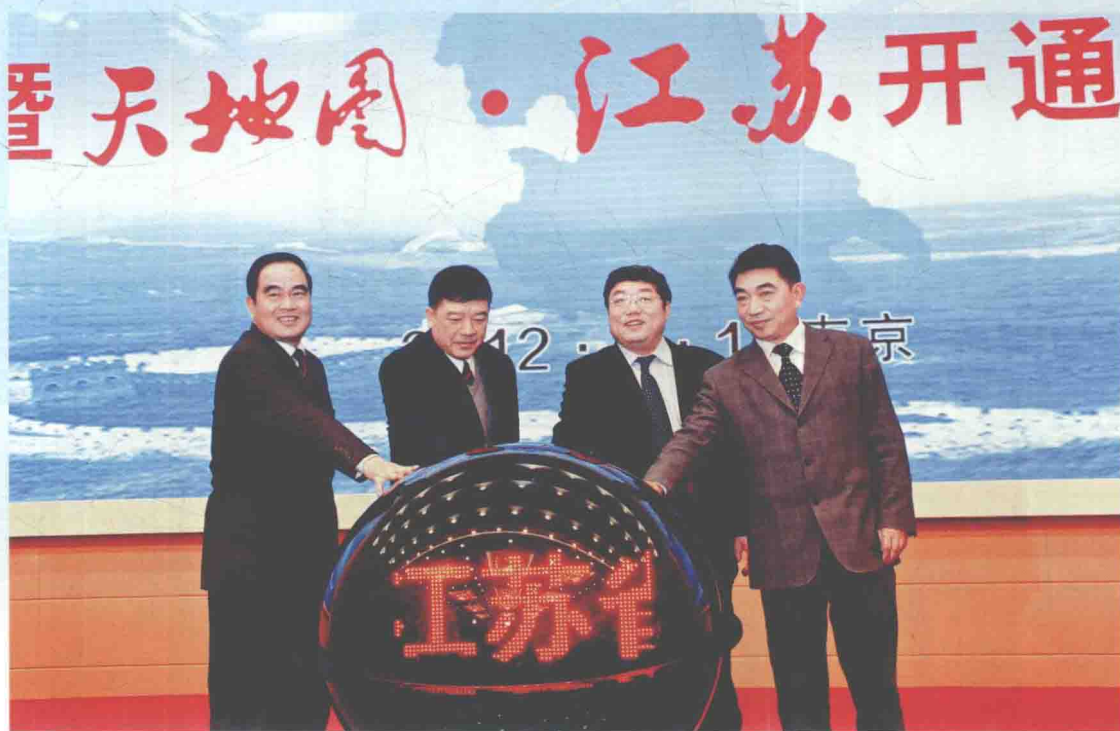
▲ 2012年3月1日，国家测绘地理信息局副局长王春峰（右二）、江苏省副省长徐鸣（右三）在南京出席江苏省“十一五”基础测绘成果发布暨“天地图·江苏”开通仪式。