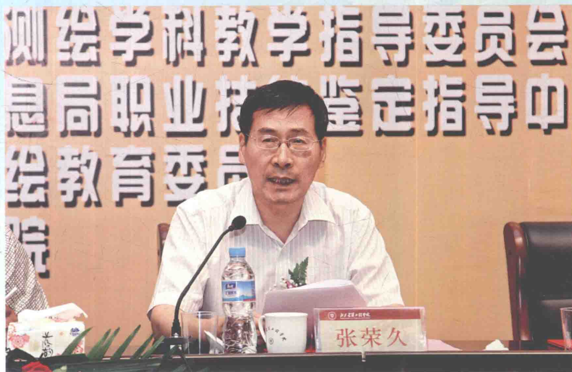
▲ 2012年7月17日，国家测绘地理信息局党组成员、纪检组组长张荣久出席第二届全国高等学校大学生测绘技能竞赛开幕式并讲话。