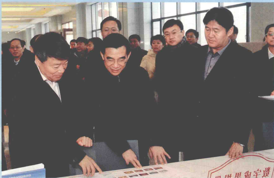
▲ 2012年12月20日，国家地理信息科技产业园一期开园，园区综合办公楼启用，国土资源部部长徐绍史（左一），北京市委副书记、代市长王安顺（左二），国家测绘地理信息局局长徐德明（右一）在产业园考察工作。