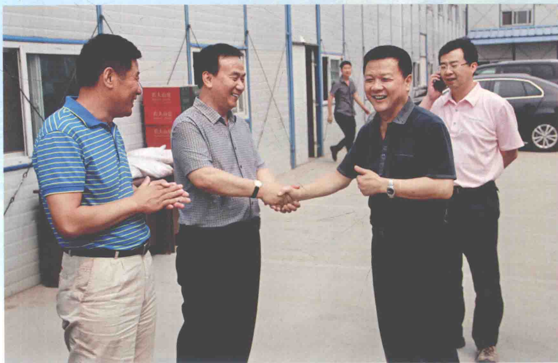
▲ 2012年6月21日，国家测绘地理信息局副局长宋超智（右二）看望、慰问参与国家地理信息科技产业园建设的干部职工。