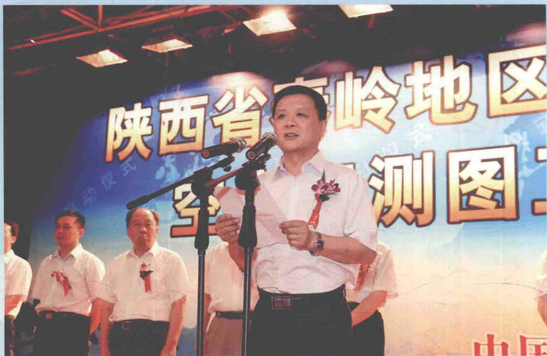
▲ 2012年7月3日，国家测绘地理信息局副局长宋超智在西安出席陕西省秦岭地区1:1万地形图测图工程启动仪式。