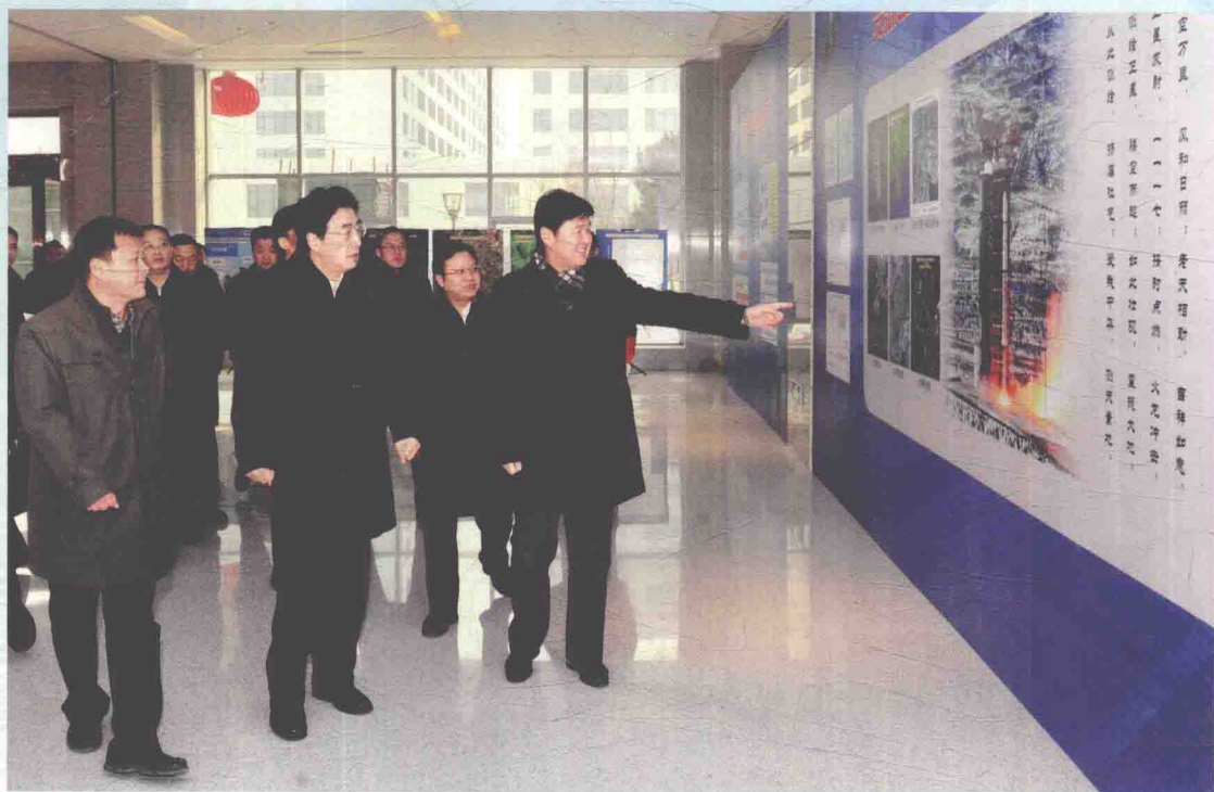
▲ 2012年12月27日，中央政治局委员、北京市委书记郭金龙（前排右二）到国家地理信息科技产业园视察调研。国家测绘地理信息局局长徐德明（前排右一）陪同。