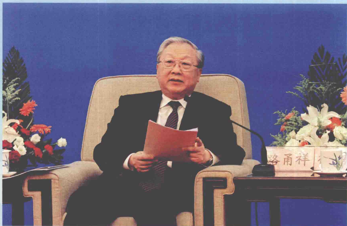
▲ 2012年9月14日，全国人大常委会副委员长路甬祥在北京出席《中华人民共和国测绘法》修订十周年座谈会并讲话。