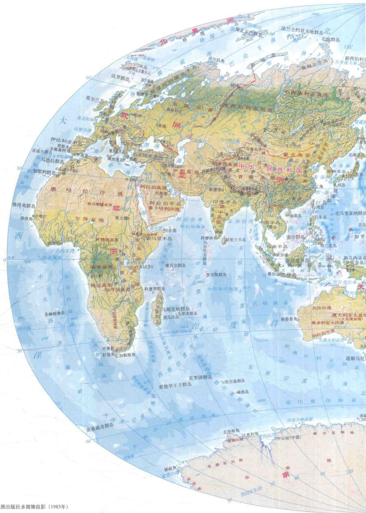
中国地图出版社多圆锥投影 (1983年)