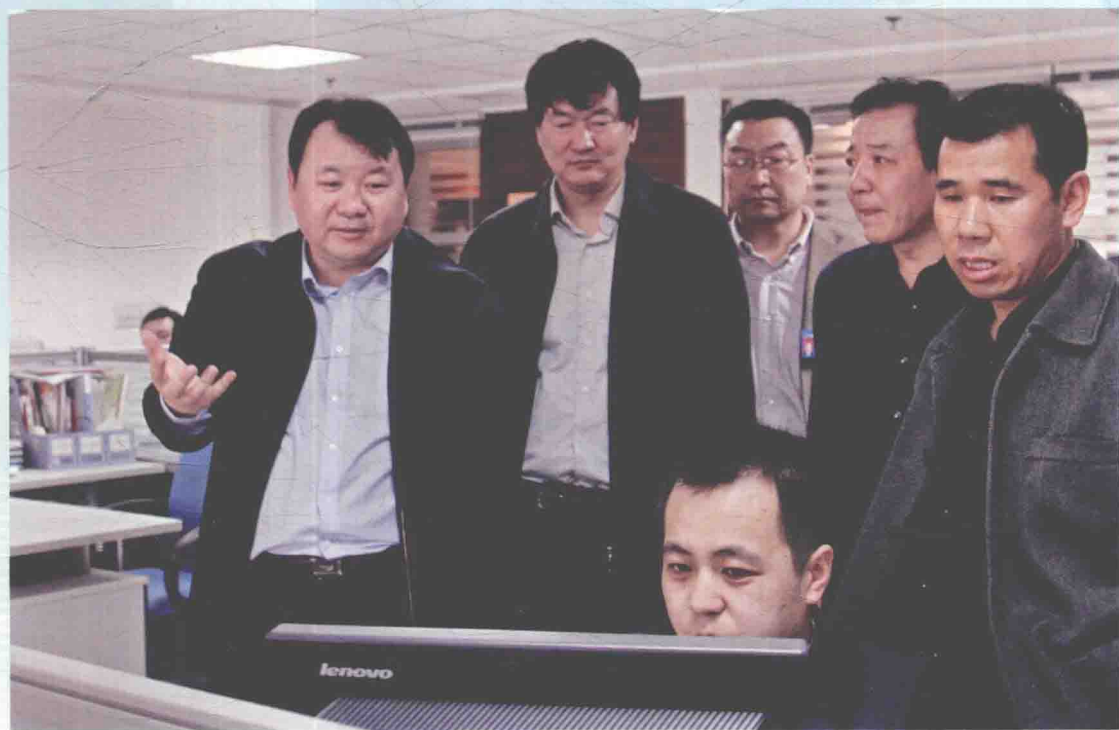
▲ 2012年4月11日，国家测绘地理信息局副局长闵宜仁（左一）在新疆维吾尔自治区测绘档案资料馆调研。