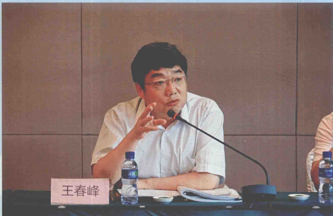
▲ 2012年7月27日，国家测绘地理信息局副局长王春峰在成都出席国家测绘地理信息局支持新疆和四省藏区基础测绘建设工作布置会。