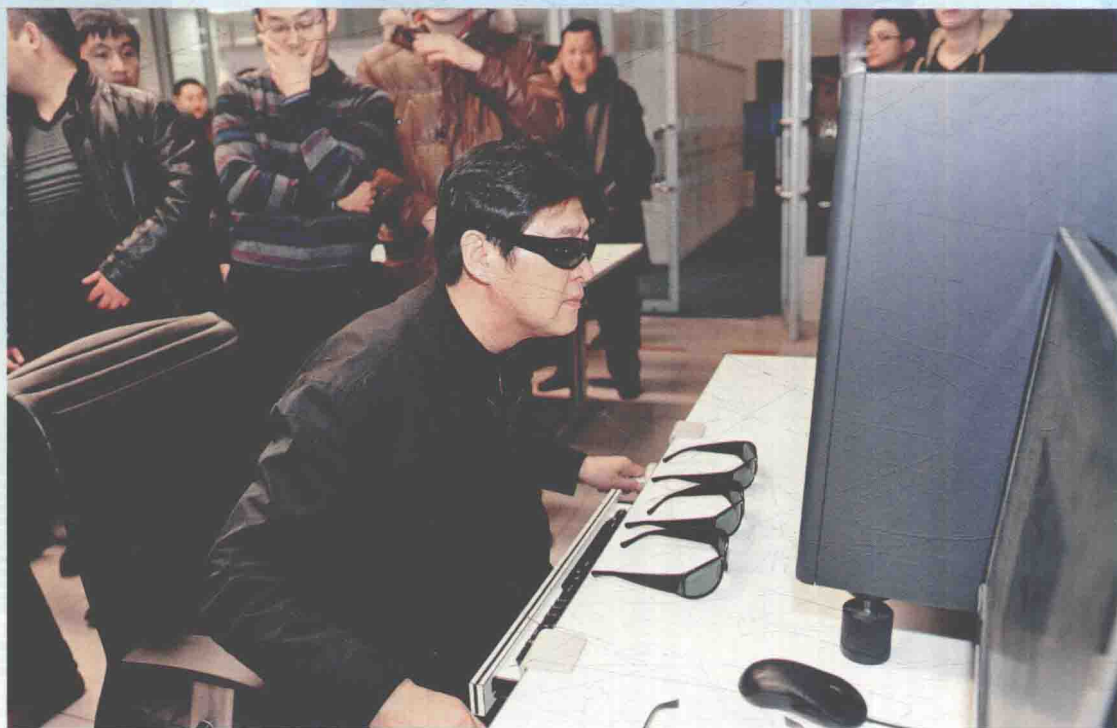
▲ 2012年1月11日，我国首颗高精度民用立体测绘卫星资源三号成功传回第一批影像数据。国家测绘地理信息局局长徐德明观看影像数据。