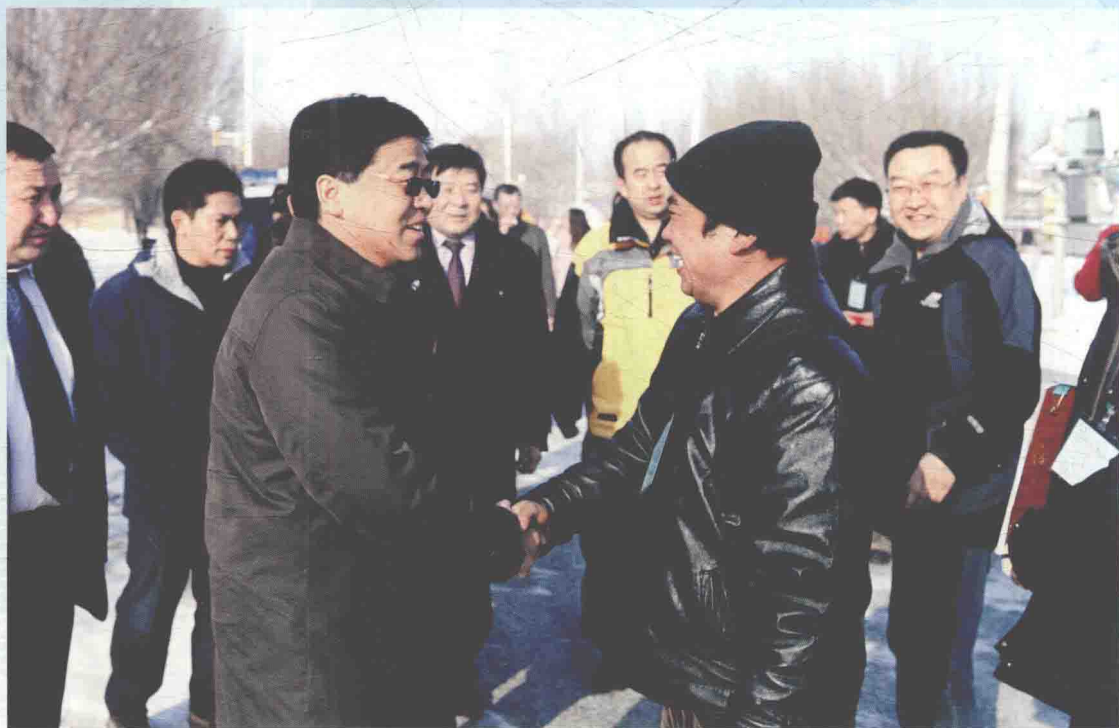
▲ 2012年1月20日，国家测绘地理信息局副局长李维森（左一）慰问在伊犁地震灾后重建测绘一线的职工。