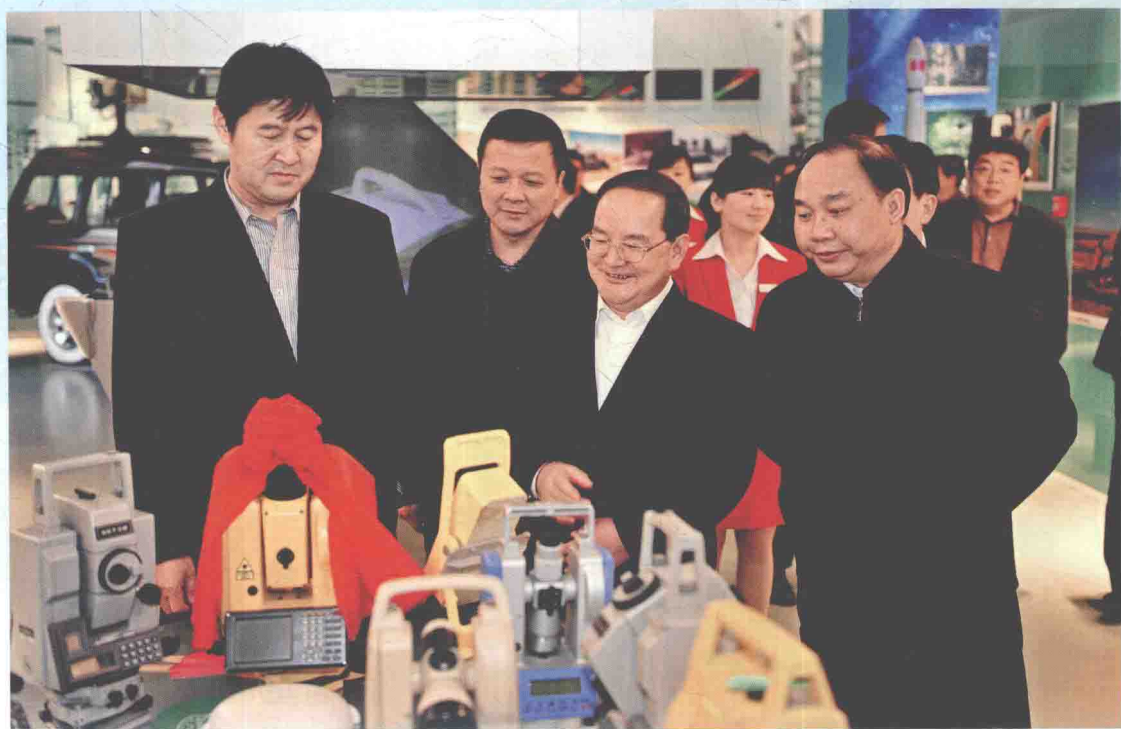
▲ 2012年3月6日，国家测绘地理信息局局长徐德明（左一）、副局长宋超智（左二）陪同江西省委副书记、省长鹿心社（左三）参观中国测绘科技馆。