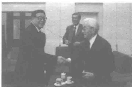
中国社会科学院院长王伟光与日本驻华大使横井裕、“日中未来之会”代表南村志郎交谈