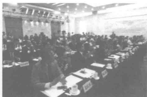
与会代表在人民大会堂河南厅