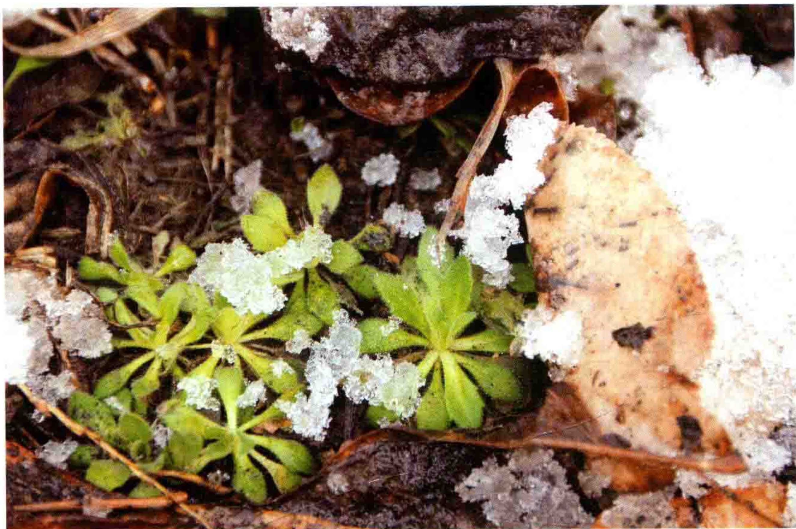
消融的残雪与枯叶之下，藏着葶苈的小嫩芽。