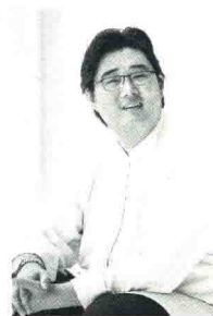
沈洋 / 男低音歌唱家