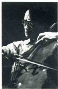
王健 / 大提琴家

我一直很喜欢的一首曲子，拉赫玛尼诺夫《第二交响曲》的慢乐章，对我来说实在是太美了。