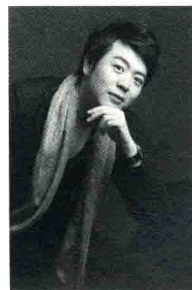
郎朗 / 钢琴家

如果现在别人跟我说，朗朗我给你一百个亿，你不用练琴了，你换不换？打死我都不会换。我留在音乐上的精神，是所有事情都不能比拟的，而且完全不在一个档次上。作为一个音乐家，我觉得很幸福。