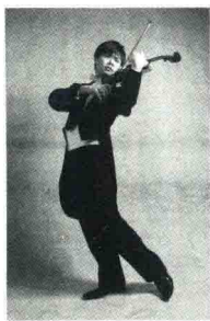
黄蒙拉 / 小提琴家