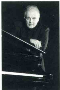
巴伦博伊姆 ／钢琴家 指挥家

在约旦河西岸城市拉马拉成立音乐幼儿园，是因为我觉得在拉马拉这样的地方开展音乐教育，比在柏林、伦敦或纽约更省心。“从娃娃抓起”的音乐教育少得可怜，再这样下去，30年以后我们就没有音乐生活了。在柏林，给孩子上一堂小提琴课，是让孩子提起兴趣的一小时；在巴勒斯坦，则是远离暴力、远离原教旨主义的一小时。不是说古典音乐跟巴勒斯坦、阿拉伯特有亲缘，可当你怀着理解将音乐介绍给他们，音乐便能丰富他们的生活，激发他们的创造力。