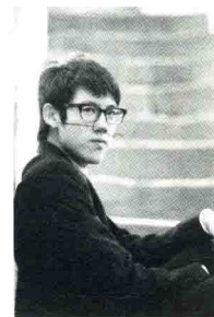
张昊辰 / 钢琴家

如果我不做音乐，我想象不到做任何事，其他事情都不能像音乐一样吸引我。我成长在奥地利西部的山区，跟自然的关系很亲密，所以如果我不做音乐家，也许我会做户外的一些工作。