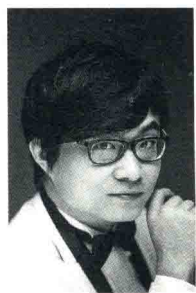
宋思衡 / 钢琴家