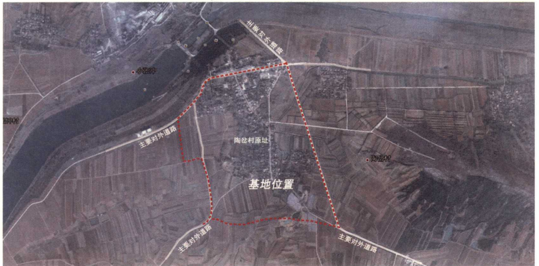
↑ 图 1-3 陶岔新村基地范围