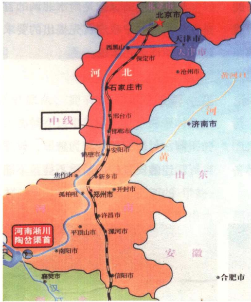
← 图 1-2 陶岔新村在南水北调工程的位置