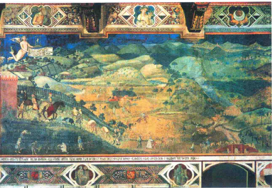
“坏政府的恶果”（城市部分）

此形成鲜明对比的是，“好政府的善果”显示了理想中的城市共和国——锡耶纳的风采：城市及其周边农村阳光灿烂、色彩缤纷。这里没有危险，只有安全与平和，人人充满了睿智。很显然，这幅壁画不是城市锡耶纳及其周边世界完全真实的写照。这一点可以从壁画对城市建筑用途的设计中推测出，也可以从壁画的田园风光及四季风景中察觉到。它用寓意的方式通过人们的着装、建筑、道路、树木、动物等，向我们传递了中世纪欧洲（意大利）世界的情形。可以说，当时托斯卡纳地区真实的光景与“好政府的善果”中描绘的理想情形相去甚远。真实的情况是14世纪前叶，