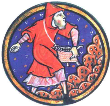
播撒种子的农民。出自英国制作的手抄本插图（13世纪初。藏于意大利伊莫拉市图书馆）

城市里，货币经济与分工合作在不断展开，与此同时，农村也受到诸多影响。一方面，农村向城市输送谷物、蔬菜、乳制品等食物及羊毛、亚麻等手工业原料；另一方面，在城市生产或通