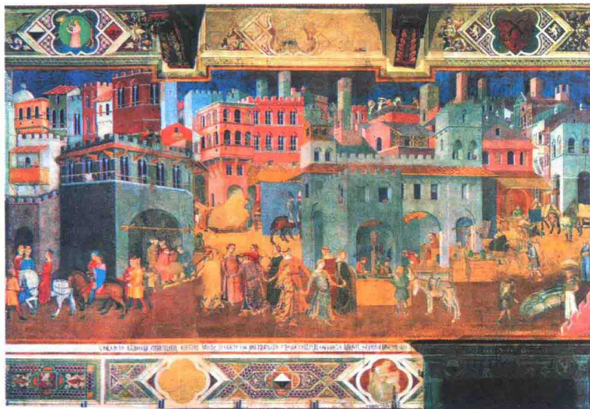
“好政府的善果”（农村部分）