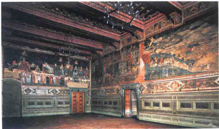
市政厅里的《好政府和坏政府的寓言》

锡耶纳位于意大利中部的托斯卡纳地区。其市政厅“九人会议厅”里的壁画，是画家安布罗乔·洛伦泽蒂（约1290—1348年）于14世纪前叶（1338—1339年）受九人委员会委托创作。这幅著名壁画名叫《好政府和坏政府的寓言》，画面内容丰富，