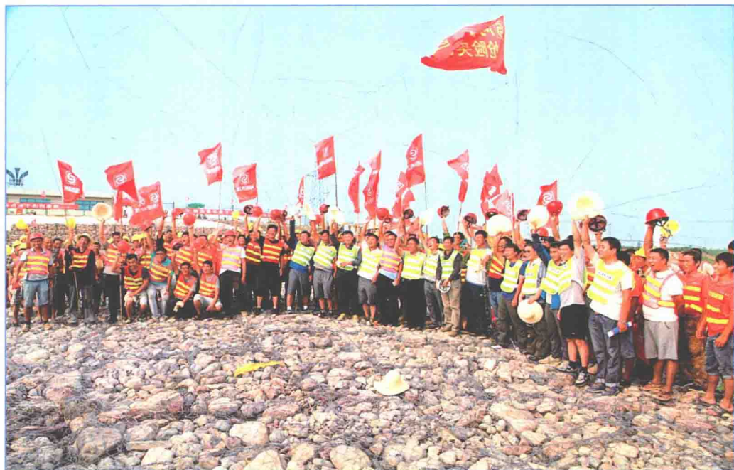
■ 2016年7月，南水北调中线一期工程抗洪抢险取得胜利。