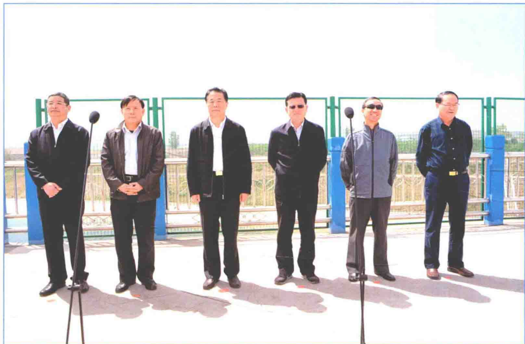
■ 2016年4月，南水北调工程运行管理举报公告牌揭牌现场。