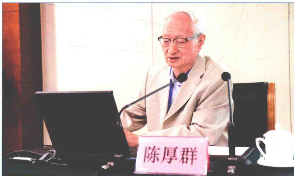
■ 2016年5月，国务院南水北调建委会专家委员会主任陈厚群院士出席调水工程建设与运行管理交流会并作学术报告。