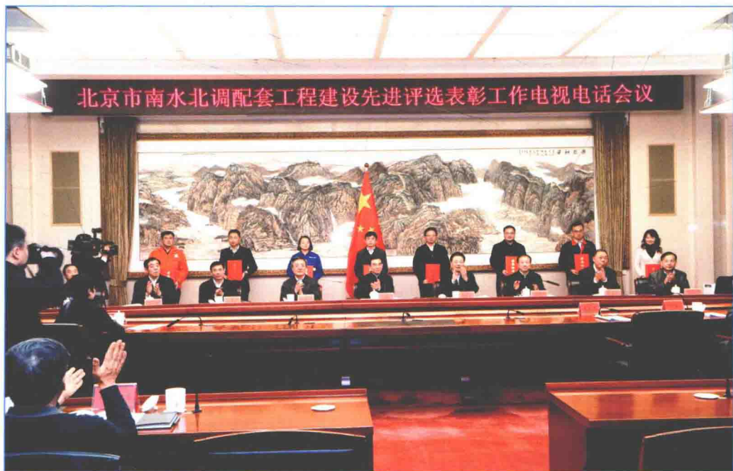
■ 2016年2月，北京市南水北调配套工程建设先进评选表彰工作电视电话会召开。