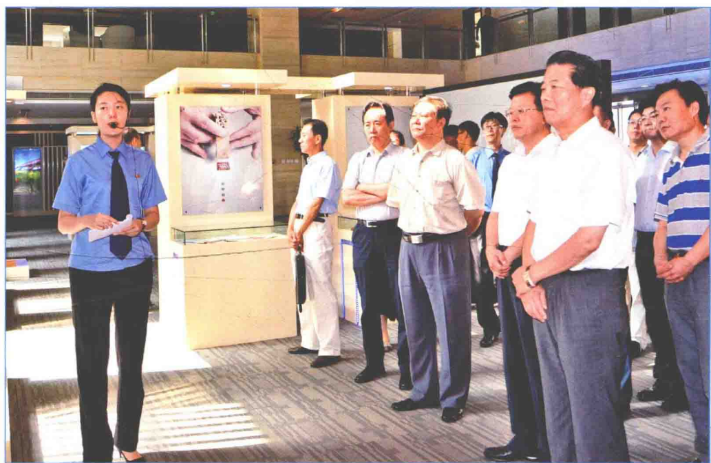
■ 2016年8月，国务院南水北调办组织党员干部到北京市西城区人民检察院预防职务犯罪警示教育基地学习参观，接受警示教育。