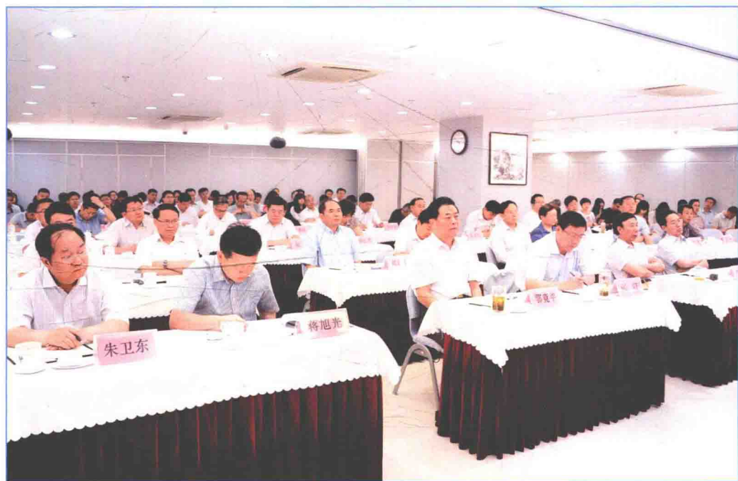
■ 2016年6月，国务院南水北调办举办党支部书记“两学一做”学习教育专题培训班。