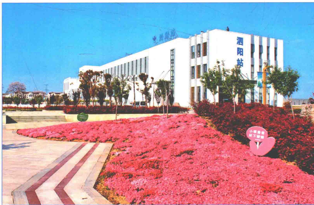
■ 2016年4月，南水北调东线一期工程泗阳站工程。