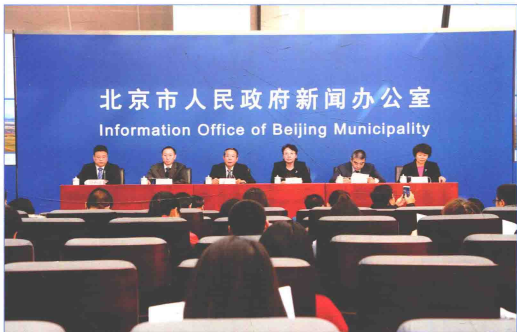
■ 2016年12月，北京市召开“江水进京两周年”新闻发布会。