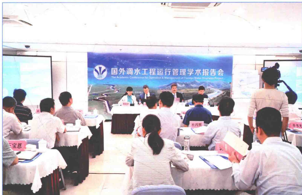
■ 2016年7月，国外调水工程运行管理学术报告会在北京市召开。