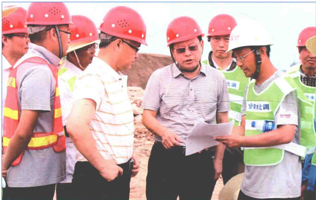
■ 2016年7月，国务院南水北调办副主任蒋旭光带队检查南水北调中线一期工程河南、河北段防汛抢险工作。