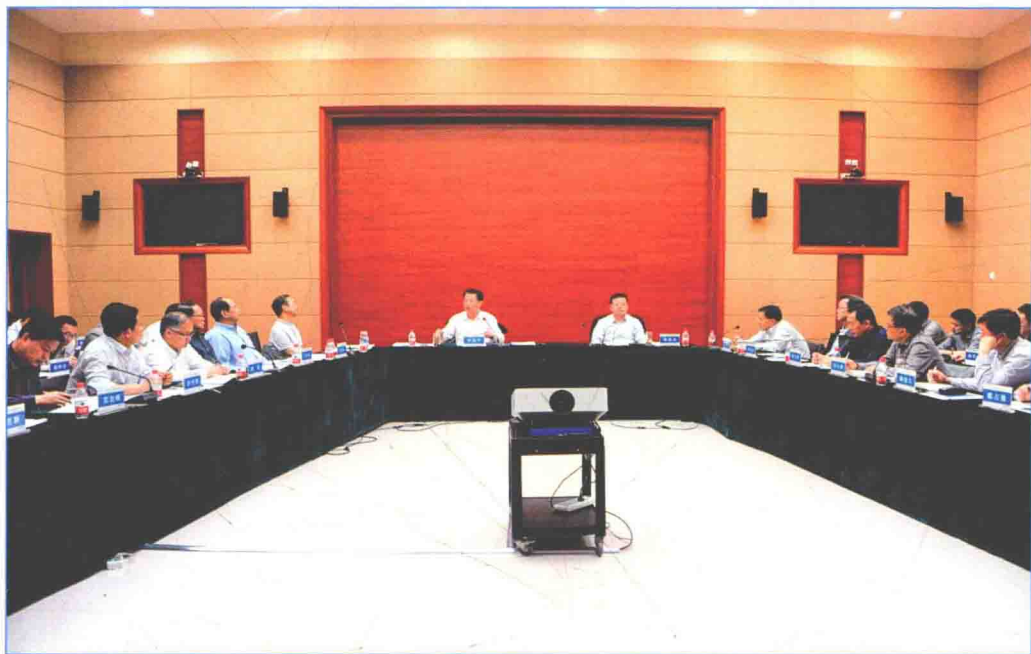
■ 2016年4月，国务院南水北调办在郑州市组织召开南水北调中线工程规范运行管理现场会。