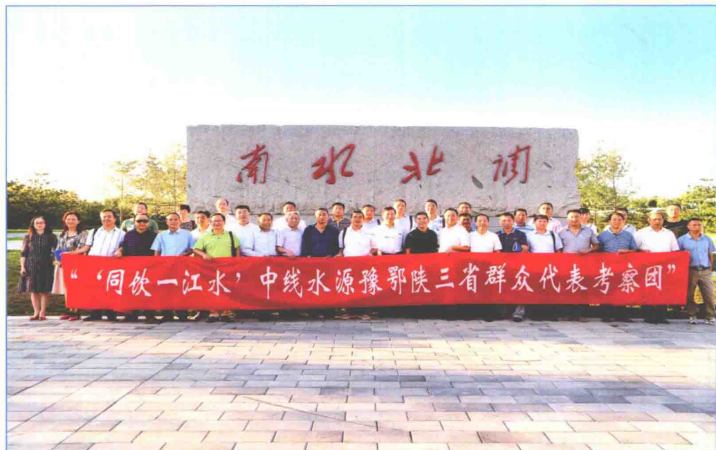
■ 2016年9月，“同饮一江水”南水北调中线工程水源地豫鄂陕三省群众代表到北京市考察。