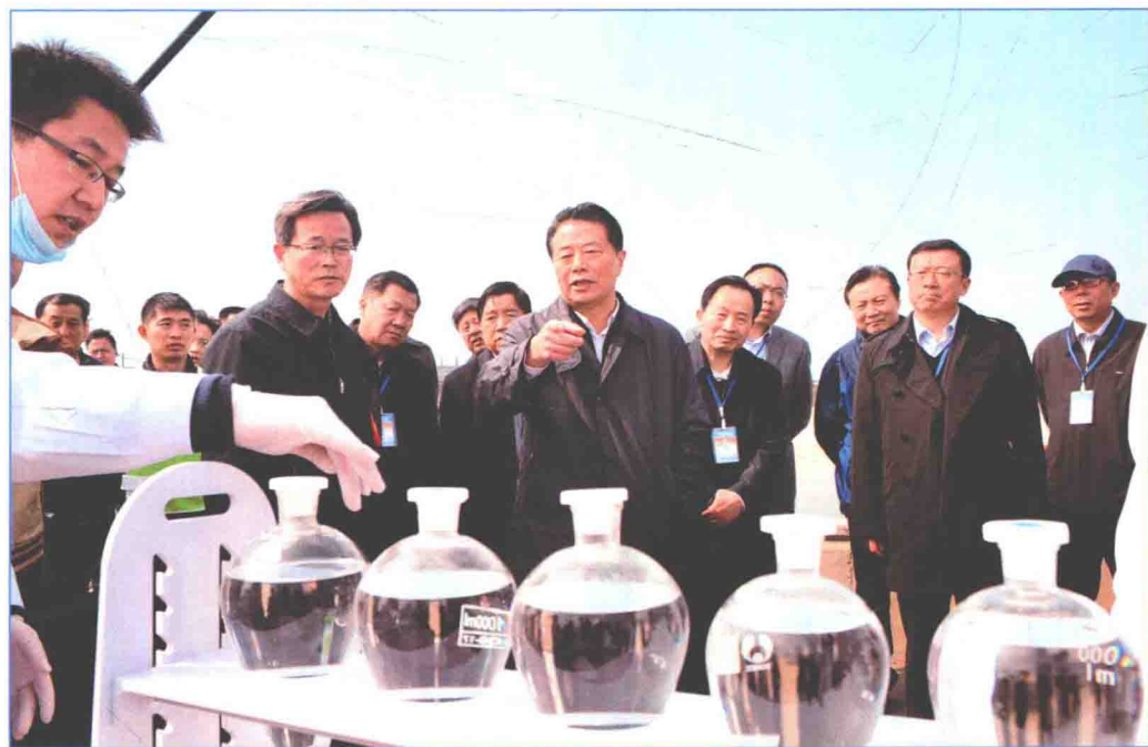
■ 2016年3月，南水北调中线干线工程首次开展突发水污染应急演练。