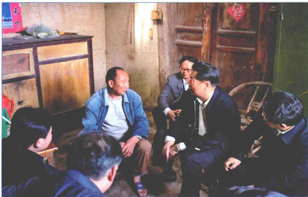
■ 2016年4月，国务院南水北调办主任鄂竟平在郟阳区青山镇周家河村了解贫困户生产生活情况。