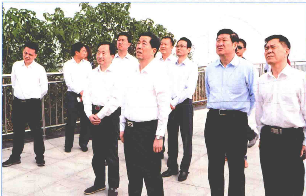
■ 2016年10月，河南省省长陈润儿调研南水北调中线一期工程穿黄工程。