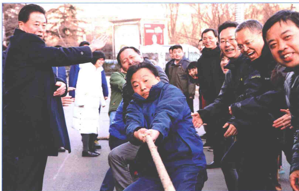
■ 2016年12月，国务院南水北调办直属机关团委、机关工会共同组织举行第三届“通水杯”拔河比赛。