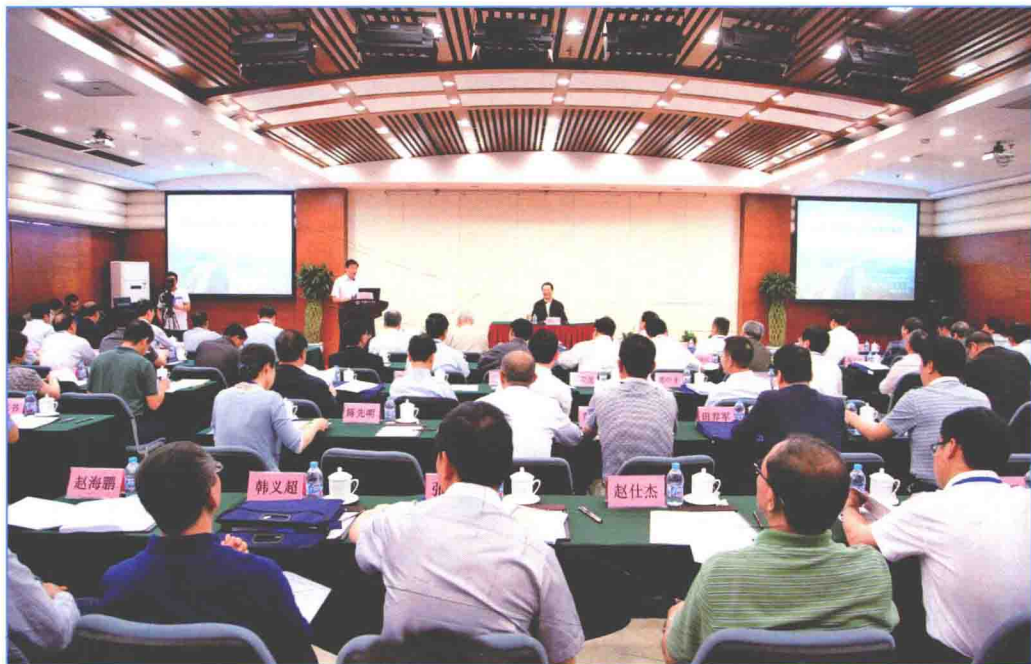
■ 2016年5月，调水工程建设与运行管理交流会在北京市召开。