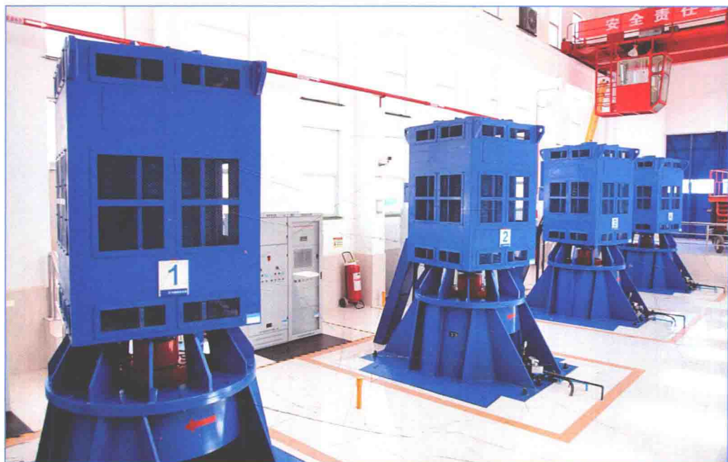
■ 2016年6月，南水北调东线一期工程大屯水库入库泵站机组。