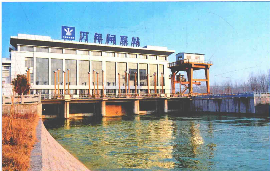
■ 2016年12月，南水北调东线一期工程万年闸泵站调水运行。