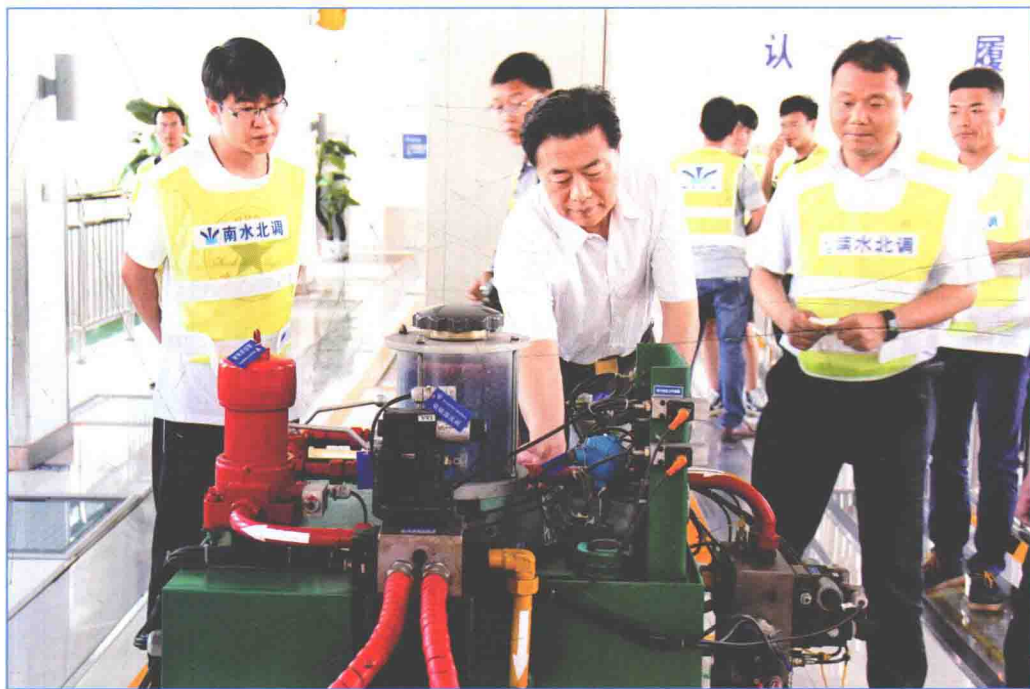
■ 2016年6月，国务院南水北调办主任鄂竟平带队对南水北调中线一期工程邢台一卫辉段工程输水运行和防汛工作进行检查。 (国务院南水北调办监督司 供稿)