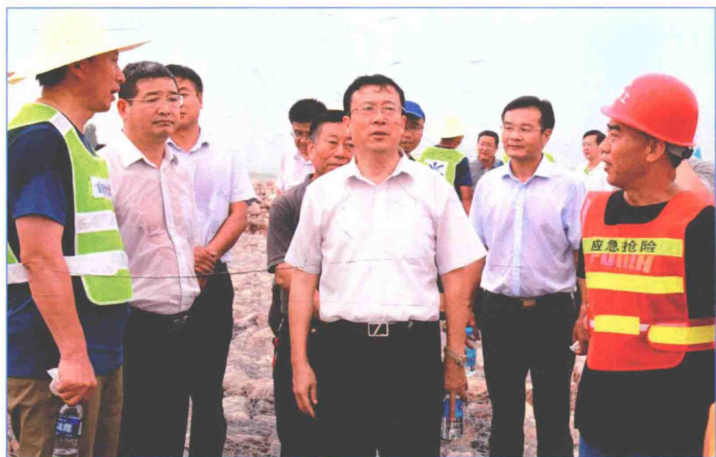
■ 2016年8月，国务院南水北调办防汛指挥部总指挥、副主任张野查看南水北调中线一期工程峪河暗渠抢险加固工程。