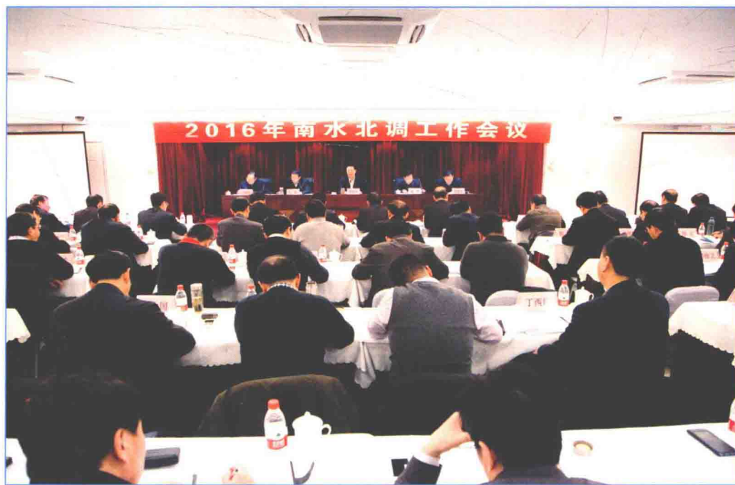
■ 2016年1月，2016年南水北调工作会议在北京市召开。