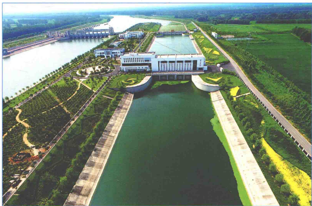
■ 2016年8月，南水北调东线一期工程泗洪泵站工程。