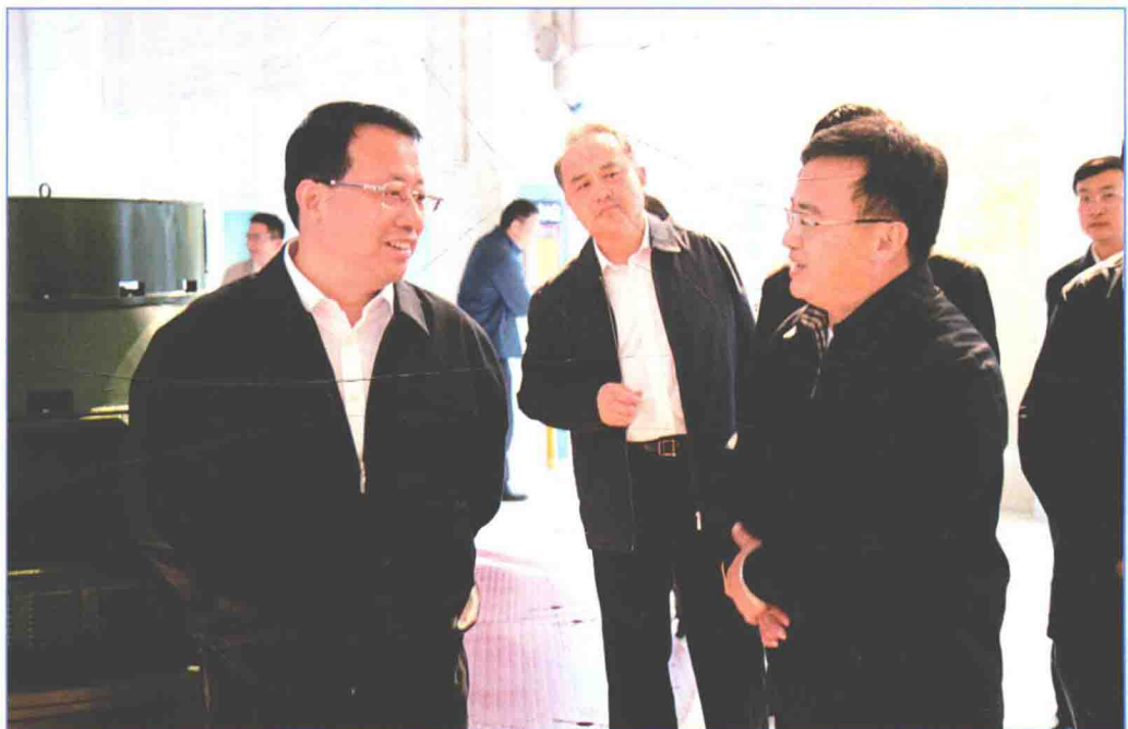
■ 2016年10月11日，山东省省委副书记龚正视察南水北调工程。