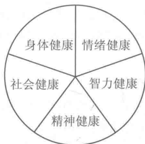
图 1-2 健康五要素