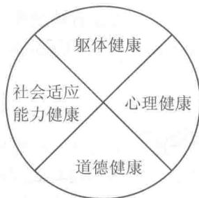
图 1-1 四维健康观

继四维健康观之后,美利坚大学的国家健康中心提出了一个与健康四维观类似的健康定义,即健康是人对环境适应后所达到的一种生命质量,个体只有在身体、情绪、智力、精神和社会各方面达到完美状态才称得上真正的健康,这种健康观又称健康五要素,如图1-2所示。这种观念将人们对健康的认识提高到一个崭新的高度,并为世界各国学者广泛接受。