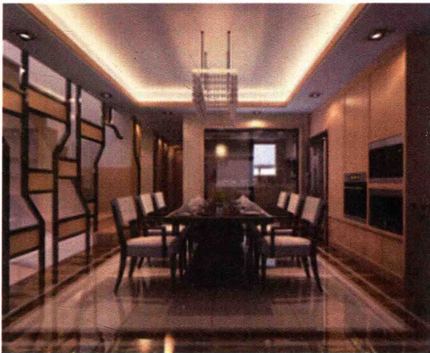
图 1-3 时尚前卫的高技装饰流派

高技装饰流派设计意在强调陈设设计的工艺技术与时代感,崇尚室内环境设计的“机械美”,室内设计空间中粗糙的墙面、柱壁,灰暗的水泥地面,裸露的钢结构与处处展示新型材料和现代加工工艺细致程度及光亮效果的装饰物品相配合,在金属、皮革、粗纺织物和镜面材料的烘托下,形成光彩照人、个性十足的室内环境(如图1-3所示)。