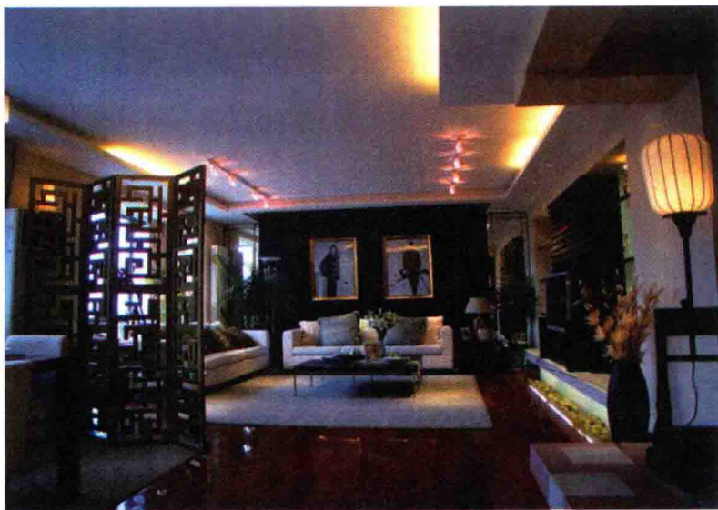
图 1-1 新古典主义装饰流派