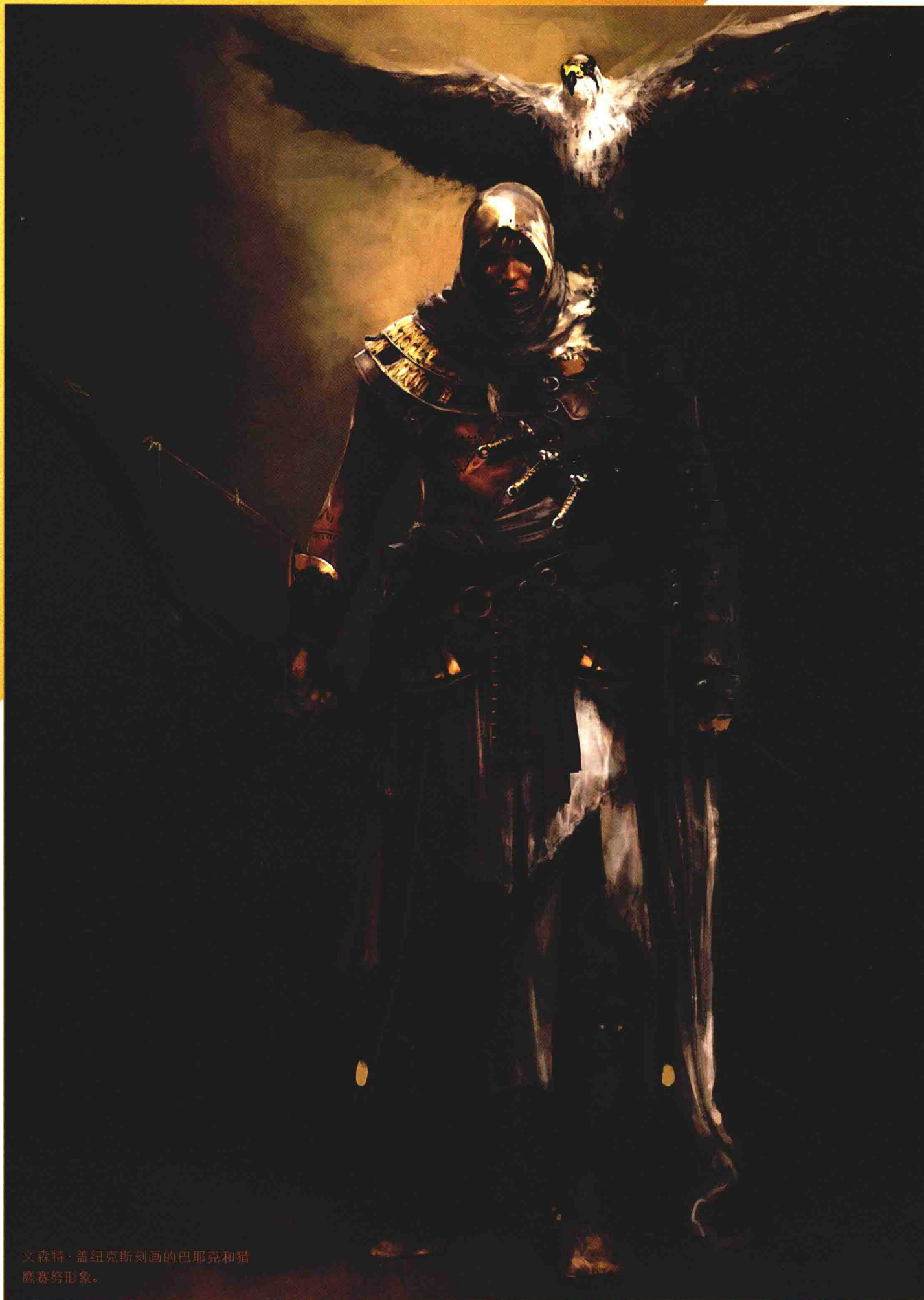
文森特·盖纽克斯刻画的巴耶克和猎鹰赛努形象。