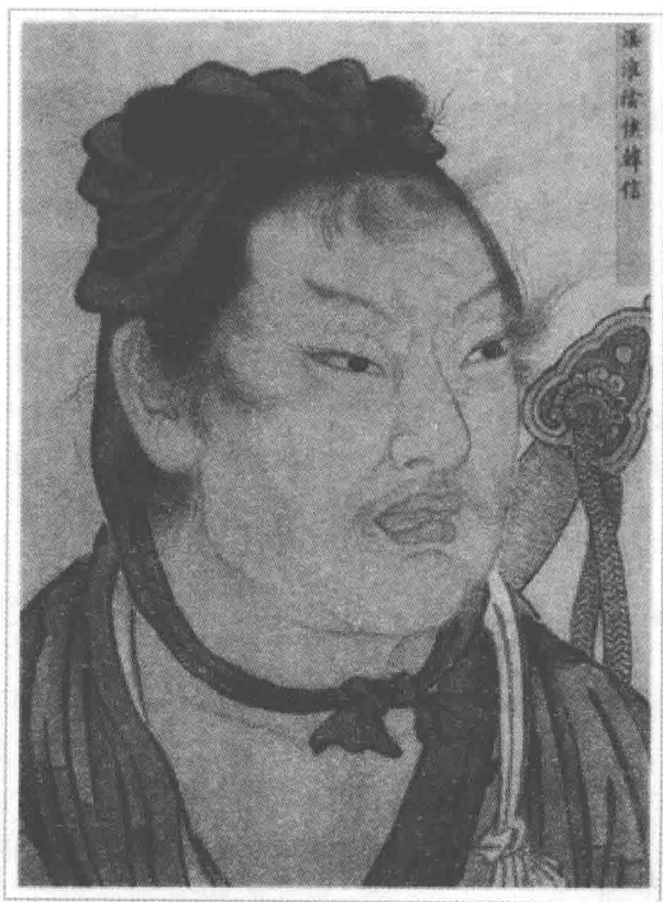
韩信 (? — 前196) 清殿藏本