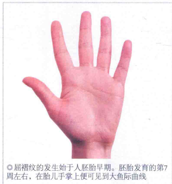
◎屈褶皱的发生始于人胚胎早期。胚胎发育的第7周左右，在胎儿手掌上便可见到大鱼际曲线

胎儿期手的形态和所形成的屈褶皱是其出生后手功能活动的决定因素。一般来说，大鱼际曲线是拇指和大鱼际肌垫对掌功能（即拇指与其他四指相对合的功能，它是手的最重要的功能）的结果。