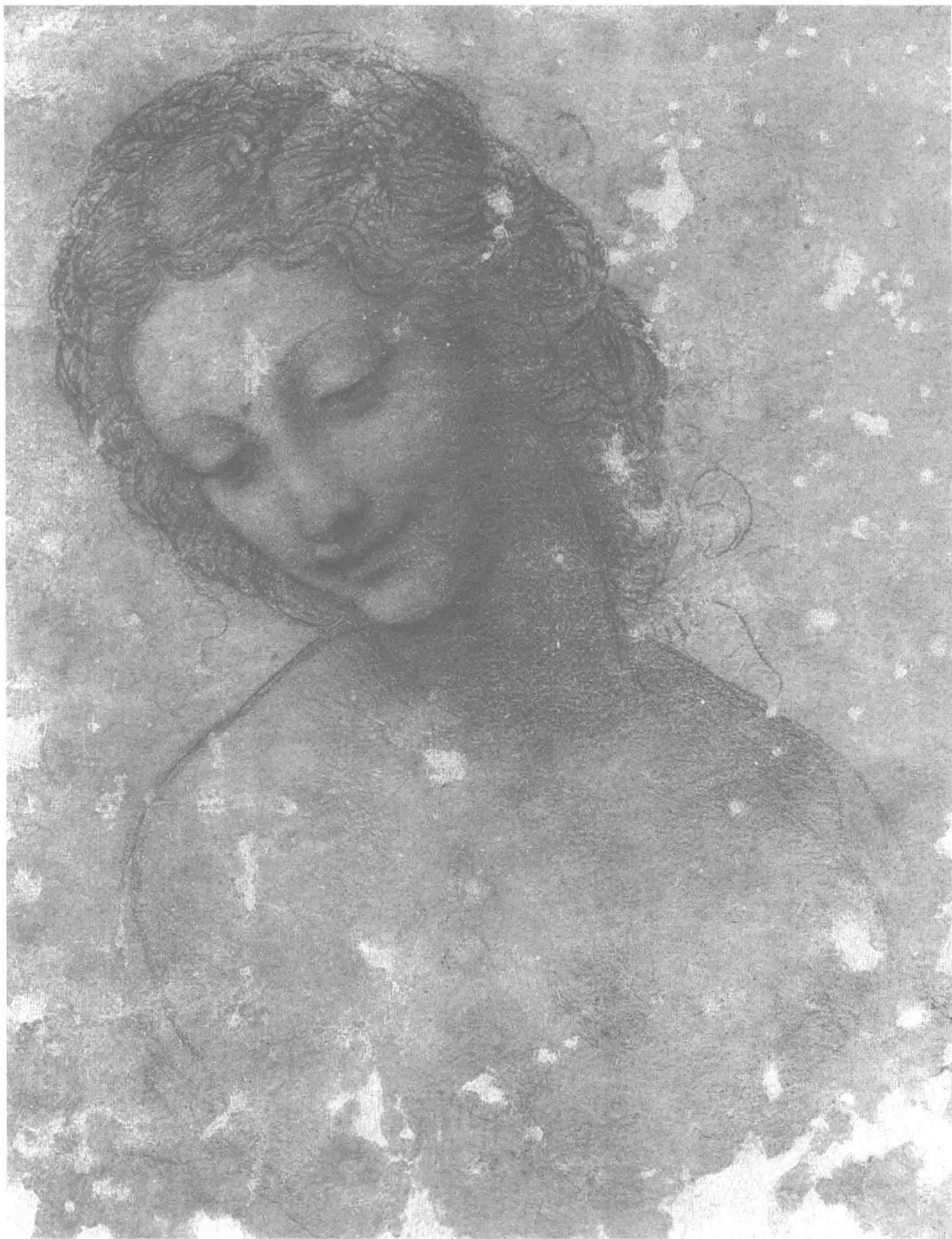
达·芬奇 丽达头像 20cm × 15.7cm 1510年

达·芬奇 (Leonardo da Vinci, 1452—1519) 是意大利文艺复兴时期最负盛名的艺术大师。他被广泛地认同为迄今为止最伟大画家之一，也是拥有最多不同类型的天赋的人，他在绘画、音乐、建筑、数学、几何学、解剖学等领域都有显著的成就，与米开朗基罗和拉斐尔并称“文艺复兴艺术三杰”。