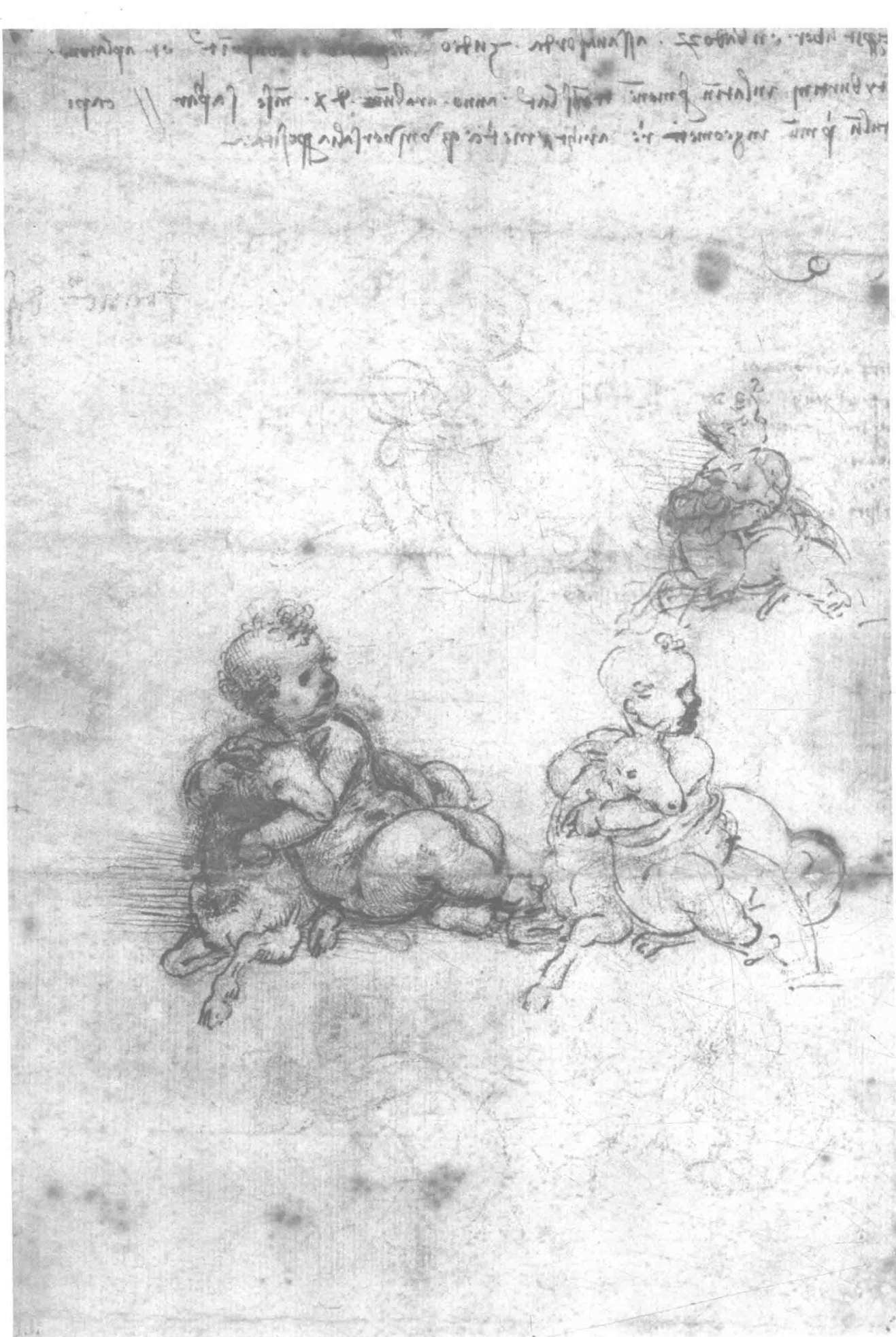
达·芬奇 抱着羊羔的儿童 21cm x 14.2cm 1503年