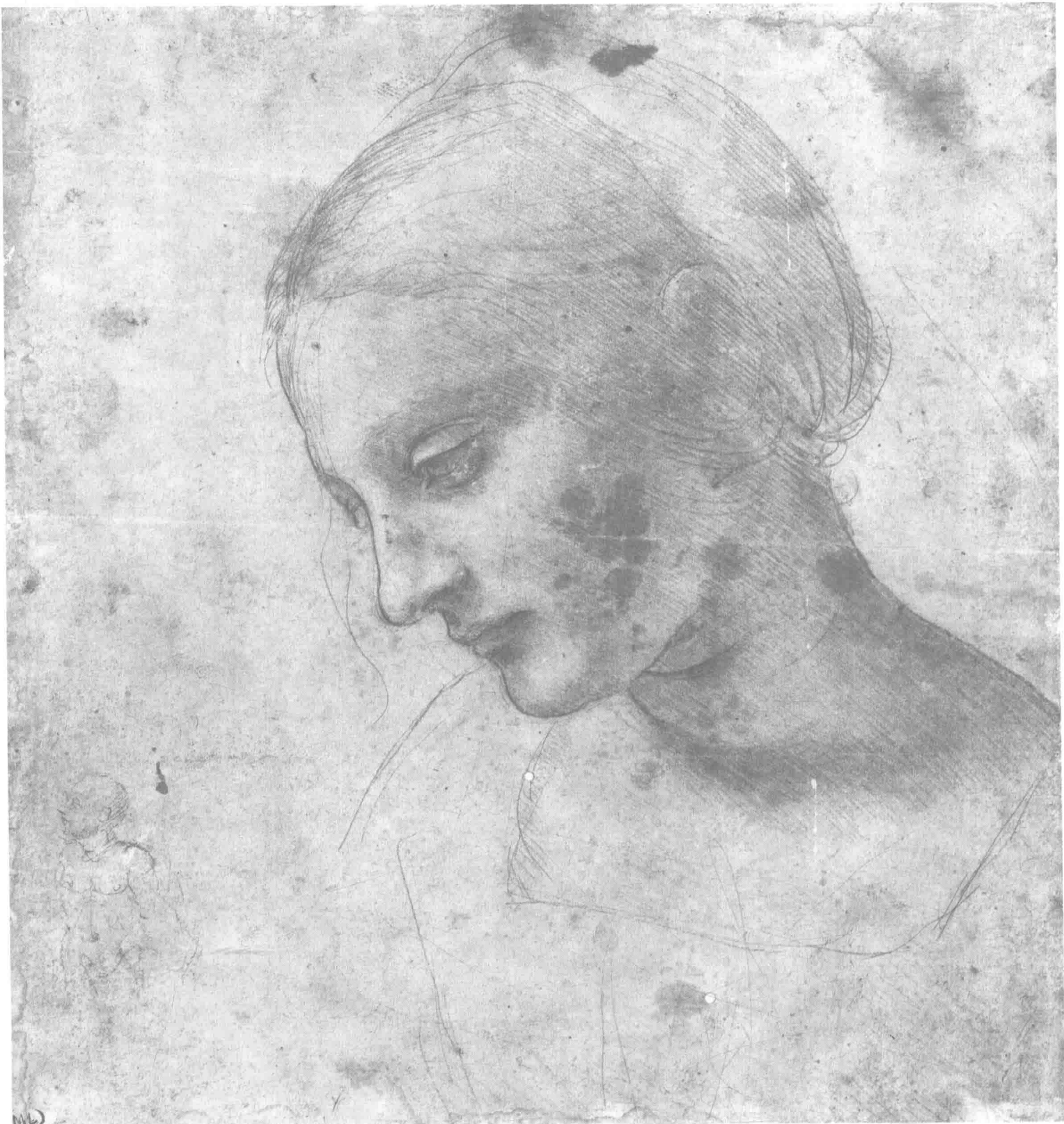
达·芬奇 女子头像 17.9cm×16.8cm 1480年