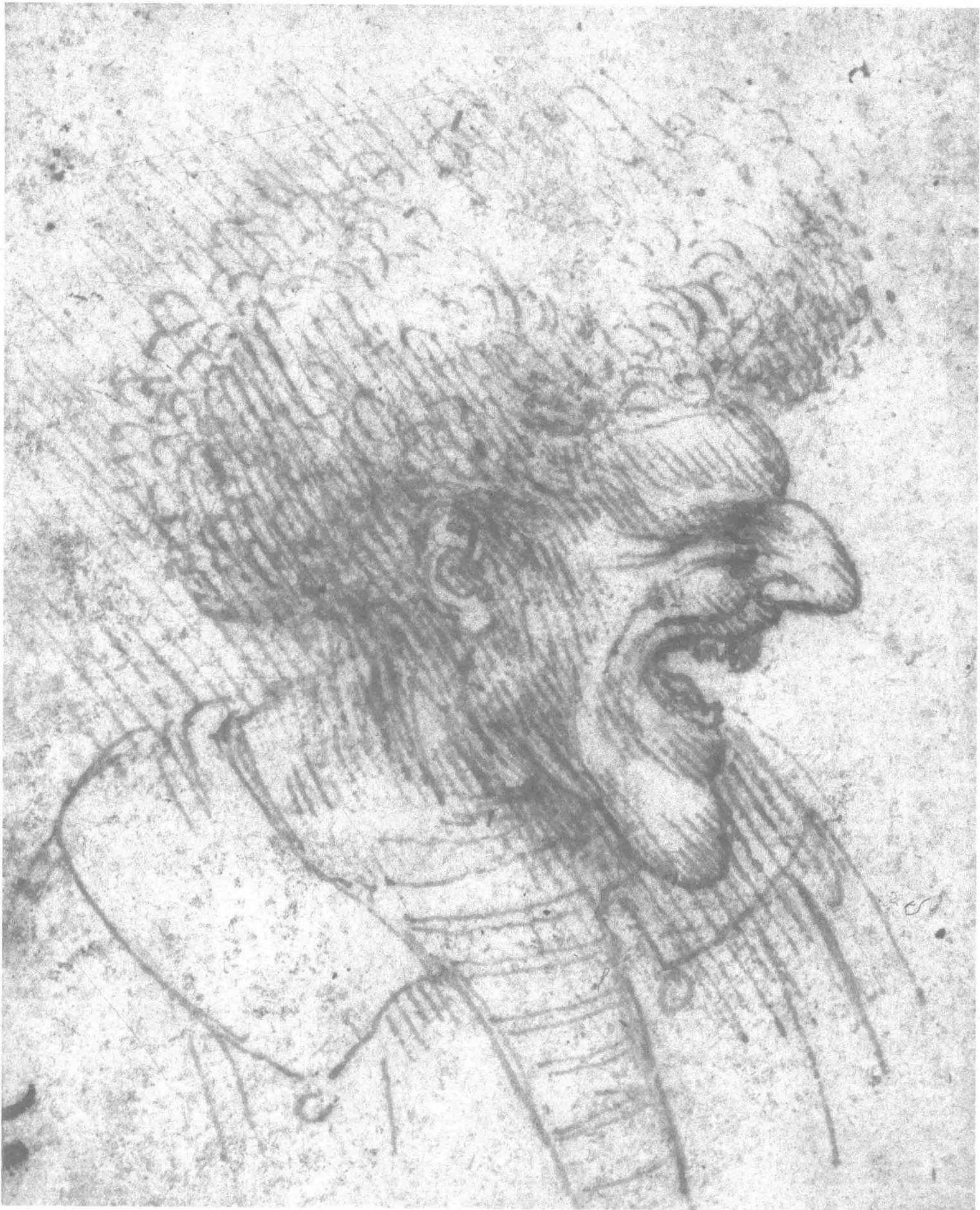
达·芬奇 长着浓密头发的人像 6.6cm×5.4cm 1495年