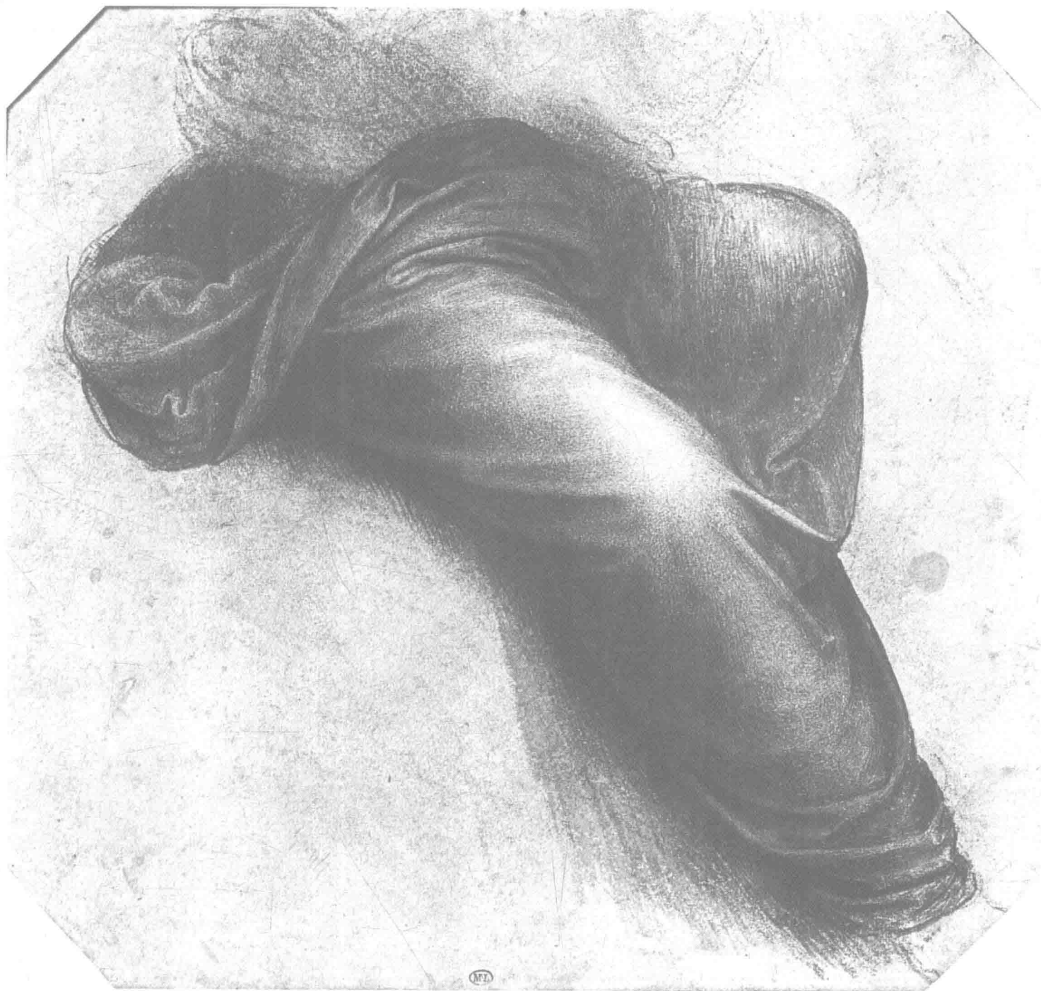
达·芬奇 衣褶研究 23cm x 24.5cm 1495年