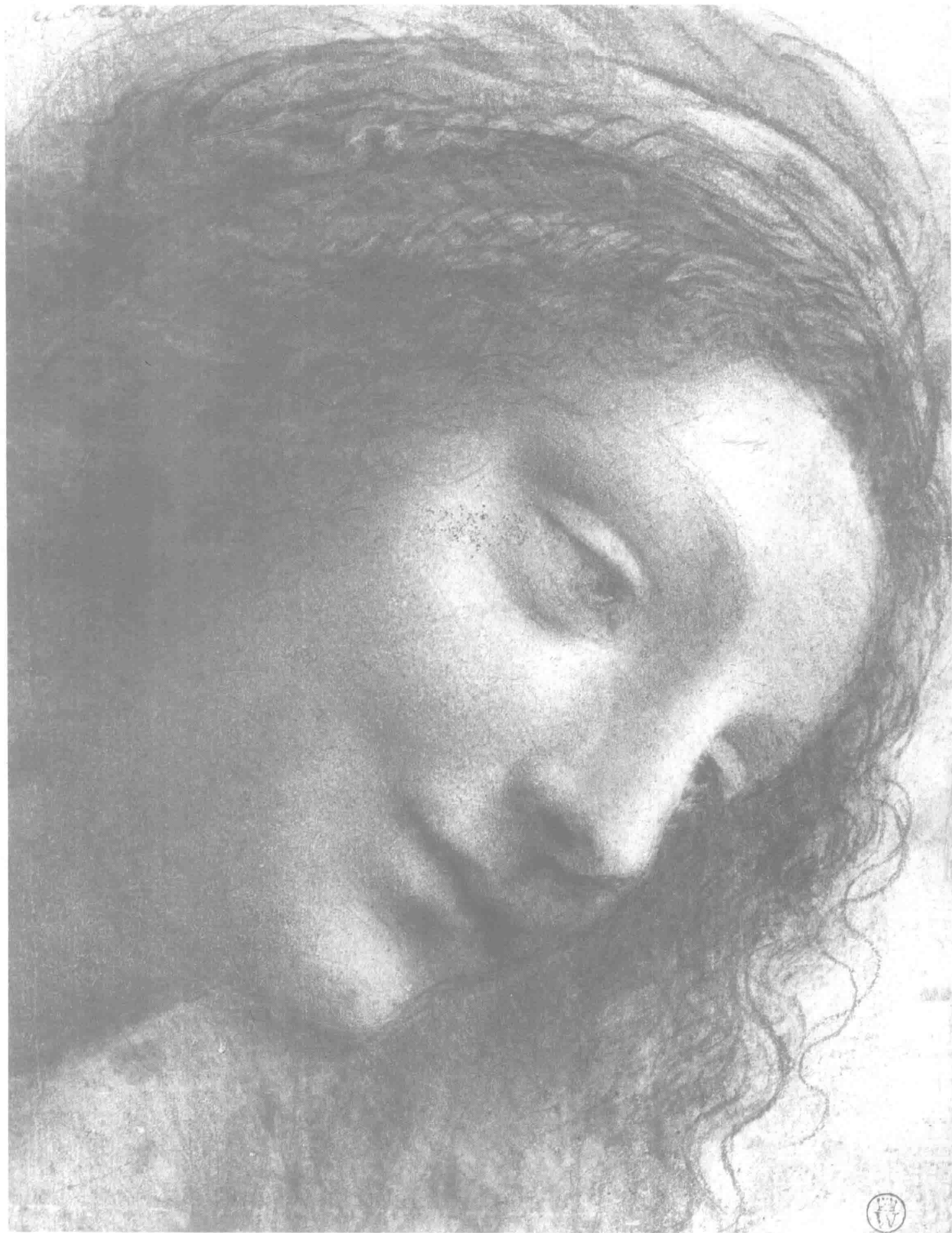
达·芬奇 圣母头像 20.3cm×15.6cm 1508年