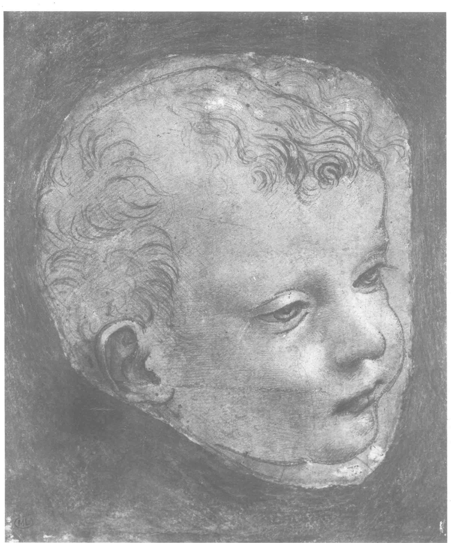
达·芬奇 四分之三侧面的男孩头像 13.4cm x 11.9cm 1480年